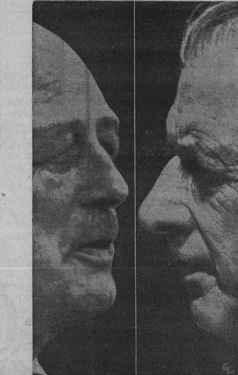
Britų premjeras Macmillan ir Prancūzijos prezidentas Charles de Gaulle taršis Paryžiuje gruodžio 15-16 d. d. tarptautiniais klausimais.

— Indonezijos gyventojas. Toje Naujosios Gvinėjos dalyje, kurią olandai sutiko atiduoti Indonezijai, gyvena apie 750,000 papuasų. Indonezijos sostinė Jakartoj gyvena apie 3 milijonai žmonių, o iš viso Indonezijoje yra per 97 milijonus gyventojų. Pagal gyventojų skaičių Indonezija yra penktoji valstybė pasaulyje: pirmoj vietoj Kinija, antroj Indija, trečioj Sovietų Sąjunga.