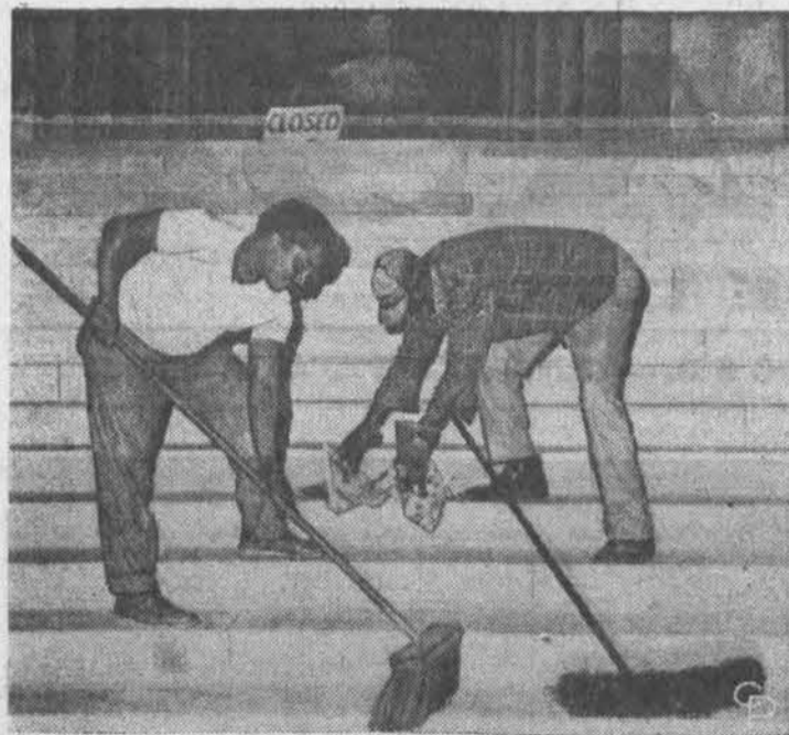
Po negrų civilinių teisių maršo Washingtono, sanitarijos departamento tarnautojai valo Lincolną paminklą nuo demonstrantų paliktų popierių ir kitų įvairių šiukšlių.

LB Soc. Klubo valdyba paruošė rašytinių petičių pavyzdį, kad senesnio amžiaus žmonių gydymo įstat. projektas