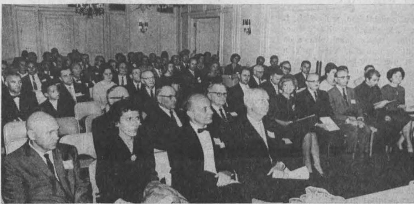
Vaizdas iš Amerikos Lietuvių Gydytojų Sąjungos jubiliejinio suvažiavimo šeštadienį Conrad Hilton viešbutyje Chicagoje.