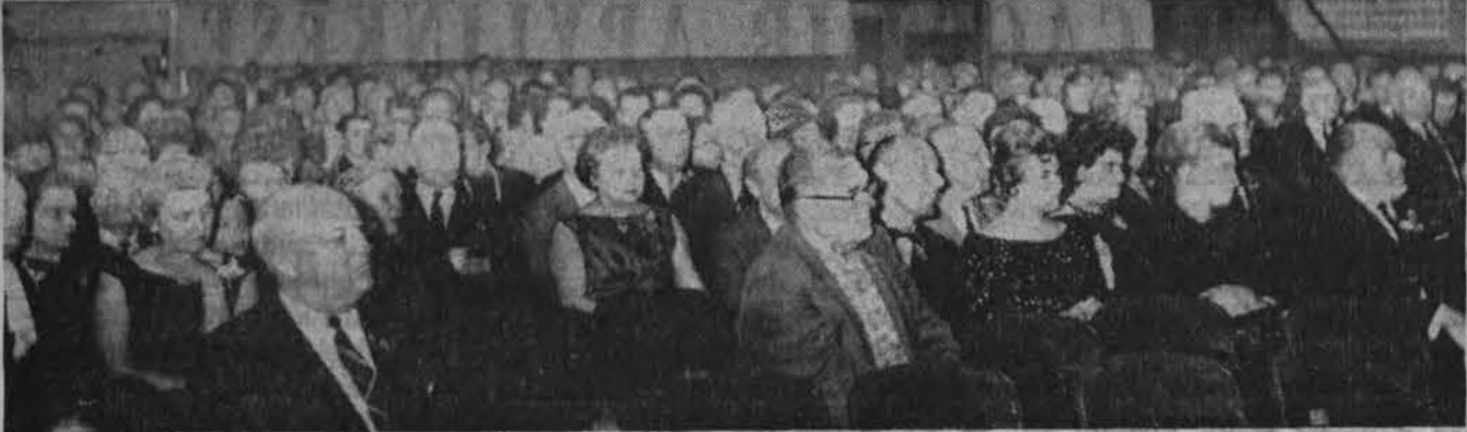
Svečiai Suvalkiečių d'ijos minėjime Chicagoje. Mi nėjimas įvyko spalio 27 d.