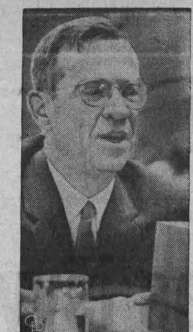
Federalinių rezervų tarybos pirm. McChesney kalba Washingtono 11 bil. dol. pajamų mokesčių sumažinimo reikalu. Jis buvo klausinėjamas dėl smulkių monetų klausimo, kuris iškilis mokesčius sumažinus.