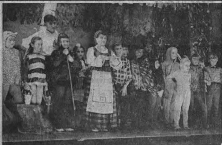
Vaidelio Miškio Plikio Tinginio vaidintojai. Vaidinimą Chicagoje buvo pastatęs Alvedo teatras lapkričio 17 d.

Dar taip neseniai į šią tragišką kategoriją įsijungė ketvirtas žmogžudys, žuvęs nuo kito žudiko rankos.