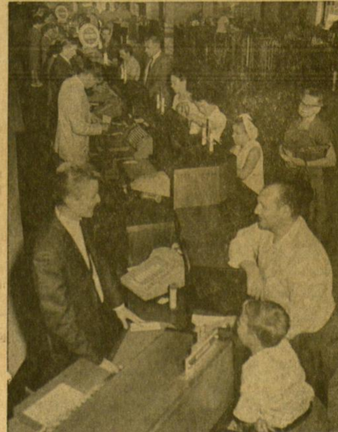
Chicago Savings bendrovės kasdieninis vaizdas darbo metu

CHICAGO SAVINGS & LOAN BENDROVĖ , 43 milijonų dolerių finansinė įstaiga, namus perkantiems ar statantiems žmonėms yra pilnai pasiruošusi duoti morgiausių prielamiausiomis sąlygomis, lengvais mėnesiniais išmokėjimais. Susidomėjusius kviečiame atvykti į Amerikos Lietuvių sostinės centrą — Marquette Parko apylinkę į CHICAGO SAVINGS & LOAN BENDROVĖ ir susitarti dėl paskolos.