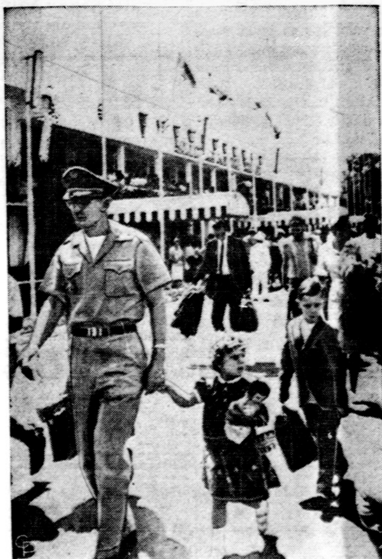
Amerikietis karys veda savo dukrelę į lėktuvą Saigone, pradėjus JAV karių ir civilių tarnautojų šeimų narius evakuoti iš Pietų Vietnamo, padidėjus ten krizei.

Oro biuras praneša: Chicagoje ir jos apylinkėse šiandien — galimas lietus ar sniegas. Saulė teka 6:52, leidžias 5:17.