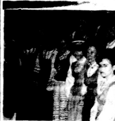
Vyčių choras atlieka programą Lietuvos vyčių bankete vasario 7 d. Chicagoje.