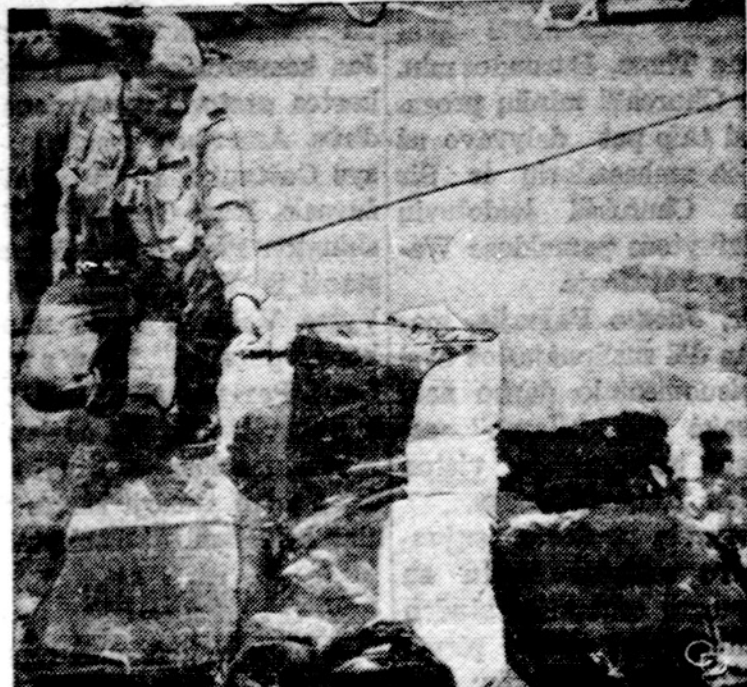
New Yorke praėjusį pirmadienį nukrito Eastern oro linijos lėktuvas į jūrą netoli Long Island. Žuvo 84 asmenys. Čia matyti traukiamos iš Atlanto lėktuvo liekanos.