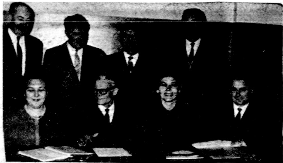
1965 m. Detroito Balford sk. valdyba ir revizijos komisija.