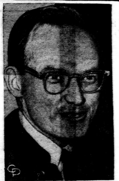
Iš Vietnamo sugrįžęs prez. John- sono pasiuntinys George Bundy, vienas patarėjų saugumo reikalais, tarėsi su prezidentu, po to, kai vakar bolševikai vėl puolė ameri- kiečių bazes.

— Amerikos oro biuras įsteig- tas 1870 m. vasario 9 d. prie karo departamento. 1940 m. jis pavestas agrikultūros departa- mentui.