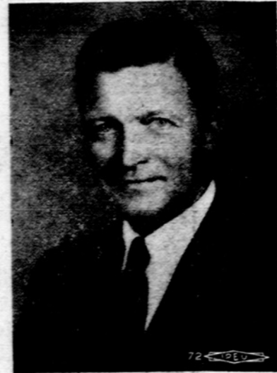
Otto Kerner, Illinois gubernatorių

"Kadangi, 1965 m. vasario 16 d. bus minima Lietuvos res-