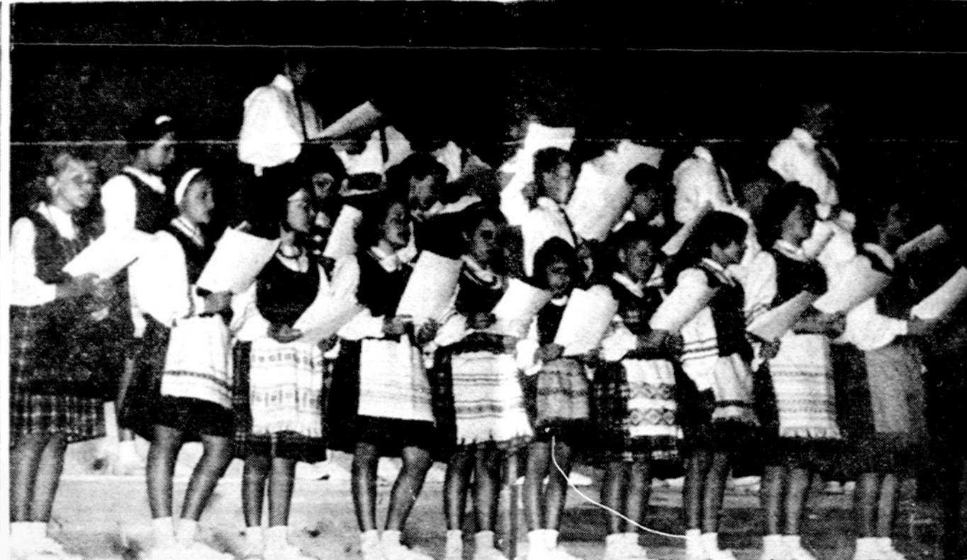
LB Detroito lit. šeštadienės mokyklos mokiniai dainuoja parengimo metu.