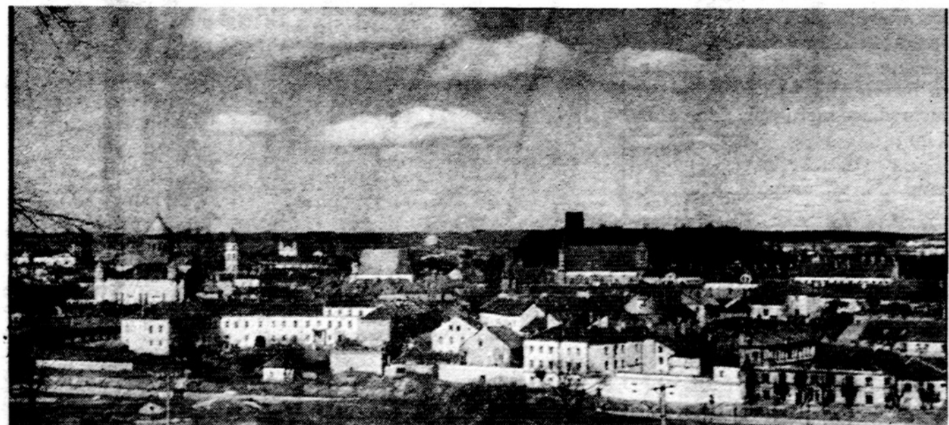
Vilnius, kuriame buvo pasirašytas Lietuvos nepriklausomybės atkūrimo aktas.