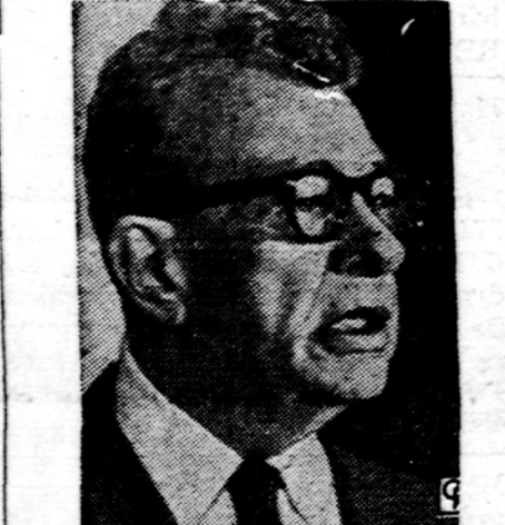
Sen Dirksen (R.-III.), mažumos vadas Senate, remia prezidento politiką Vietname.

Nepaskelbtas ir be frontų karas jau pateko į naują vagą. kai iprastinėmis priemonėmis nėra vilties ne tik Saigono vyriausybei, bet ir JAV laimėti. JAV griebsi atkirtio puolimą. Iš seno žinoma, kad Vietkongas gauna paramą iš šiaurinio Vietnamo, kuris pastaruoju metu Kinijos įtakoje. Galimas dalykas, kad šiaurinis Vietnamas, kuris svajoja apie pietinio Vietnamo derlingus laukus ir ža-