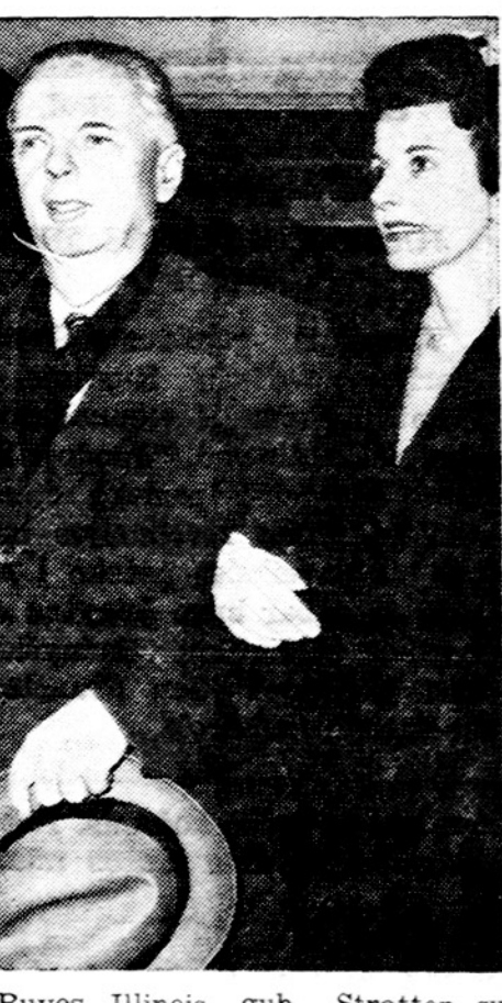
Buves Illinois gub. Stratton su žmona išėina iš teismo, kur jis teisiama, kad yra nusukęs pajamų mokesčius.