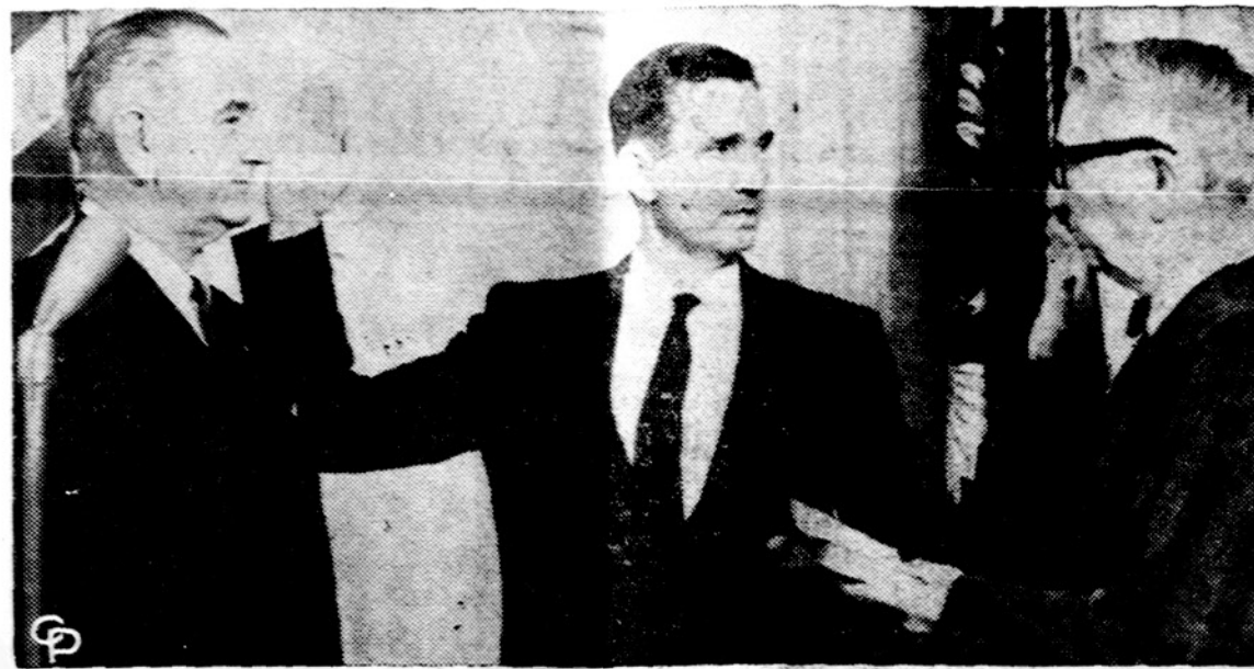
Aukščiausio teismo teisėjas Tom Clark (dešinėje) prisaikdina savo sūnų Ramsey kaip teisningumo sekretoriaus pavaduotoją. Priesaiką stebi prez. Johnson. Sekretorius, užimas anksčiau turėję Robert Kennedy postą, yra Nicholas Katzenbach.

Visu galingiausiajį jėga yra nekaltas širdis. — V. Hugo