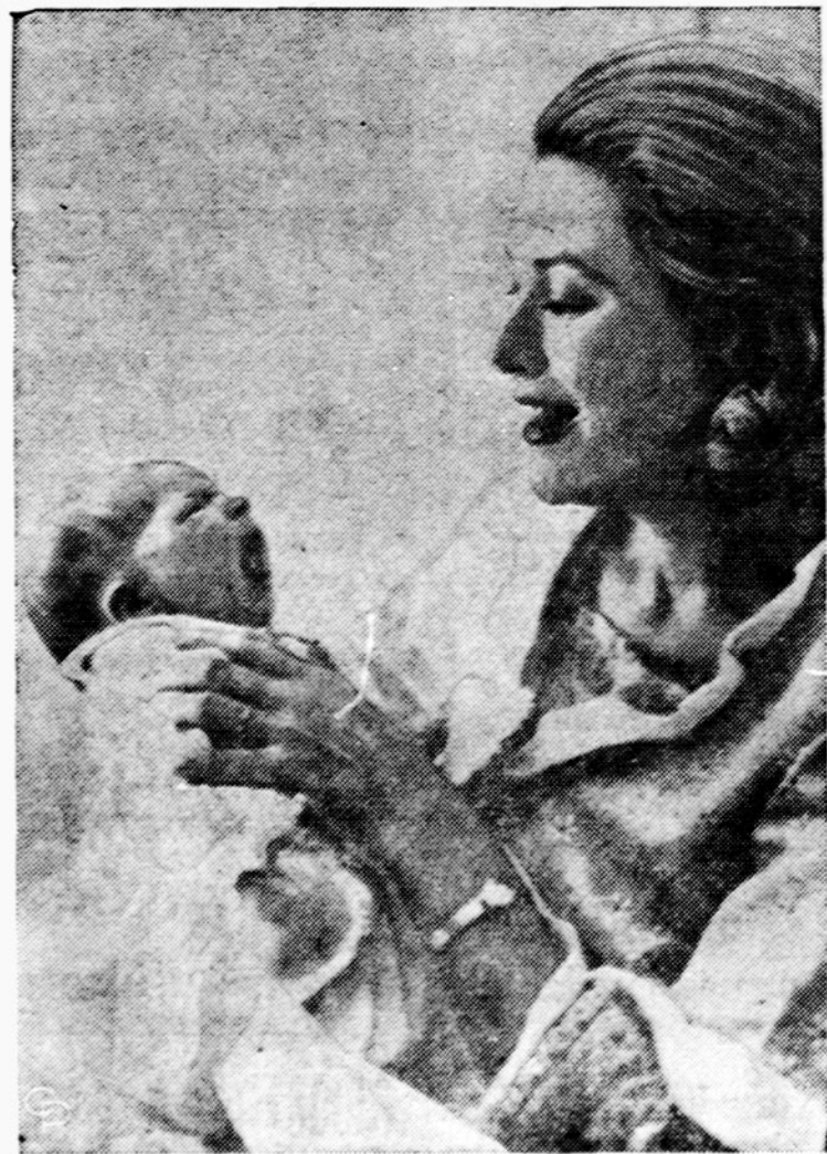
Aktorė motina džiaugiasi naujagime. Monaco princesės Grace rankose, yra josios naujagimė dukrelė princesė Stefanija. Seimoje auga dar du vaikai; mergaitė ir berniukas.

— Amerikoj pirmą amerikiečių baletą trupė pasirodė New York'e Bowery teatre 1827 m. vasario 7 d.