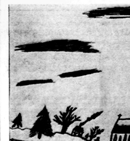
Pėsti ir važuoti skuba į bažnyčią pasimelsti už tėvynę. Piešė R. Ališauskas, Montrealo Liet. Aušros Varty m-los III sk. mok.

Pirmas pieštukas buvo pagamintas Prancūzijoje 1795 metais pagal Napoleono įsakymą.