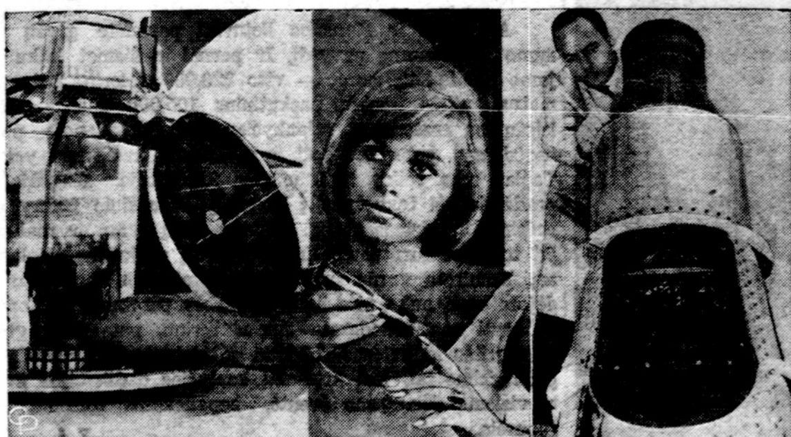
Nuotraukoj demonstruojami aparatai, kuriais raketa į mėnulį Ranger 8 (dešinėje) siunčia nuotraukas žemėn. Mergaitė technikė Toth demonstruoja RCA televizijos žvakę, reikalingą nuotraukų persiuntimui. Ranger 7 ligi atsimušė į mėnulį persiuntė 4.316 nuotraukų. Ranger 8 nuotraukas siųs 65 valandas.

Remkite tuos, kurie skelbiasi dienr. Drauge.