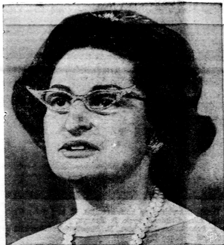
Prez. Johnson žmona Lady Bird kalba Amerikos Širdies d-jos suvažiavime Washington.