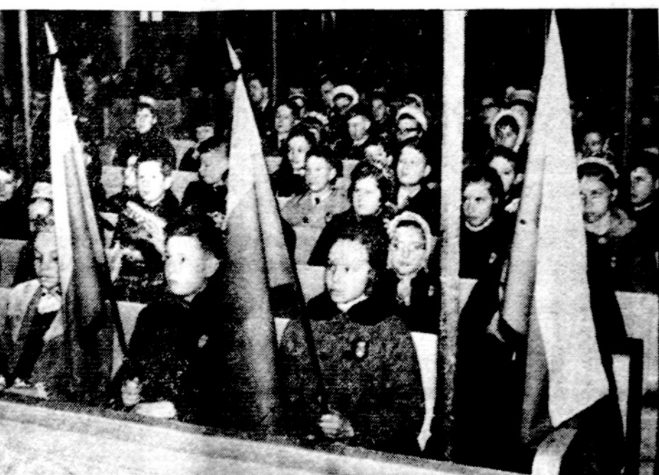
Marquette Parko Lituanistinė mokykla švenčia Vasario 16-tą į vainikavimo dieną vasario 13 d. Svė P. M. Gimimo parap. bažnyčioje. Priekyje LB vietos apylinkės mokyklos skyriams įteiktos tautinės vėlavos, kurios ta proga bažnyčioje buvo pašventintos ir dabar visam laikui paliktos kiekvienoje tos mokyklos klasėje.

Bendrai, visas minėjimas buvo originalus ir gražiai organizuotas. krp.