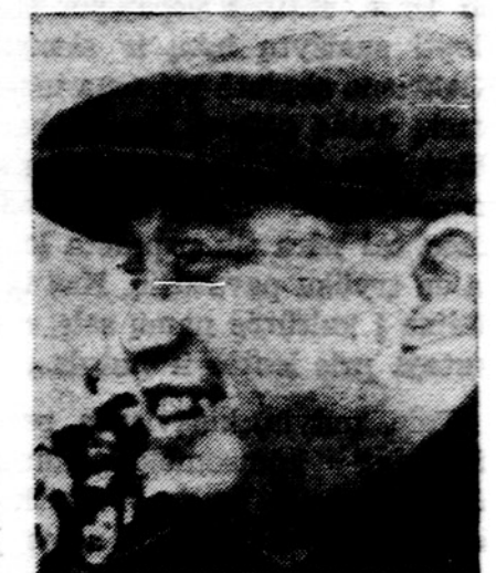
Šiaurės Korėjos premjeras Kim Il-Sung, kuris pažadėjo šiaurės Vietnamui pagalbą drauge su Sovietų Sąjunga.

Tas kitas komunistinės traukos centras yra Pekinas. Pekinas Maskvai yra pavojingesnis negu visi Vakarai kartu. Maskva žino, kad vienintelis jos prie-