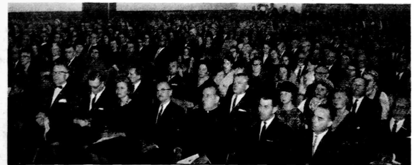
Clevelando lietuviai dalyvauja Vasario 16-sios minė jime naujosios parapijos salėje.