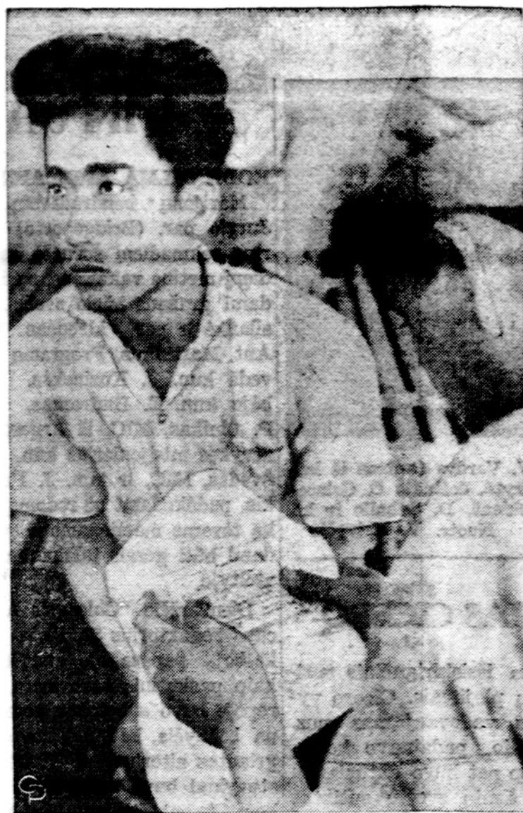
Apklašinėjamas netoli nuo Saigono pagautas komunistų partizanais. Dažnai jie dieną dirba, o naktį partizanauja.