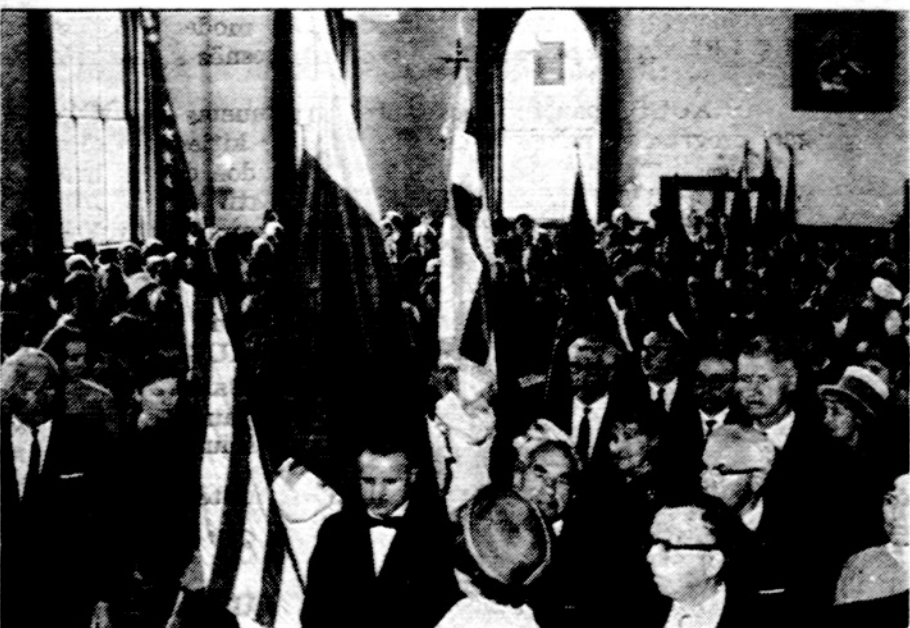
Įnešamos vėliavos Los Angeles parapijos salėn prieš pradėdant Vasario 16 minėjimą.

The U.S. Government does not pay for this advertisement. It is presented as a public service in cooperation with the Treasury Department and the Advertising Council.