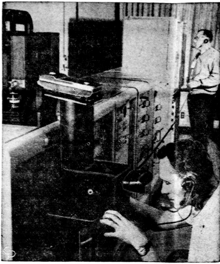
Goldstone, Calif., Propulsion laboratorijoje priimamos nuotraukos, kurias siuntė iš mėnulio raketa Ranger 8.