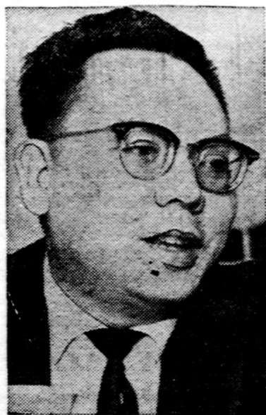
Lt. gen. Tran Thien Khiem, 40 metų, Pietų Vietnamo ambasadorius Washingtono, palaiko sukilėlius, kurie lt. gen. Khanh pašalinė iš pietų Vietnamiečių kariuomenės vado pareigų.

— Prezidentas Johnsonas vakar Kentucky universitete Lexington, Ky., gavo teisių garbės doktoratą. Kentucky universitetas yra 100 metų senumo. Jis pasakė, kad Jungtinės Amerikos Valstybės turi tikslą išlaisvinti žmones iš tironijos.