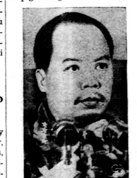
Lt. gen. Nguyen Khanh generolų išstumtas iš Pietų Vietnamo karinių dalinių vyriausiojo vado posto.

— Aš džiaugiuos, kad mūsų vyriausybė niekada nepripažino Sovietų įvykdyto Lietuvos inkorporavimo į Sovietų Sąjungą. Pone pirmininke, aš didžiuliuoju galėdamas jungtis prie vilčių ir maldų, kurios šiandien buvo pareikštos, kad Lietuvos nepriklausomybė būtų atstatyta kaip galima greičiau.