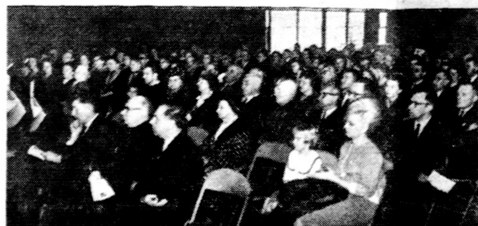
Visuomenė susirinkusi į Lietuvos nepriklausomybės minėjimą Brighton Parko lietuvių parapijos salėje.