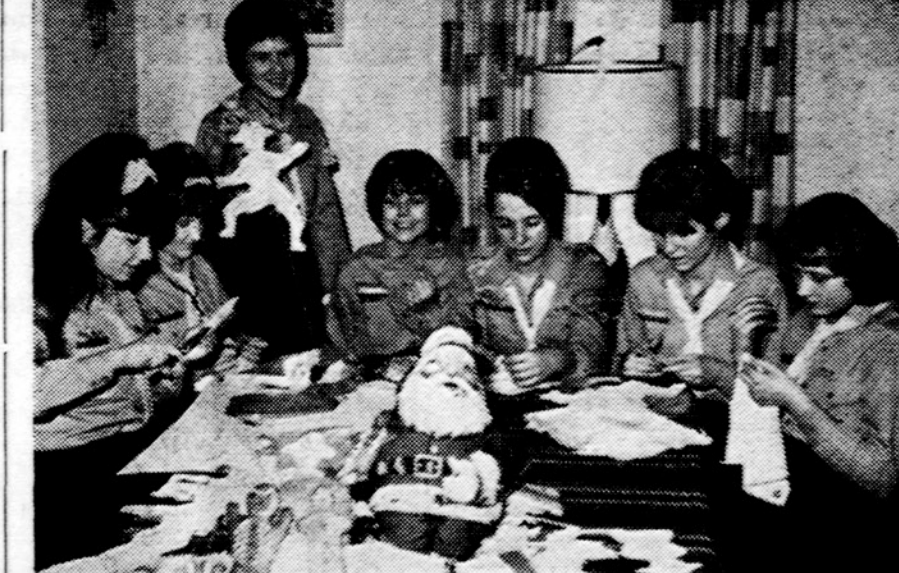
Neringos tunto Clevelande skautės daro rankdarbius Kaziuko mugėi. Sėdė palia (stovi) laiko popierinį skautuką, kurį jos daug pridarys ir patampius už virtutes darys juokingus judesius.

Amerikos Lietuvių tarybos Clevelando skyriaus organizacijų susirinkimas įvyksta