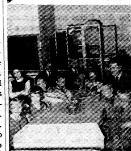
Alvudo kultūriniam penktadienį je vaikučių dalis su tėveliais žiūrė filmą apie Lietuvų dieną pasaulinės parodos metu New Yorke.