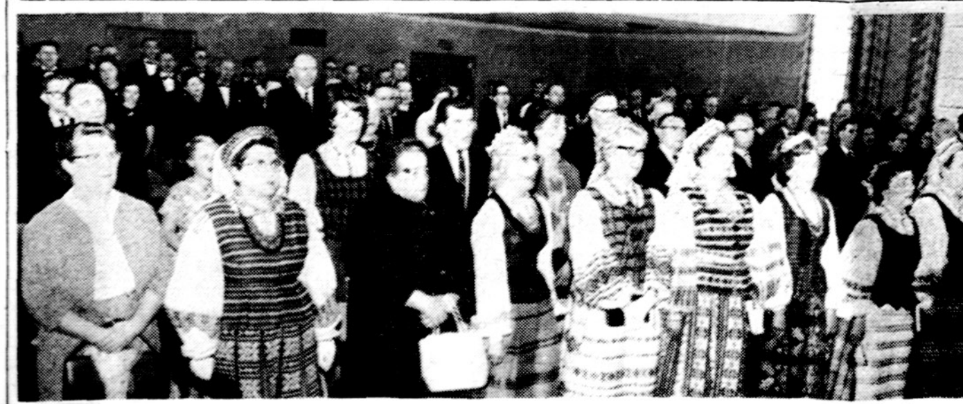
Vl. Putvinskio minėjimo dalyviai vasario 28 d. Jaunimo centre.