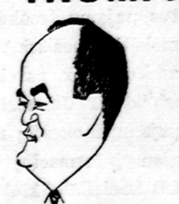
Hubert H. Humphrey

— Viceprezidentas Hubert H. Humphrey šeštadienį Hartforde, Conn., pasakė, kad Jungtinės Amerikos Valstybės pasiūlys Vietnamui, kol komunistai nesustabdys agresijos ir karin-gumo.