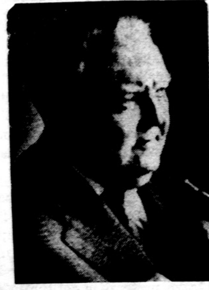
L. Erhardas, V. Vokietijos kancleris, paskelbė kad Bonnos vyriausybė nutarė užmezgti diplomatinis santykius su Izraeliu.