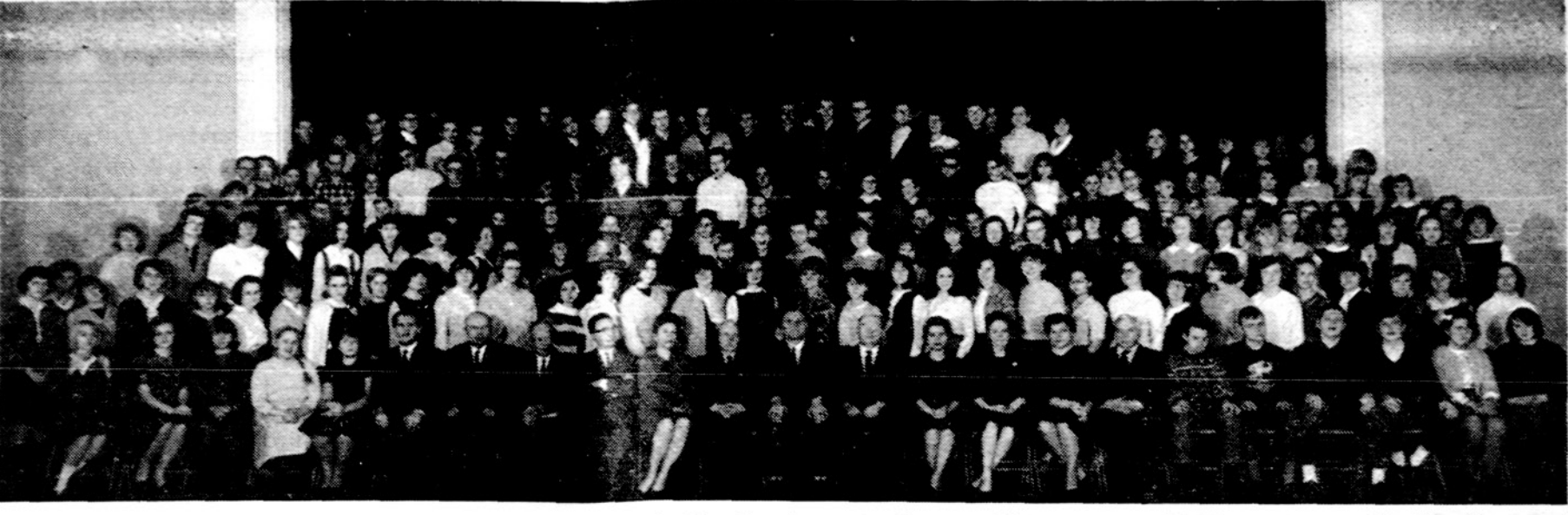
Chicago Aukšt. lit. mokyklos mokiniai ir mokytojai. Šiandien kovo 11 d. mokyklai sueina penkiolika metų.

× Spalvotos televizijos ateities tiesiog į jūsų namus, be jokių nučiūpinėjimų, kokios tik norėsit su kompanijų garantijom. Kreiptis į Balio Radijų ir TV krautuvę, 2646 W. 71 St. PR 8-5374. Sąžiningas patarnavimas, duodama išsimokėjimui. (sk.)