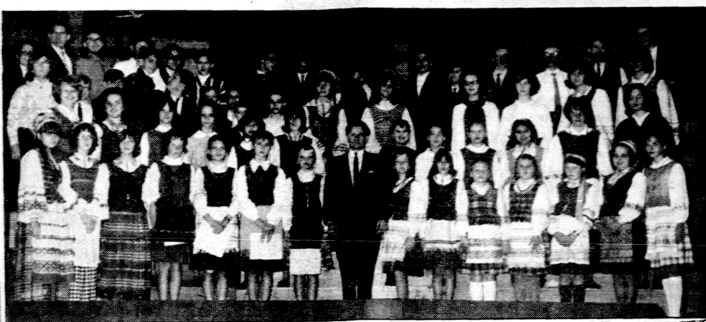
LB Detroito lituanistinė šešt. mok. choras. Choriui vadovauja mok. ved. St. Sližys. Choras gražiai pasirodė Vasario 16 d. minėjime. Nuotr. J. Gaižučio

Kovo 7 d. K. Sragausko bute susirinkę varduvininko bičiuliai