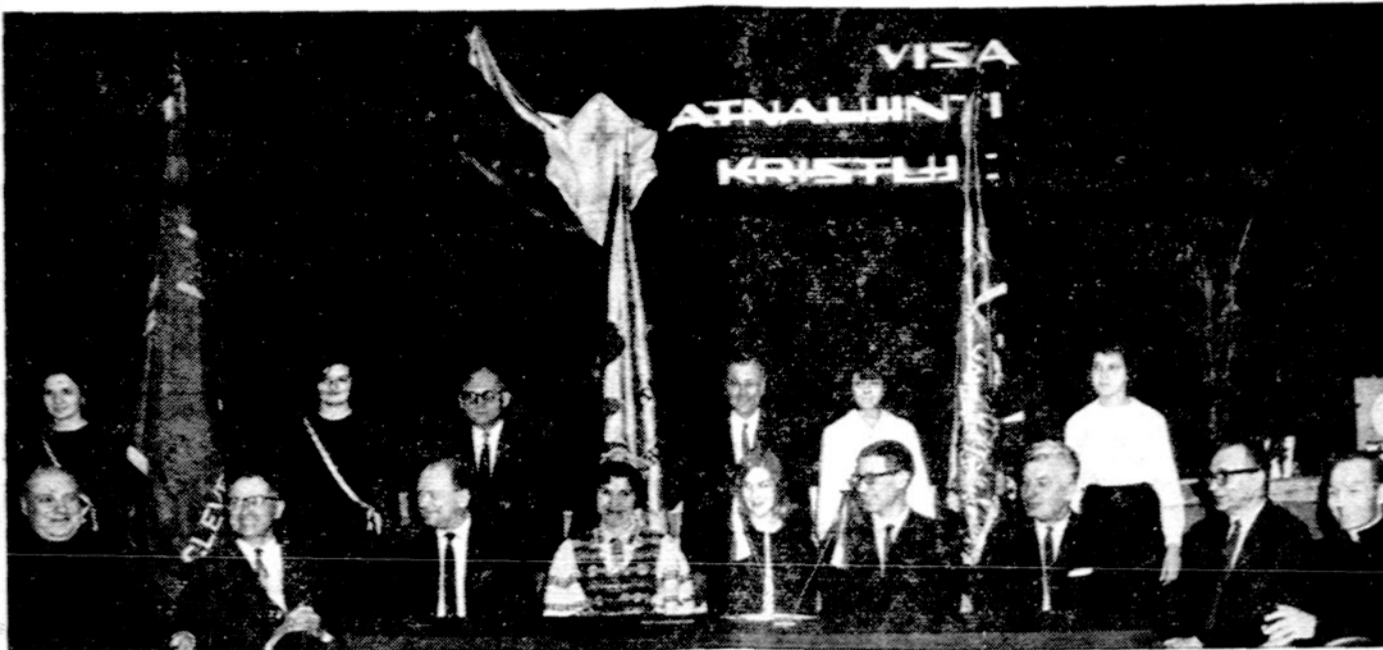
Garbės prezidiumas Clevelando Ateitininkų šventėje vasario 28 d.

Tad, kai iš Globos komiteto narių kreipiasi į jus mielas lietuvi, ar pasibels į jūsų duris, bet atsidarykite ne tik jas, bet savo širdis ir pinigines. Išleistas do-