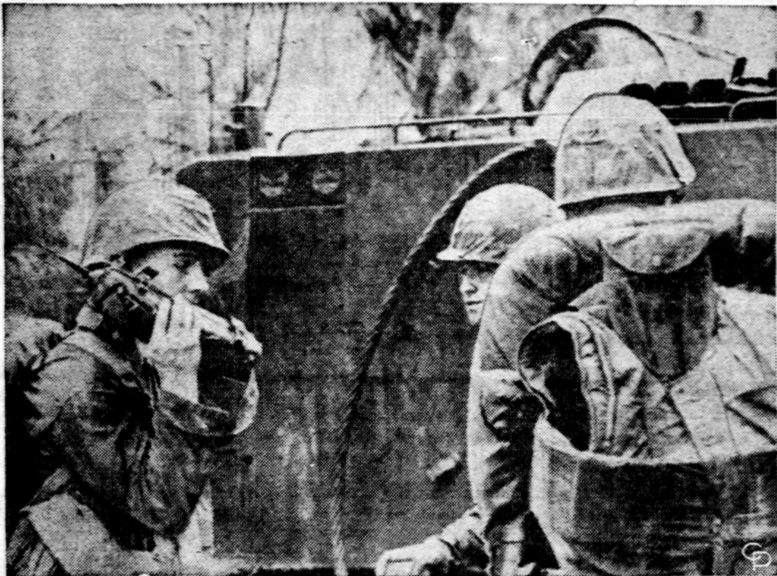
JAV-ų jūrų pėstininkai (marinai) užėmė gynybos poziciją didžiulėje Amerikos aviacijos bazėje Da Nange, Pietų Vietname. Ši bazė yra 80 mylių pietuose nuo Šiaurės Vietnamo pasienio.