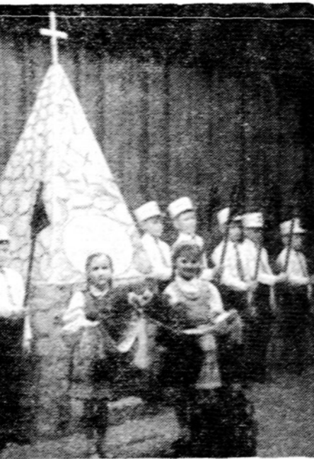
Karaliaus Mindaugo šeštadieninės mokyklos mokiniai, atlikę Kauno Karo muziejaus vėliavos nuleidimo - žuvusių už Lietuvos laisvę ir garbę pagerbimo apeigas.