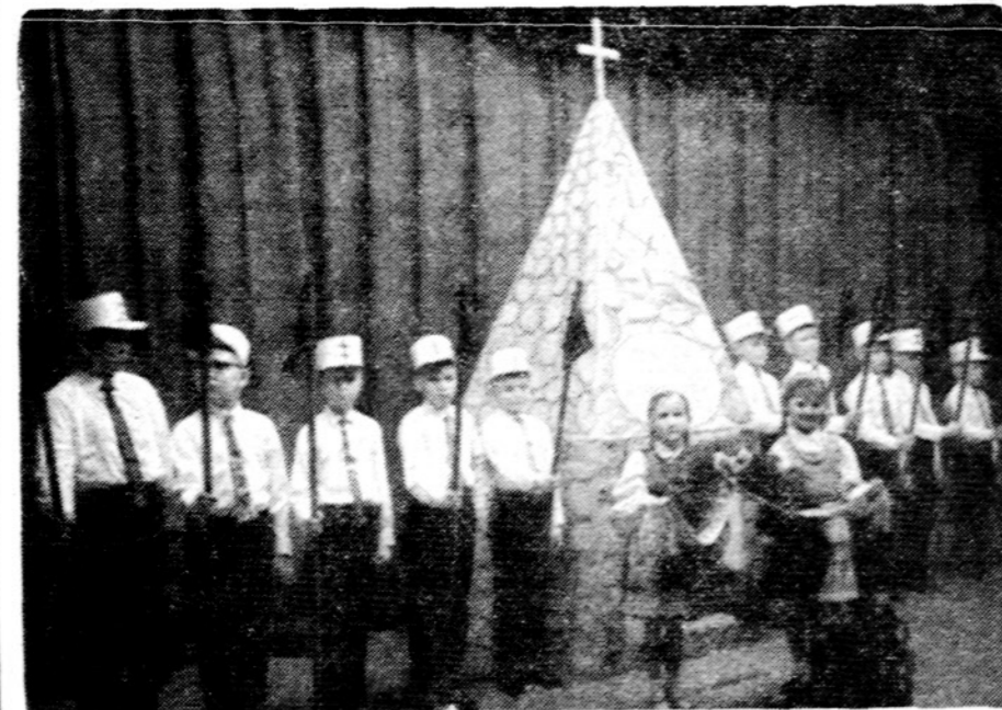
Karaliaus Mindaugo šeštadieninės mokyklos mokiniai, atlikę Kauno Karo muziejaus vėliavos nuleidimo - žuvusių už Lietuvos laisvę ir garbę pagerbimo apeigas.

Minėjimo pabaigai dramos mėgėjų būrelis "Svaja" suvaidino G. Veličkos 1 veiksmo scenos vaizdelį "Lėk, lėk, sakalėli", vaizduojantį tą skaudų momentą, kada bolševikų armijai antartį kartą plūstant Lietuvon, vieniems teko bėgti į Vakarus, kitiems išeiti partizanais. Šis vaiz-