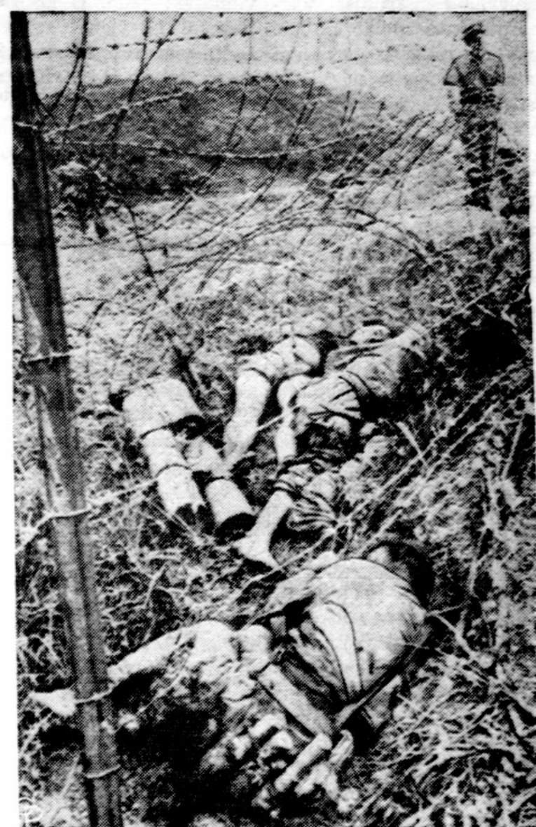
Trys Viet Congo partizanai krito kovoje prieš amerikiečių specialiąją jėgų stovyklą, apsuptą spygliuotomis vielomis Pietų Vietname. Tie žuvę partizanai yra iš 100 vyrų būrio, kuris puolė stovyklą kalnuotoje Bin Dinh provincijoje.

— Jungtinių Amerikos Valstybių vidaus reikalų sekretorius Udall ragina amerikiečius, kad jie lankytų pirmiausia savo krašto įžymybes ir sutauptų dolerius. Pernai 8 milijonai turistų amerikiečių užsienioje paliko 2 bilijonus dolerių.