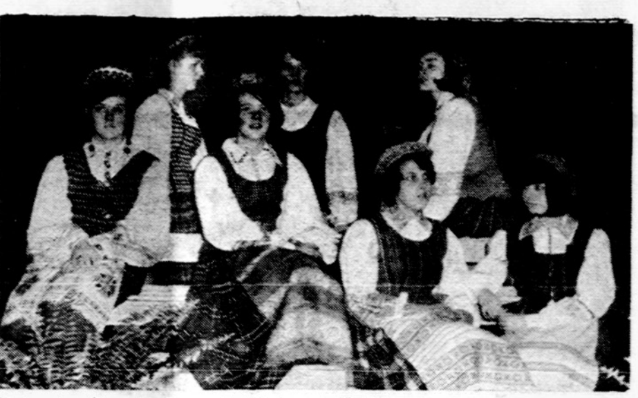
Maironio Clevelando moksleivių ateitininkų kuopos vyresn. moksleivės: Martutė, Balčiūnaitė, Razgaitytė, Banionytė, Zilytė, Neimanaitė, Eidimaitės.

× Lituanicos Tunto tėvai prašomi atsiimti indus, pasilikusius nuo Kaziuko mugės, šį sekmadienį, 12 val. Jaunimo centre pas p. Kurauskienę. Vėliau indai nebus atvežami. (sk.)