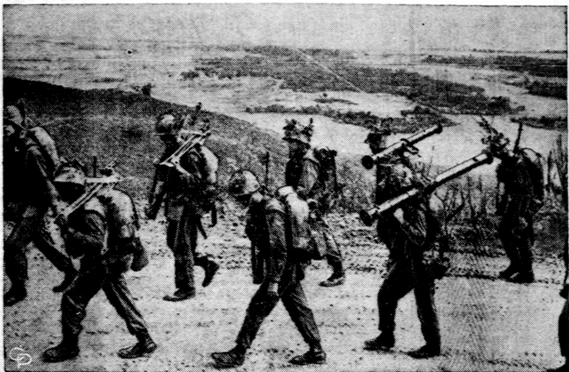
JAV-ų jūrų pėstininkai (marinai) lipa į kalvą gynybai netoli aviacijos bazės Da Nangos, P. Vietname.