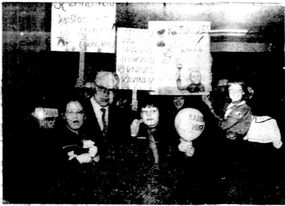
Chicago skautų Kaziuko mugė, žurn. J. Janušaitis tarp jaunimo, reklamuojančio skanius lietuviškus valgius.