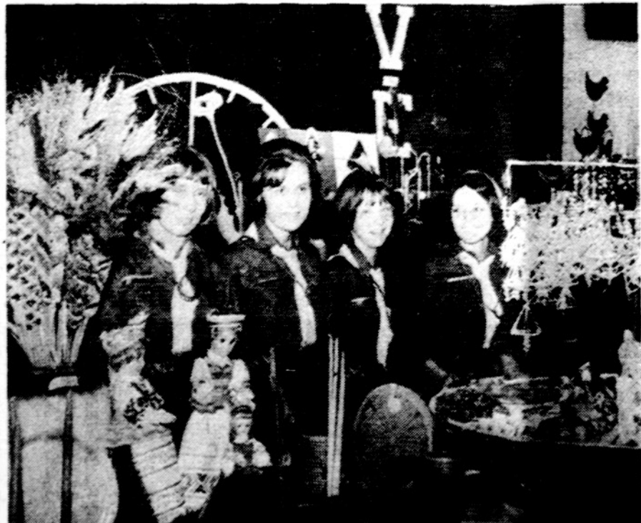
Kernavietės prie savo pagamintų rankdarbių Chicago skautų "Kaziuko" mugėje.

— O kaip tuos vaistus vartoti? Ar prieš valgį, ar po valgio?