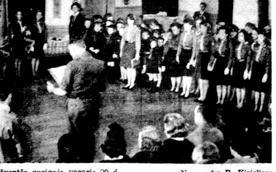
New Yorke skautai šv. Kazimiero šventėje sueigoje vasario 29 d.

lietuvių auditorijoje. Bus renka ma apylinkės valdyba ir kontrolės komisija ir svarstomi kiti svarbūs klausimai, tad kviečiami visi nariai gausiai dalyvauti. Apylinkės valdyba savo pasukiniame posėdyje, įvykusiame kovo 12 dieną, be kitų svarstomų klausimų padarė ir pinigų paskirstymą įvairioms organizacijoms: Altui 168.37 dol., Lituanus žurnalui paremti 100 dol., Tautinių šokių mokytojams paruošti 65 dol., Vasario 16 d. gimnazijai paremti 50 dol., Pedagoginiam institutui paremti 50 dol., šv. Baltramiejaus parapijos pradžios mokyklos mokyto. seselėms kazimierietėms 35 dol., LB leidžiamam laikraščiui "Pasaulio lietuvis" paremti 25 dol., Chicago Lietuvių operai paremti 25 dol., leidiniams pirkti, kurie bus įteikti Waukegan miesto bibliotekai 20 dol. Be to, išdiniui pavedė perduoti LB centro ir Chicago apygardos valdyboms surinkto 1964 m. nario mokesčio priklausancias dalis. Korespondentas