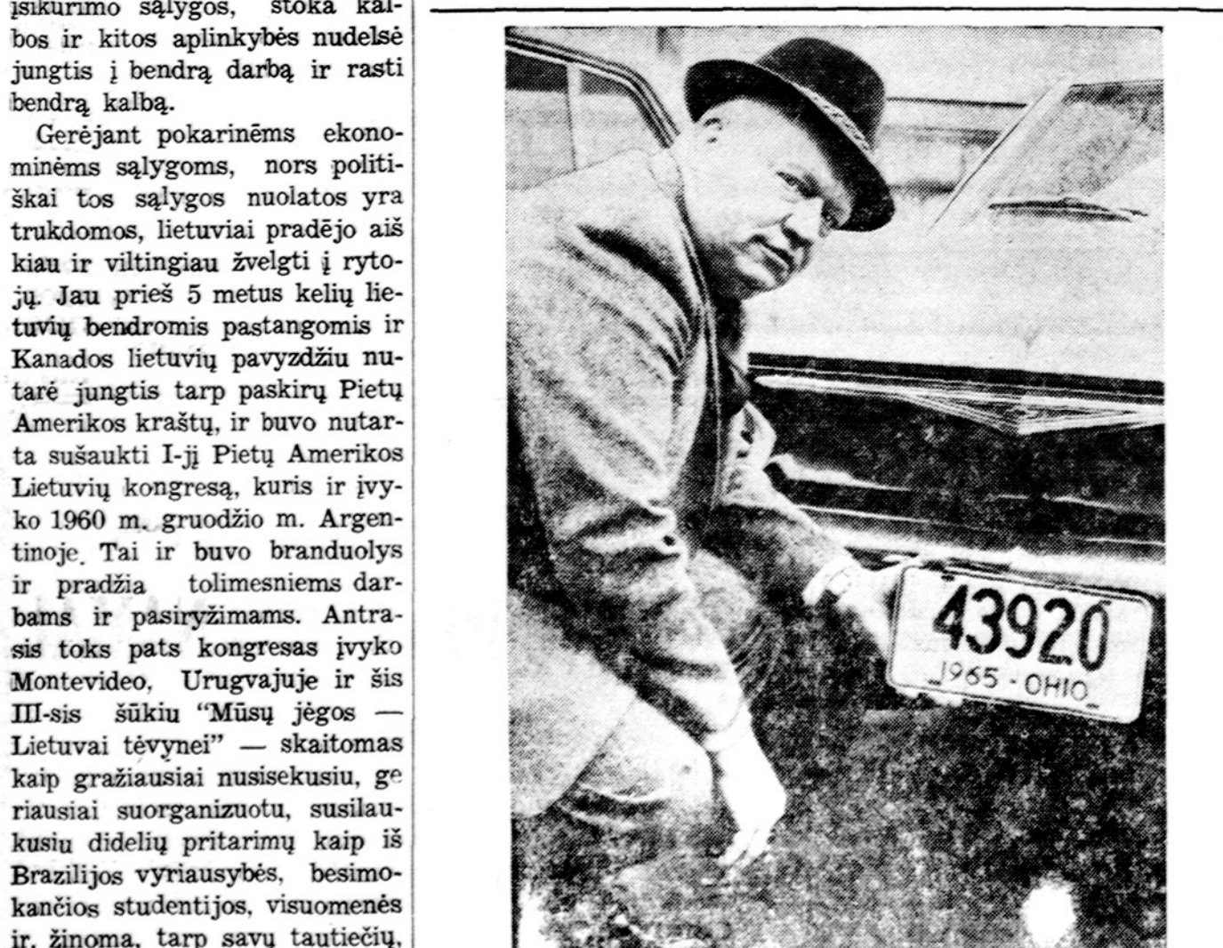
East Liverpool, Ohio, mieste pašto viršininkas ant savo mašinos turi taip vadinama "ZIP code" — pašto zonos numerį.