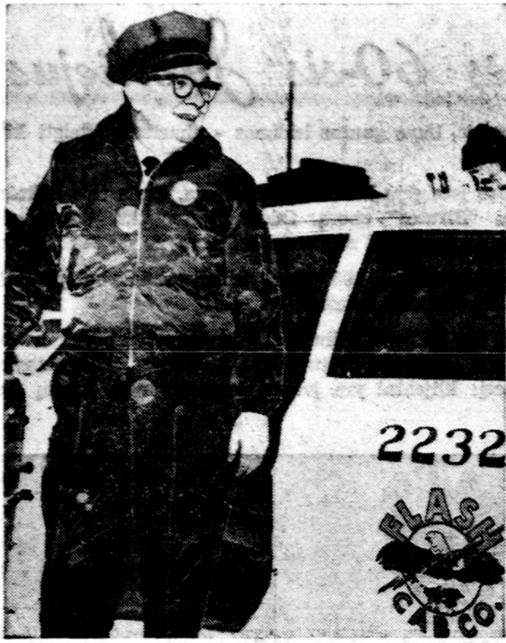
William Marland, buvęs West Virginia valstybės gubernatorius, taip nusišvyveno, kad šiuo metu vairuoja taksį automatinę Chicagoje, uždirbamas per savaitę 70-90 dol. Jis buvo tapęs alkoholiuku.