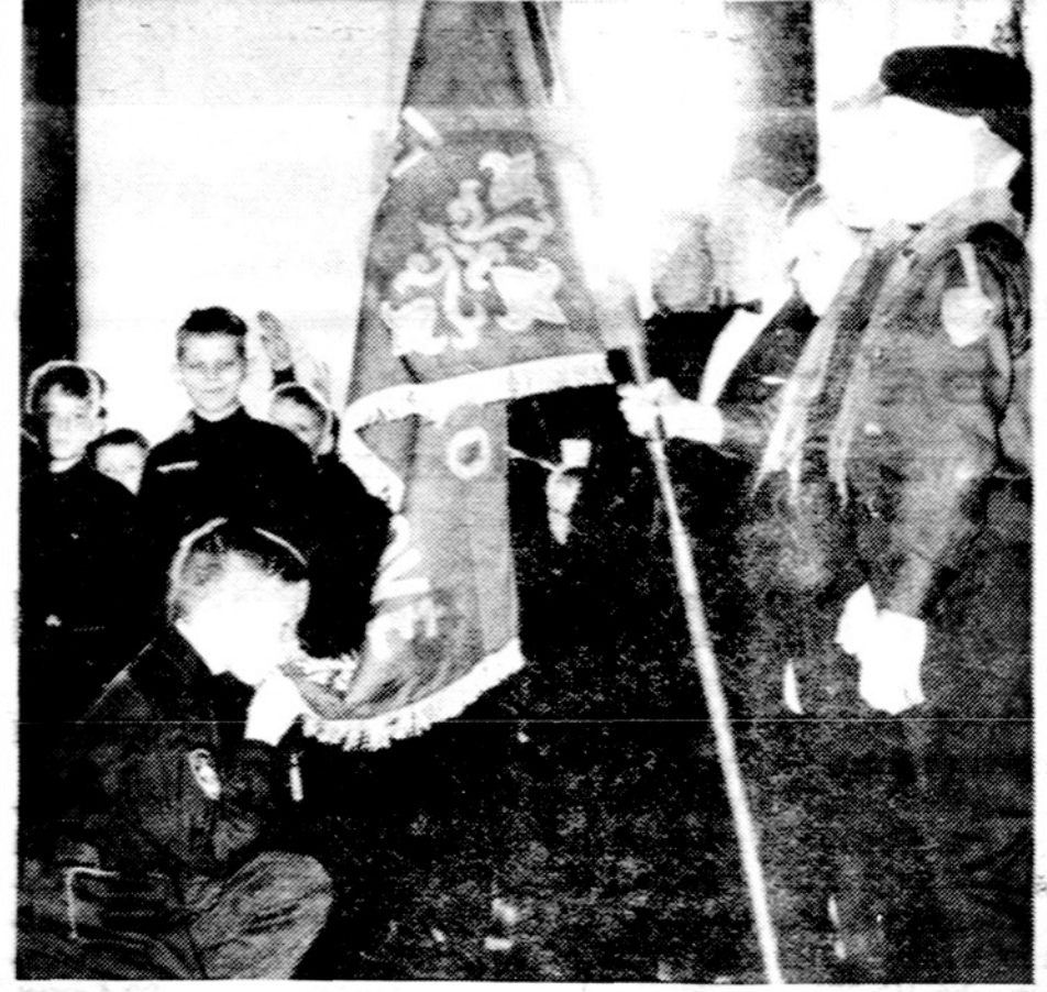
Vilkiukas duoda įžodį šv. Kazimiero šventėje New Yorke.

"DRAUGAS" 4545 West 63rd Street, CHICAGO 29, ILLINOIS Platintojams duodama nuolaida.