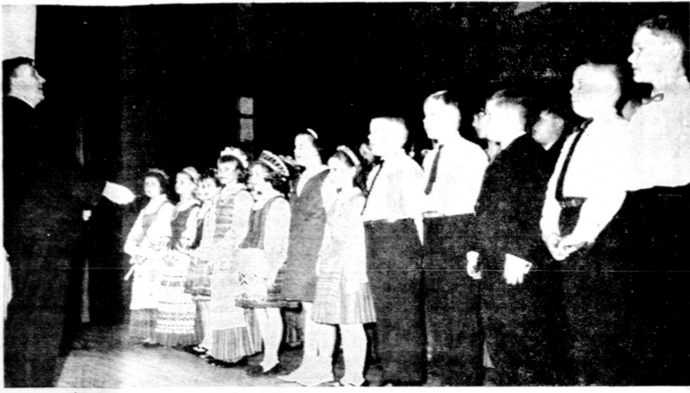
Cicero Lituaninės mokyklos choras, mok. Kreivėno vadovaujamas, atliko koncertinę dalį padainuodamas keletą dainų dailiojo žodžio varžybose. Jau nimo centre balandžio 4 d.