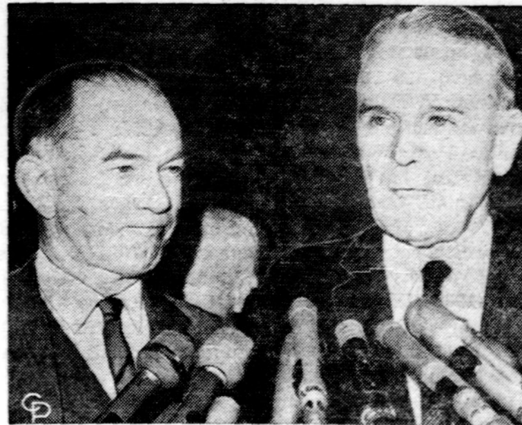
JAV-ųjų ambasadorius Pietų Vietname gen. Maxwell Taylor (dešinėje), prieš išvykdamas iš Washingtono į Saigoną, stovi kartu su sen. J. W. Fulbrightu (D. Ark.). Tayloras pareiškė, kad dabar esą "labai mažai" galimybių raudonajai Kinijai ar Sovietų Rusijai įsijungti į Vietnamo karą. Jis jau atvyko į Saigoną, baigus pasitarimus Washingtono su prezidentu. Fulbrightas patenkintas prezidento Johnsono pasiūlymu pradėti Vietnamo taikos derybas be sąlygų.