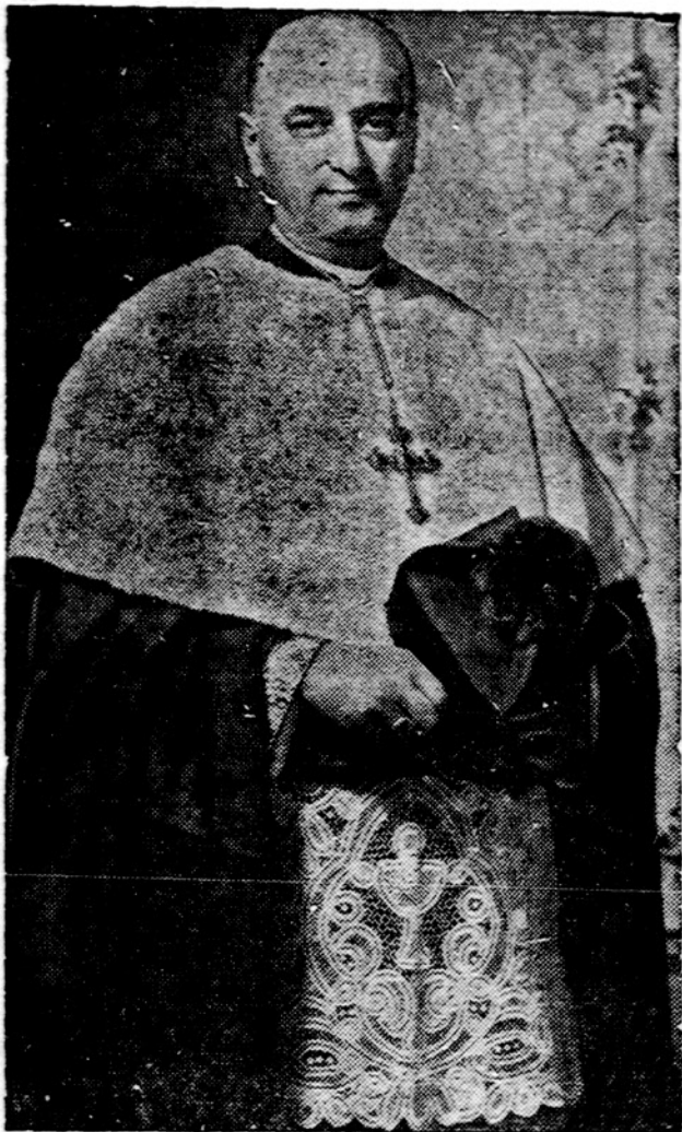
Kardinolas Albert Meyer, Chicagos arkivyskupas