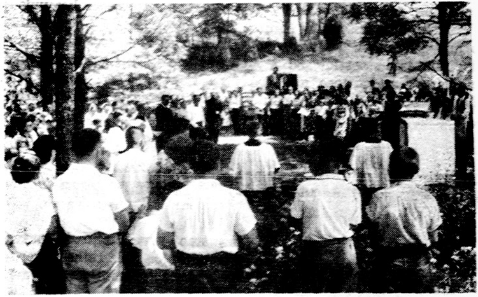
Dainavos stovykloje prieš dešimtį metų — stovyklos pašventinimo iškilmės.

3. Sekti spaudoje pranešimus ir informacijas apie kongresą. Federacijos valdyba mano, kad ir šis kongresas praeis su tokiu pat pasisekimu, kaip ir jau du buvusieji Chicagoje ir Nepaprastoji konferencija New Yorke.