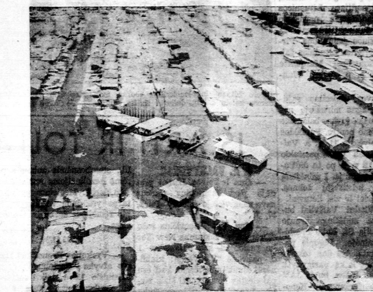
Vermillion upei patvinus, prie Hastings, Minn., turėjo būti išgabenta 282 šeimos.