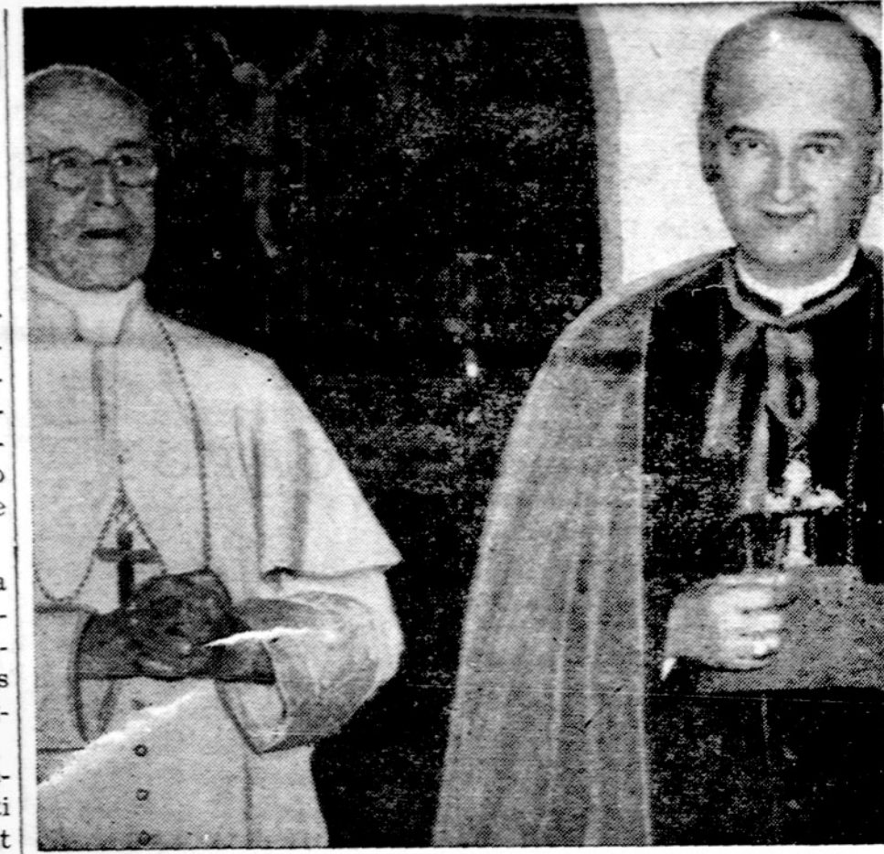
A. a. vakar miręs Chicago kard. Meyer (dešinėje) po paauskstinimo į kardinolus su šv. Tėvu Pijum XII-ju, 1959 m.

— Iš smulkesnių reikalų suminėta: a) š. m. balandžio 3 d. New Yorke pagerbiamas Vokietijos Bundestago narys baronas Karl Theodor von Guttenberg,