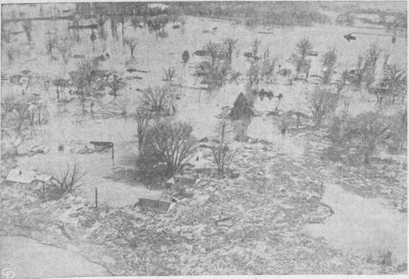
Tik stogai matyti Gulfport, Ill., vietovėje, kurią užliejo ištvinusį Mississippi upė.