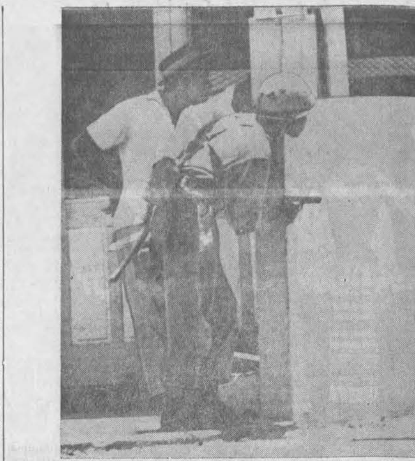
Dominikonų respublikos pilietis visai nesijaudindamas stebi, kaip amerikietis karys tikrina vieno namo koridorių, kur turėjo būti pasislėpęs komunistinis banditas.