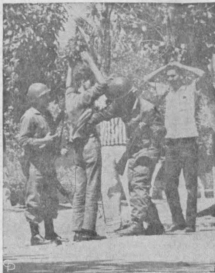
Amerikiečiai kariai apieško civilinius gyventojus netoli JAV ambasados Santa Domingo mieste, Dominikonų valstybės sostinėje.