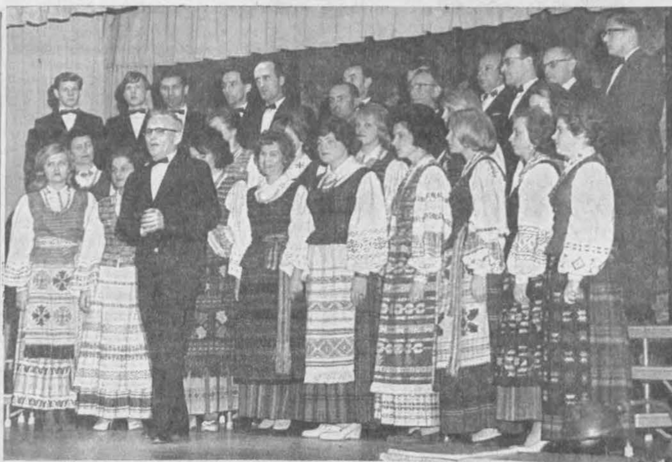
Philadelphia, Pa., lietuvių ansamblis, balandžio 25 d. įvykusiame Šv. Kazimiero seserų rėmėjų seime Newtown, Pa. Dirigavo muz. L. Kaulinis.