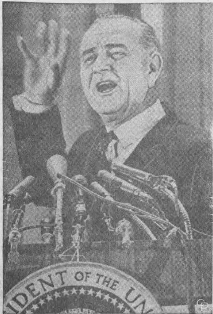
Prezidentas Johnsonas, kalbėjęs AFL-CIO amatų departamento konferencijoje Washingtone, pareiškė, kad JAV-ų kariniai daliniai bus išvesti iš Dominikonų Respublikos, kai tik Amerikos Valstybių organizacija (OAS) ten atneš taiką ir pastovumą.

SANTO DOMINGO, Dominikonų Respublika. — Karingi sukilėliai vakar perspėjo Jungtinių Amerikos Valstybių karinius dalinius, apkaltdindami juos paliaubų zonos pažeidimu. Penk tadienį buvo paskelbtos karinės paliaubos Dominikonų Respublikoje. Dabar sukilėliai teigia, kad amerikiečiai kariai esą sulaužę paliaubas, pasistumdami gilyn į sukilėlių teritoriją. Pulk. Francisco Caamano Deno, sukilėlių paskelbtas laikinuoju prezidentu, pareiškė, jog gali būti pradėtos "skerdynės", jei nebus greitai pataisyta situacija.