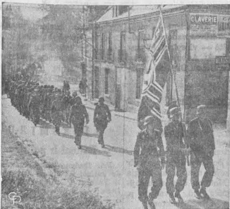
Kapituliavus Vokietijai 1945 m. gegužės mėnesio 9 d. 20.000 vokiečių karių varo į belaisvių stovyklą 25 amerikiečiai kariai. Vokiečiai ligi stovyklos vartų nešė ir savo vėlavą.