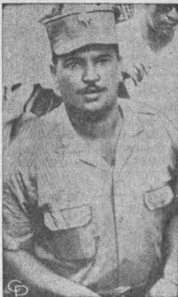
Francisco Caamano, Dominikonų Respublikos sukilėlių laikinasis "prezidentas". Nors Caamano sakosi nesąs komunistas, bet jis artėja prie jų.

valdžia ragina JAV-bes išvesti savo karinius dalinius iš Dominikonų Respublikos. Prezidentas Charles de Gaulle norįs pripažinti šios respublikos sukilėlių "vyriausybę".