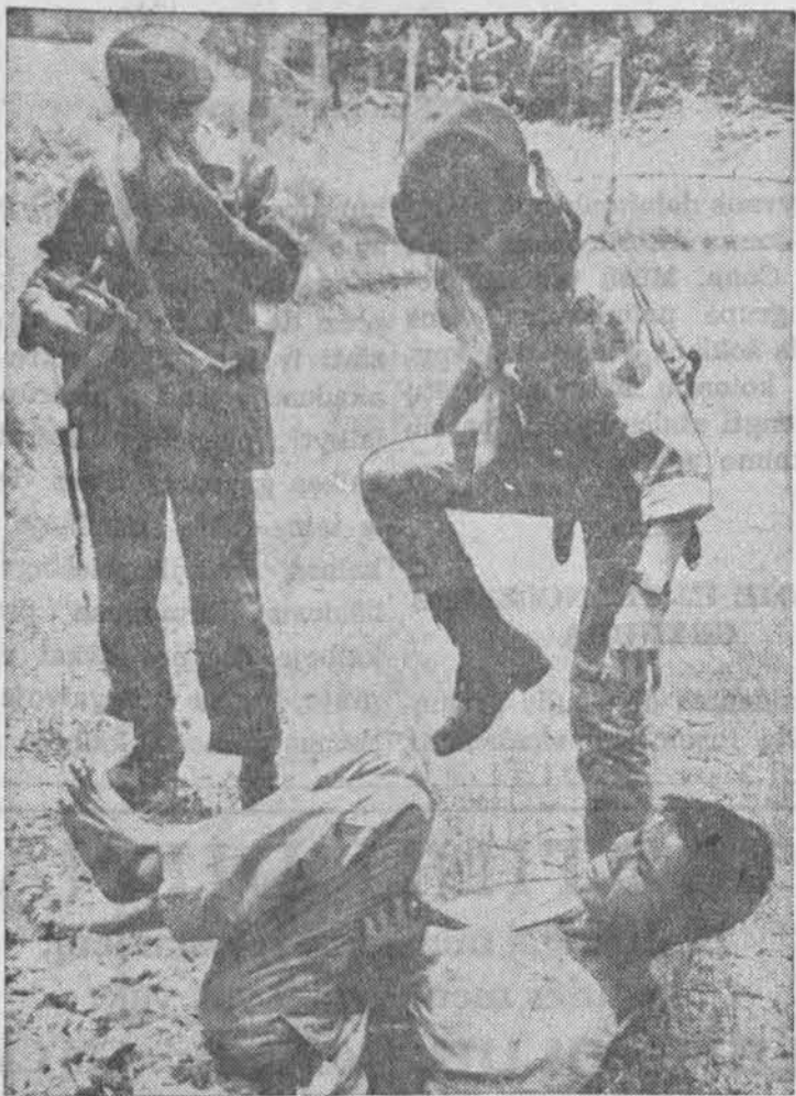
Pietų Vietnamo kariai kartu su amerikiečiais valė mišką nuo komunistinių banditų prie Da Nang oro bazės.