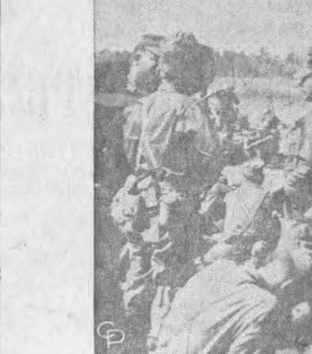
Amerikiečiai II-os divizijos jūrų pėstininkai prieš išskridami į Dominikonų respubliką iš Camp Lejeune, N.C. Kariai buvo helikopteriu perkelti į lėktuvnešį Okinawa.