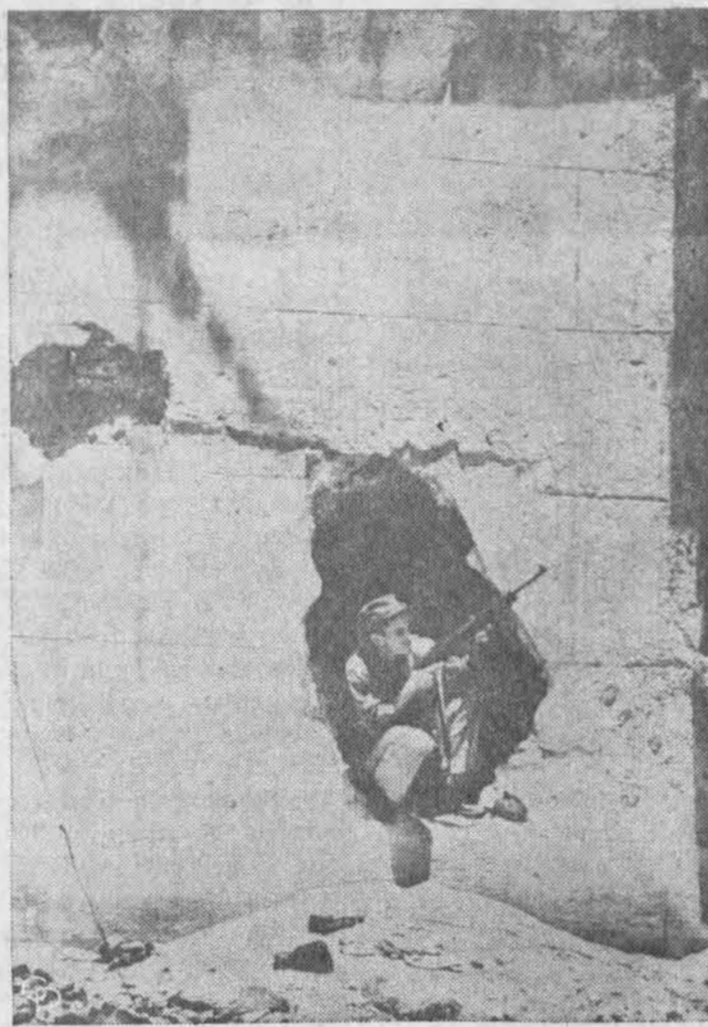
Komunistinis sukilėlis Santo Domingo mieste sėdi bazukos išmuštoj skyklėj Ozama tvirtovės sienoje.