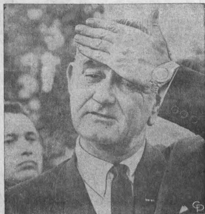
Prezidentas Johnsonas visiškai įsitikinęs, kad jo politika Vietname ir Dominikonų Respublikoje yra teisinga.

— Amerikos katalikai 1964 m. neturtingųjų šalpai išleido 13 mil. dol.