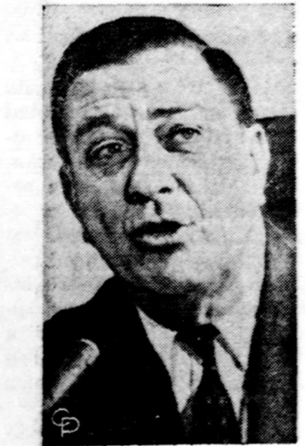
Franklin Roosevelt, buvęs komercijos pasekretorius, paskirtas Lygių teisių komisijos pirmininku. Komisija rūpinsis, kad sandant tarnautojus nebūtų diskriminacijos.