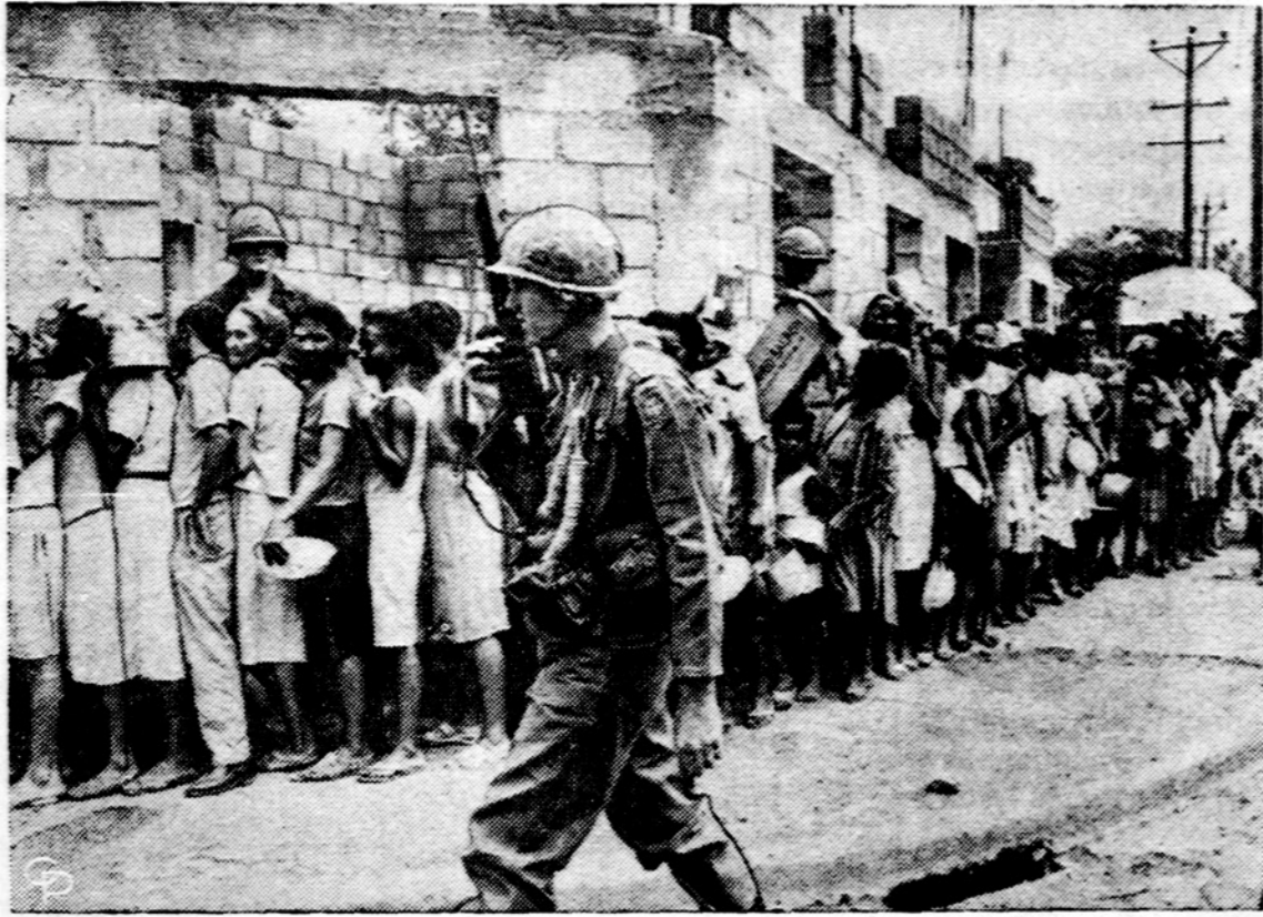
Amerikiečiai dalina maistą Santo Domingo mieste. — JAV-ųjų kareiviai stovi sargyboje, kai domininkonai rikiuojasi gauti maisto. Maistą dalina JAV-ųjų kariai Santo Domingo mieste, Domininkonų Respublikoje.