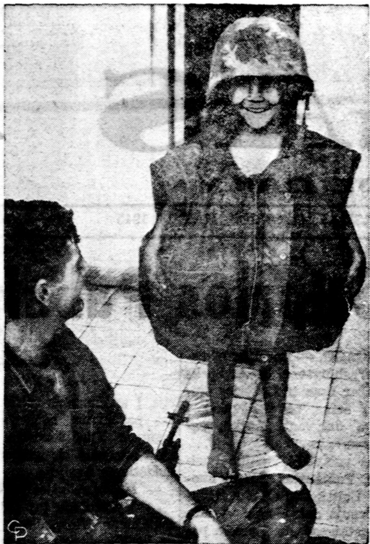
Dominikonų valstybės mažametis džiaugiasi užsilvėjęs JAV kario nepersaunamą liemenę ir užsidėjęs šalną.