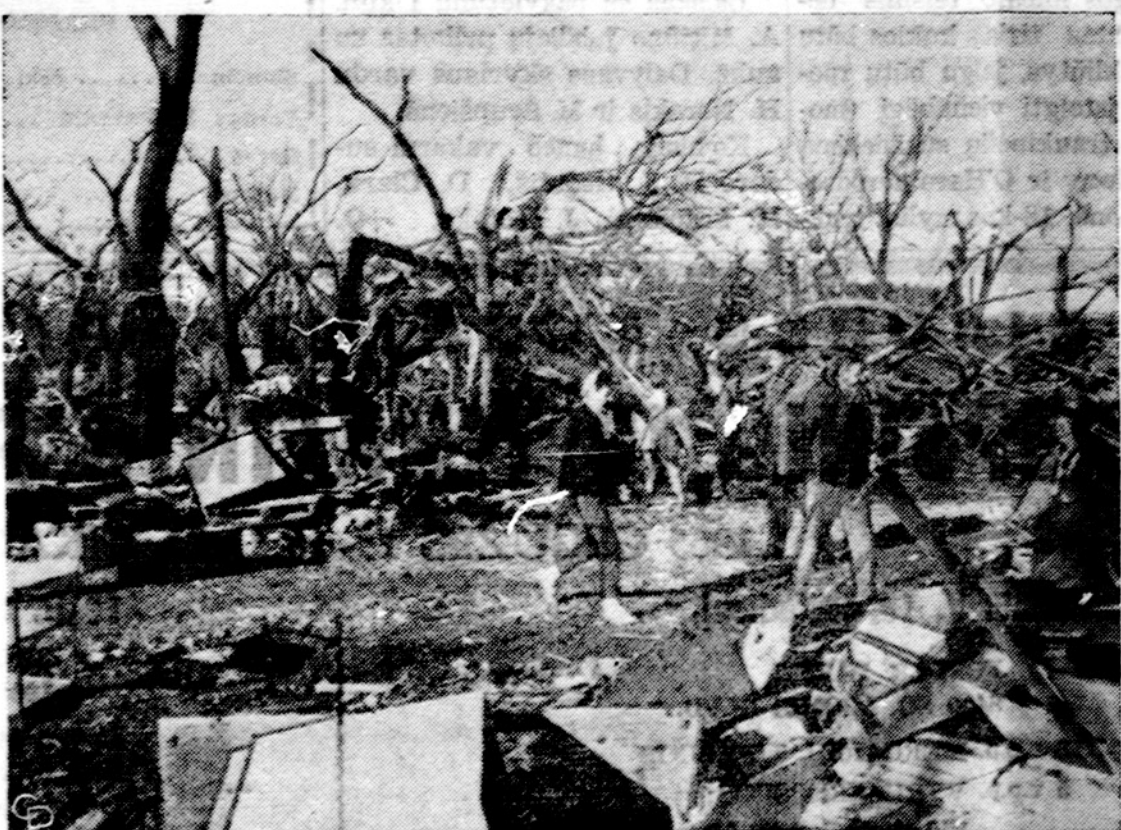
Viesulas nusiaubė Primrose, Neb., miestą, padarydamas daug nuostolių. Žuvo 4 žmonės.

Čekoslovakijos komunistinė vyriausybė pranešė Pragos apštališkajam administratoriui vysk. Frantisek Tomasek, jog santykių stabilizavimui ji norinti užvesti kalbas su Vatikano atstovais.