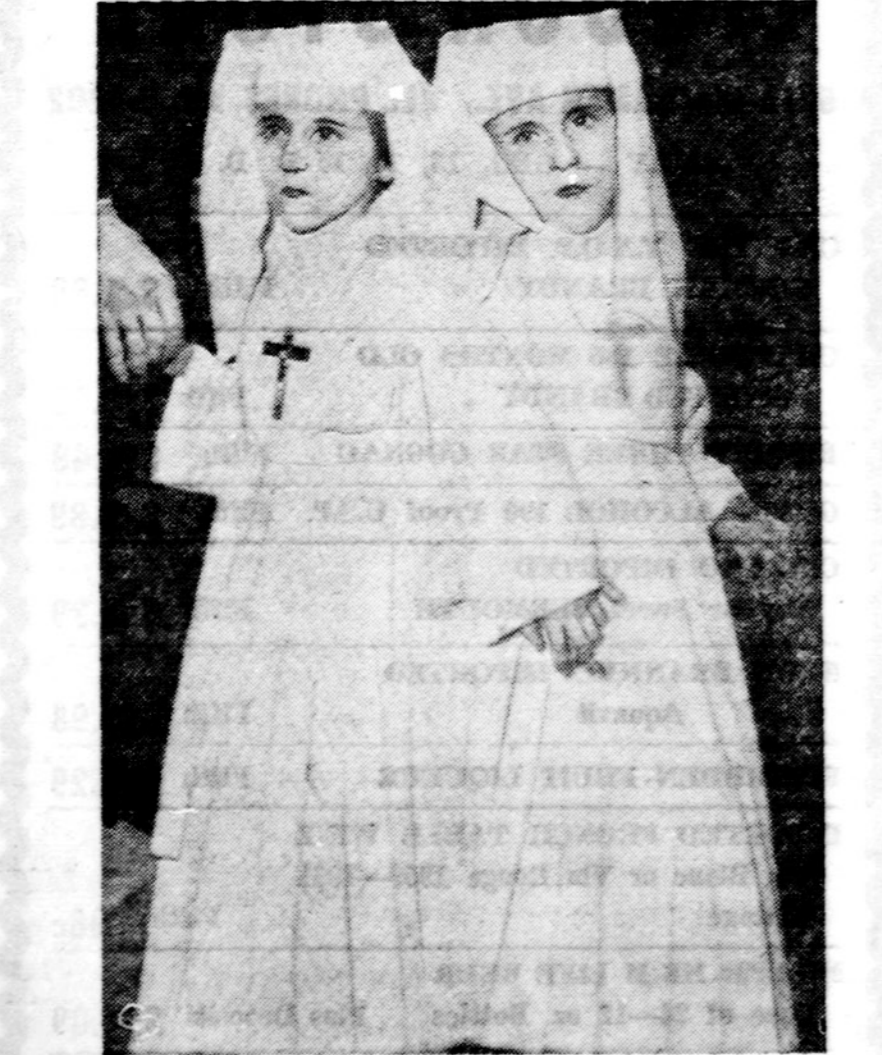
Sešių metų Siamo dvynukės Turine, Italijoje, operacijos keliu perkirtos. Operaciją darė 15 daktarų, kuri užtruko pusantros valandos. Čia mergaitės matyti kai jos ejo pirmos komunjijos gegužės 4 d.

Aleksandra Eivienė "Democrat" leidžiamas Ha vanoj, Ill., geg. 10 d., rašo, kad Anglijoj social. draudimui per metus išleidžiama 200 mil. svarų sterlingų. Prancūzijoje social. draudimui išleidžiama dvigubai daugiau. Laikraštis klausia kodėl? Ir toliau pats atsako, kad esą todėl, jog daugelis žmonių pripažįsta, kad tai "geras dalykas" nes aprūpinąs kiekvieną apraustaįjį ligonine, nors to nereikėtų. Tik esą Eldercare programa JAV-se apriboja išmokėjimus ir ji ligonine aprūpinanti tik tuos, kuriems gydytis reikalinga. Mums atrodo, kad tai balsas suinteresuotų asmenų bei privačių apraudojusių įstaigų, bet ne dirbančiųjų žmonių, kurie kaip tik prašo Medicare programos, kurią dar reikėtų praplėsti, bet ne siaurinti.