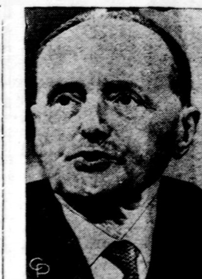
Italas Manlio Brosio, Šiaurės Atlanto sąjungos (Nato) generalinis sekretorius, ragina kitas Nato valstybes suprasti JAV-ųjų žygius Vietname ir Dominikonų Respublikoje.

Filipinai ir Pietų Korėja vakar pažadėjo atsiųsti savo karinių dalinių į Pietų Vietnamą pagalbėti kovoti prieš komunistus partizanus.