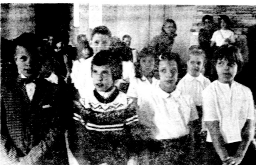
Dalis Detroito jaunučių at-kų pasirodymų duoti žodį.

Detroito Lituanistinė šešta-dieninė pradžios mokykla šiuos mokslo metus užbaigs birželio 6 d., sekmadienį, pamaldomis