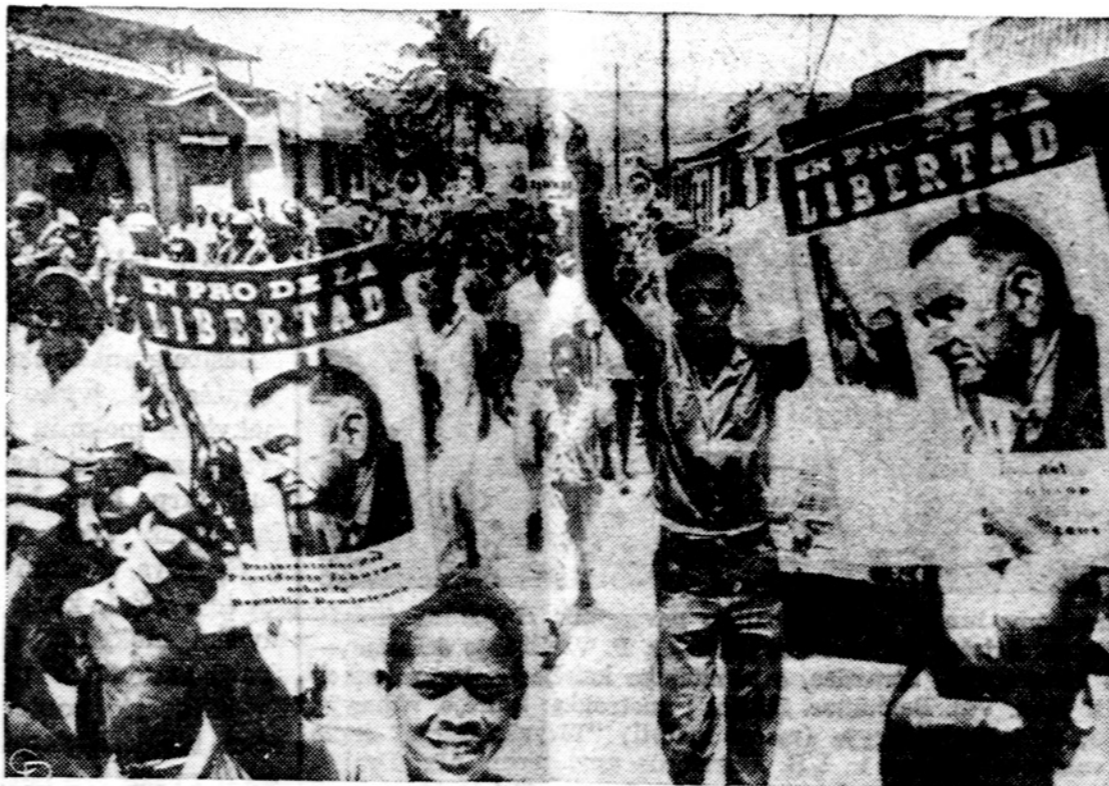
Santo Domingo jaunimas dalyvauja demonstracijose. Šaukdamas, kad prez. Johnson kovoja už Dominiko- nų ir visų kraštų laisvę. Jaunimas nuėjo prie JAV ambasados, kur buvo suruostas koncertas.

Teisingumas yra šventas žmonių giminis ryšys. — J. B. Bossuet