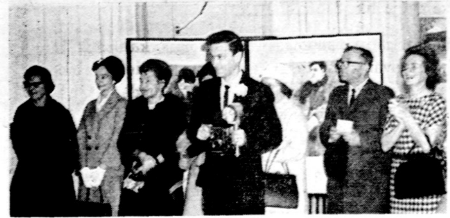
L. Stud. Detroito dailės parodos uždarymo metu. Žiūrovai su idomu laukia pasirodančių premijų laimėtojų. Paroda vyko Lietuvių namuose nuo balandžio 4—11 d.