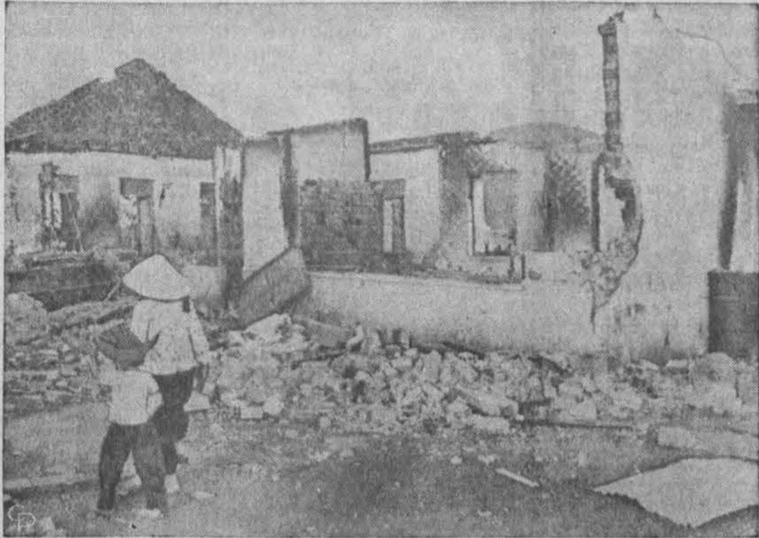
Du asmenys eina palei sugriautą pastatą, kur penki amerikiečiai kariai buvo užmušti Vietkongo partizanų komunistų Phuoc Binh kaime Pietų Vietname. Apie 2,000 partizanų komunistų puolė šį kaimą.