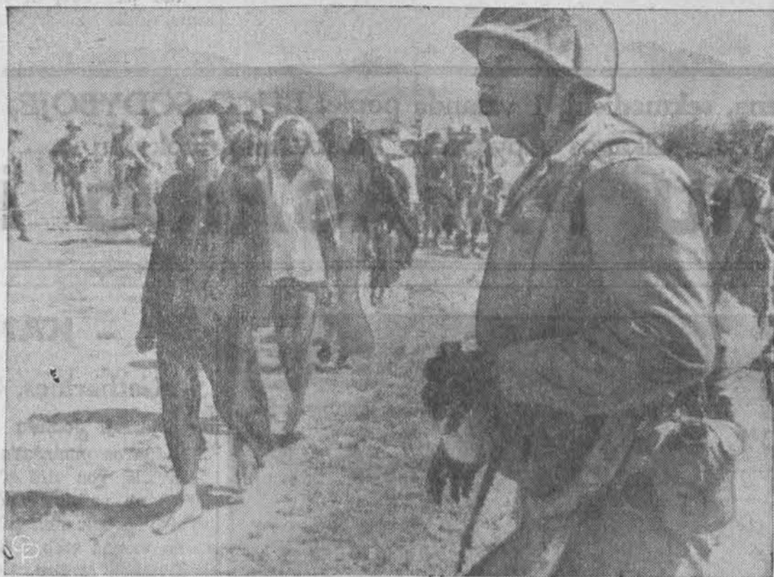
Le My vietovės gyventojai Vietname tikrinami marinių dalinių, nes komunistiniai agentai infiltruoti į gyventojų tarpą, nužudė vieną amerikietį ir penkis sužeidė.

Realiai matyti tikrovę nereikia ją pasitenkinti (visada yra kuo tikrovėje nepatenkinti!). Antra vertus, siekti idealo nereikia kreiptis nuo tikrovės. Priešingai,