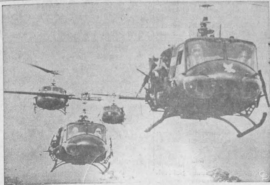
JAV armijos helikopteriai skrenda Vietname kovoj su komunistiniais banditais.

Atidara vakarais: pirmad., ketvirtad., penktad. — sekmadienį atidara 10 iki 5