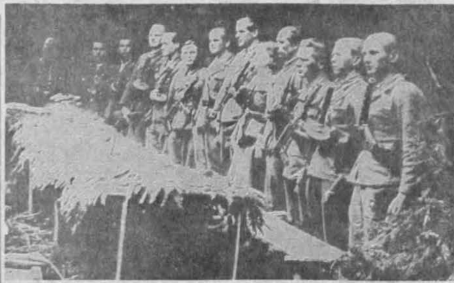
Ukrainiečiai partizanai kovoje prieš bolševikus po II-jo pasaulinio karo miške švenčia Velykas.

Vokietijos Lietuvių bendruomenė yra maža ir neturtinga, tačiau deda visas pastangas puoselėti lietuviškumą ir mūsų jaunimą auklėti krikščioniškoje - lietuviškoje dvasioje. Mes stengiamės išsikviči Vasario 16 Gimnaziją, tą gyvą Lietuvos laisvės simbolį, ir ją tobulinti. Ji yra tapusi visų pasaulio lietuvių vilties švyturiumi, kuris