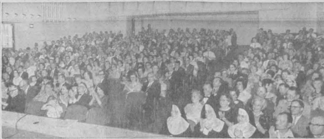
Svečiai klauso Ciurlionio ansamblio koncerto.