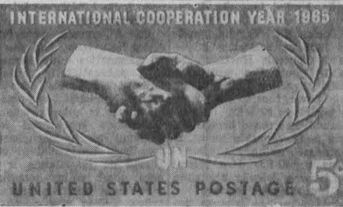
Minint 20 metų nuo Jungtinių Tautų įsteigimo bus išleistas toks 5 ct. pašto ženklas.

Svarstymai teima drąsos tautinės laisvės teiseje. Tėbūna jie atvirai, bet konkretūs ir logiški. Būtinai teišsko veiksmingų, naujų priemonių, bet gyvenimiškų ir panaudotinų. Tesibaigia jie nutarimais, bet pajuntamais, darban vedančiais.