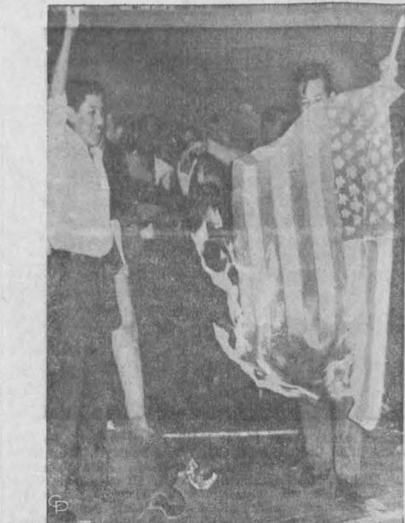
Meksikoj prokomunistinis jaunimas degina Amerikos vėliavą, protestuodamas, kam Amerika gina laisvąjį pasaulį nuo žiaurios komunistinės vergijos.

Atstovų Rūmų narys Edward Derwinski įkyrėjo komunistams įvykusiame Dubline, Airijoje, Tarparlamentarinės unijos susirinkime. Kalbėdamas apie rytinės Europos kraštus, jis juos pavadino "Rusijos satelitais". Komunistų bloko kalbėtojas protestavo, nes tuo žodžiu Derwinski užgėdas "laisvas ir demokratiškas" Bulgarijos, Rumunijos, Čekoslovakijos, Vengrijos ir Lenkijos šalis. Derwinski tada pavadino tuos kraštus mario netėmis. Tas irgi iššaukė protestą. Derwinski baigė savo kalbą akcentuodamas "satelitinius" kraštus.