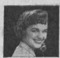
Vienas iš straipsnių, kurie padės tinkamai pasinaudoti telefonu.

Remkite tuos, kurie skelbiasi dienr. Draugė.