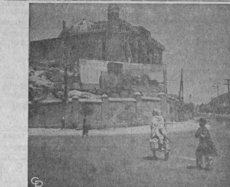
Uzbekistanas yra viena Sov. Sąjungos respublikų, kuri yra arčiausia raudonosios Kinijos Siankiang provincijos. Kaip žinome, Kinija ne kartą išsireiškė, kad ši sritis priklauso Kinijai. Nuotraukoj matyti Samarkando miestas, per kurį prieš šimtmečius perėjo Aleksandras Didysis ir Čingis Chanas.

"Literatūros ir meno veikėjai! Kovokite už kūrinių partiskumą ir liaudiškumą, didį idėjų kumą ir meninį meistriškumą! Ryškiau vaizduokite komunizmo