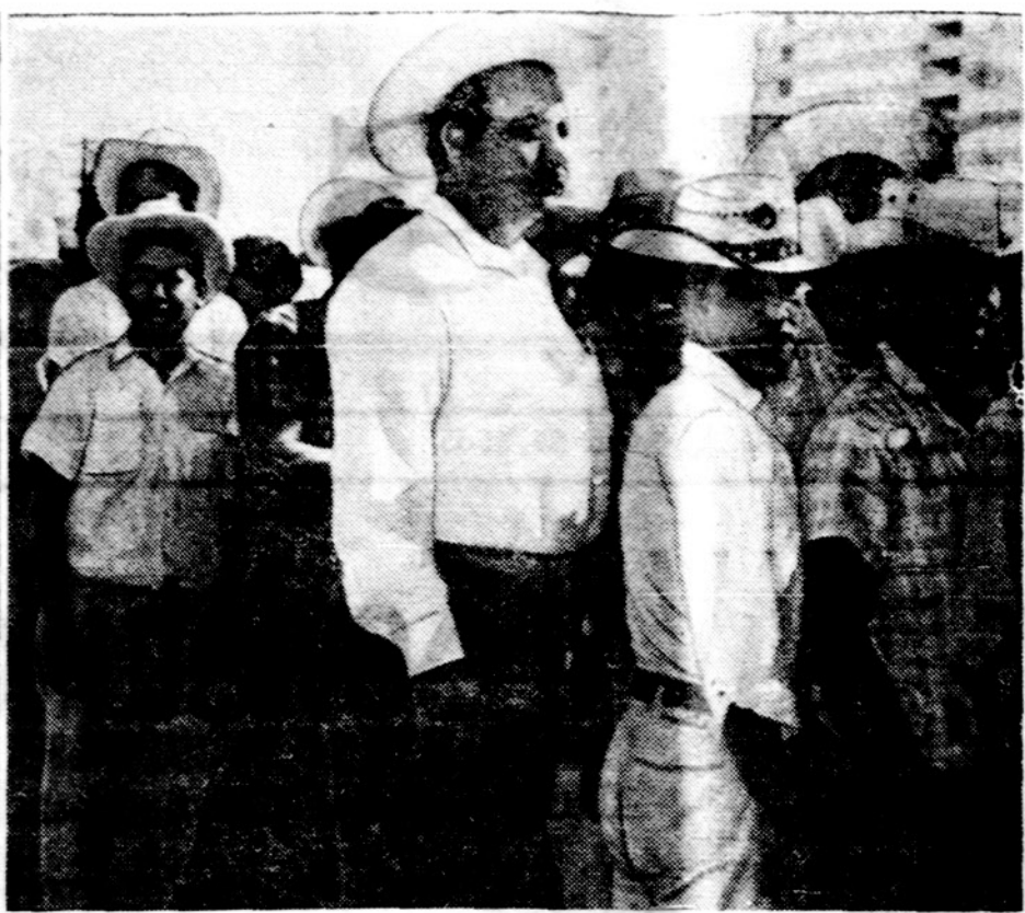
1.563 meksikiečiai, sutikus JAV darbo sekret. Wirtz, atvykę į El Centro, Calif. gauna pažymėjimus, iš kur vyks į žemųjų derliaus nuėmimo darbus. Šimet labai trūksta darbininkų ir žemųjų augintojai sakosi, kad jie nepajėgs nuimti viso derliaus.