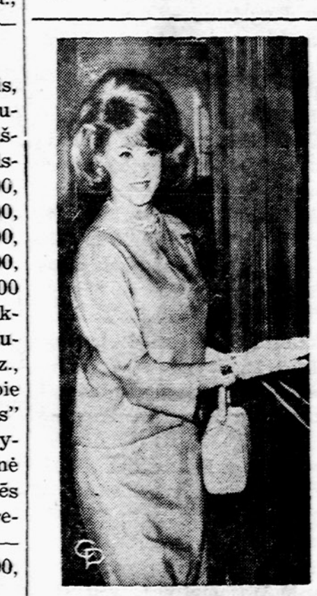
Dainininkė Phyllis McGuire liudija byloje prieš Chicago gendsterius. Ji mano, kad jos liudijimas nei jai, nei jos seserims taip pat dainininkėms, nepakenks.

— Phyllis McGuire liudija byloje prieš Chicago gendsterius. Ji mano, kad jos liudijimas nei jai, nei jos seserims taip pat dainininkėms, nepakenks.