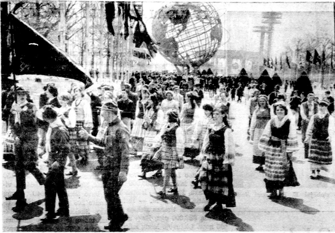
Lietuviai pasaulinės parodos atidengimo parade New Yorke.