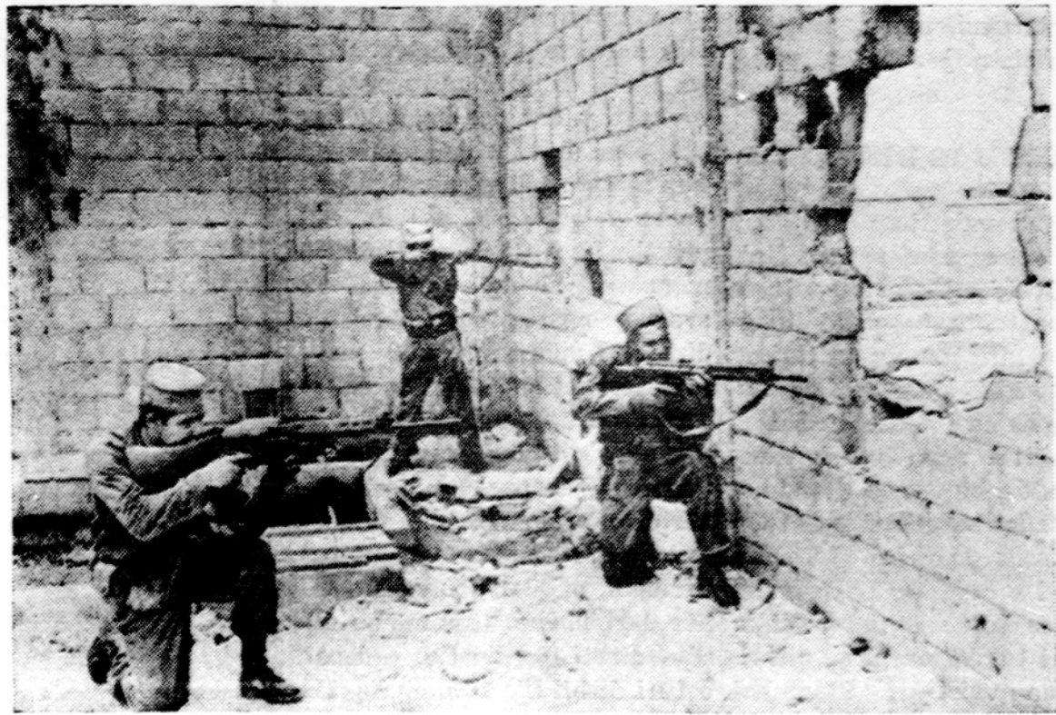
Vykstant diskusijom Jungtinėse Tautose ir Washingtono, lojalūs kareiviai kovoja prieš sukilėlius Santo Domingo mieste. Dominikonų Respublikos lojalūs kareiviai šaudė per išdraskytą sieną.

Oro biuras praneša: Chicagoje ir jos apylinkėse šiandien dalinai apsiniauks, šilčiau. Saulė teka 5:24, leidžiasi 8:11