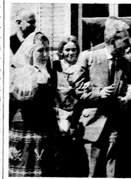
Vokietijos pabėgėlių ministerijų pareigūnai Vasario 16 d. gimnazijos mokinių tarpe.