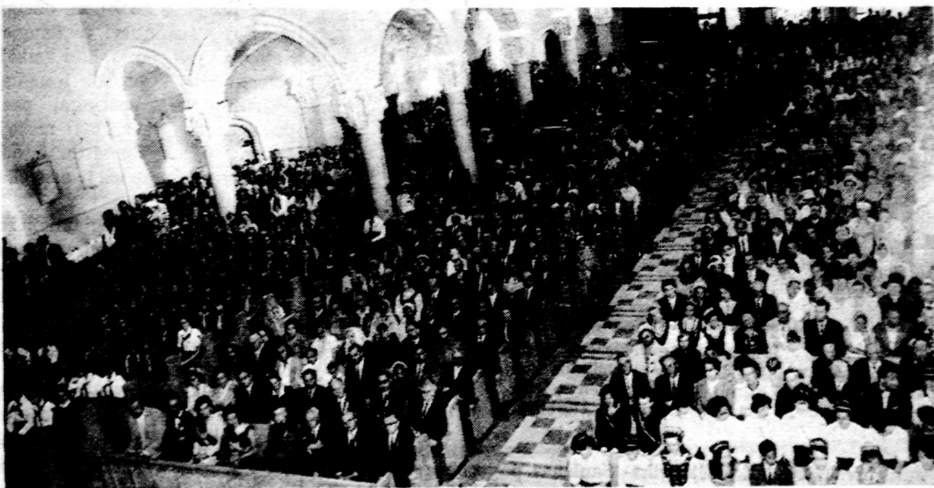
Gimimo švč. P. Marijos par. bažnyčioje pamaldų metu birž. 12 d. Chicagoje minint baisiojo birželio dienas.

Baigdamas savo kalbą Šv. Tėvas kvietė visus atnaujinti savo pasiryžimus likti ištikimais Kristaus mokslui. Ne tik eucharistinės paslapties atžvilgiu, bet ir viso mūsų tikėjimo plotmėje. Šio eucharistinio kongreso metu kiekvienas turi progą atnaujinti savo krikšto pasizadėjimus pikto atsakyme ir Kristaus sejmame nesitikima. Laiko dvasia ateitininkijos kelius jaukė ir duo bėjo, bet jų nesukraipė. Staičius, nelemti įvykiai ją žeidė, bet nenužudė. Išmestus perlus rankiojo, krovė, kaupė turta, kuris ne savam, egoistiniam naudojimui, bet visai tautai skirtas. Spaudimas, vergija ir nuoskaudos ugdo atsparumą, brandina. Ir štai, šis ateitininkų kongresas turi pademonstruoti lietuvių katalikiškosios inteligentijos sukaupą jėgą, jos tvirtumą (Nukelta į 4 psl.)