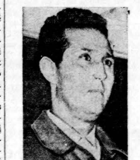
Nuverstasis Alžirijos prez. Ben Bella

Šiandien aišku, kad vienu pagrindinių festivalio tikslų bus sustiprinti komunistų įtaką Afri-