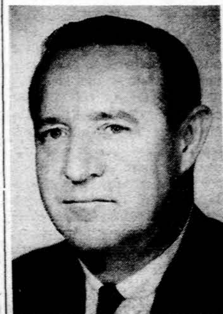
Kongresmanas John S. Monagan (D.-Conn.), poros rezoliucijų (H. Con. Res. 99 ir H. Con. Res. 416) Pabaltijo kraštų laisvinimo reikalui autorius, kurio antrą rezoliuciją priėmė Atstovų Rūmų užsienio reikalų komisija ir tą rezoliuciją Atstovų Rūmai šiomis dienomis priims.

Prisiminkime padėkos laiškučius Atstovų rūmų užsienio reikalų komisijos pirmininką kongresmaną Thomas E. Morgan ir kongresmaną John S. Monagan.