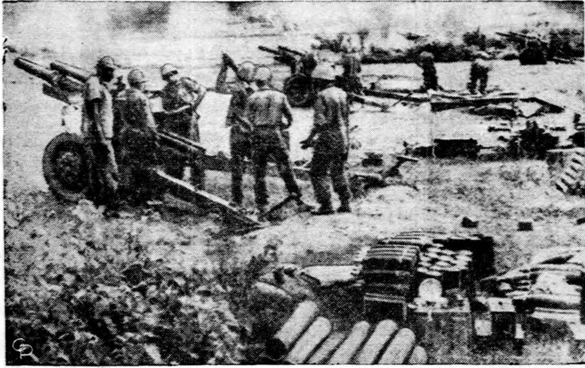
JAV artilerija bombarduoja komunistinių banditų pozicijas Pietų Vietname, netoli Saigono.