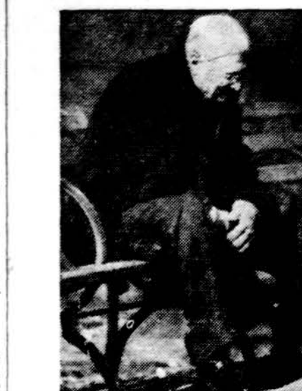
Buvęs JAV valstybininkas Baruchas, dešinėj kai šventė 90 m. sukaktį, o kairėje besilėje parke.

"Tiesos" bendradarbis New Yorke prisiminė ir vad. buržuazinius nacionalistus, kurie, girdi, "labai susirūpinę" ruošiamomis iškilėmis Lietuvoje. Esmė, "jū spaudoje pastebimas didelis neruotumas ir nesiliaujanti agitacija, kad šią vasarą niekas į Lietuvą nevyktų ir nesidalytų to istorinio laimėjimo džiaugsmu". Toliau pasakojama, kad iš desperacijos buvusi sugalvota kelionė lėktuvu į Vak. Europą, bet dėl "pažangiosios" spaudos balsų ekskursija likviduota, nes neleidžiama pamatyti savo gimtinę šalį. (E.)