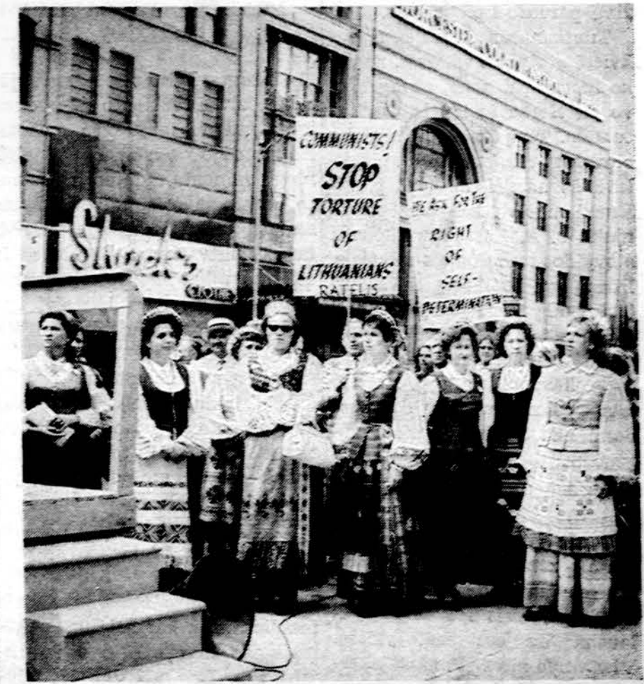
Worcesterio lietuviai demonstruoja, reikalaudami Pabaltijai apsisprendimo teisės.

Jugoslavijos diktatorius Tito lankėsi Minske.