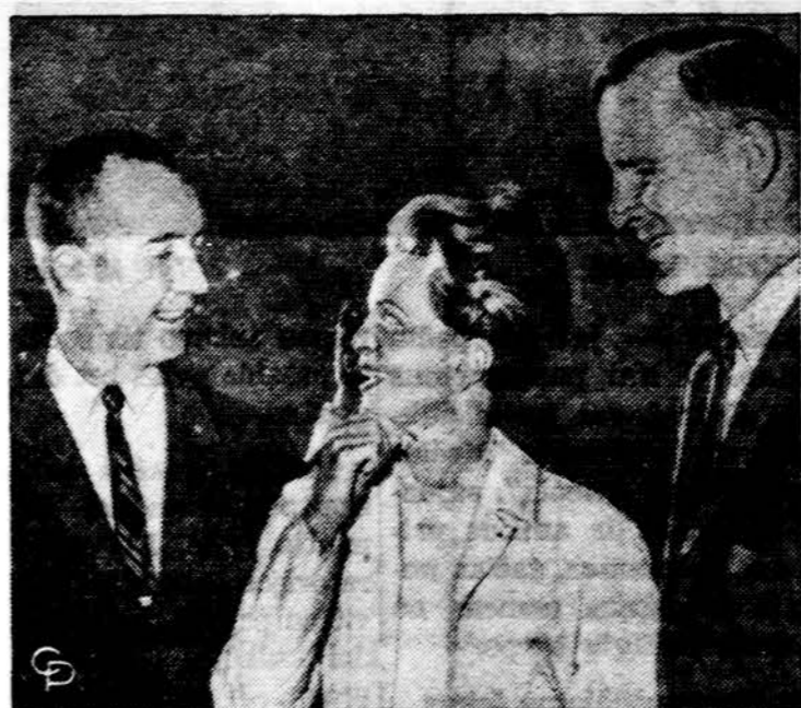
Amerikiečiai astronautai su prancūzė lakūne. Astronautai Jim McDivitt (kairėje) ir Ed White Paryžiuje su prancūzų aviatorė Jacqueline Auriol (buvusio Prancūzijos prezidento dukterimi) priėmimo metu JAV ambasadoje.

Toliau Izraelio politikas teigia, kad tautoms teiktina nepriklausomybė tik tuo atveju, kai tuo pačiu metu tautos patikinamos kultūrinės bei ūkio sąlygos. Kitu atveju nepriklausomybė netenka prasmės. Žinoma, kelias į tarptautinę taiką nėra lengvas ir jis negreitas. Tačiau dar niekuomet prieš atominį