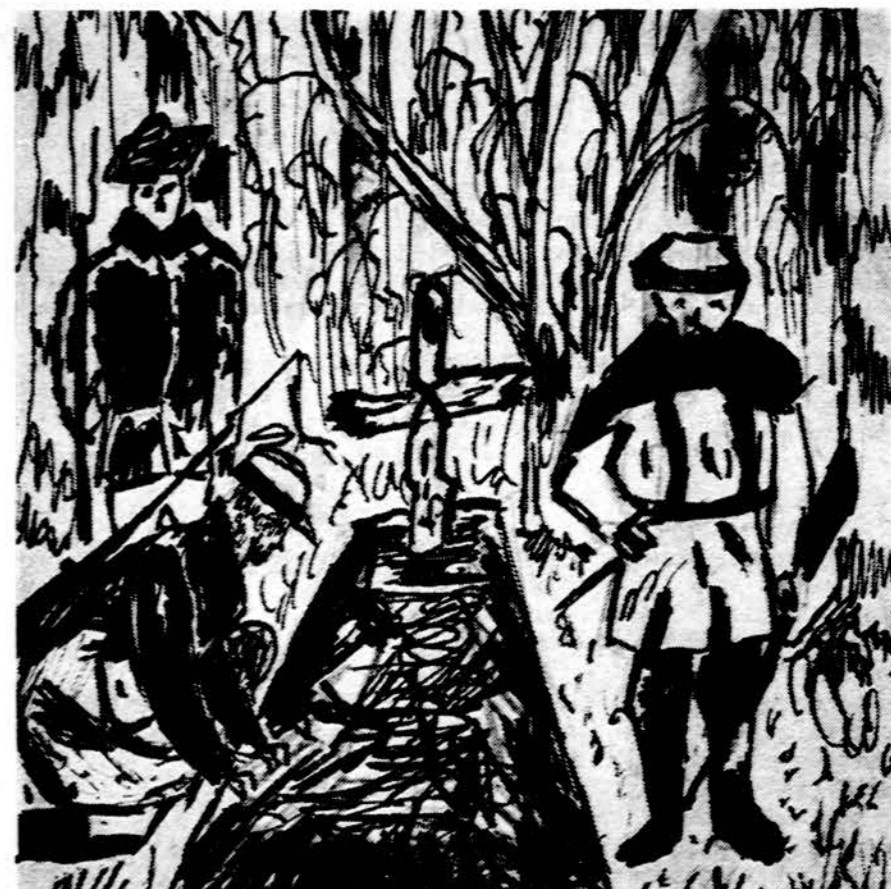
Partizano kapas. Piešė M. Trakis, VI sk. K. Donelaičio Lit. mok.

G. Sukelis, 6 kl. K. Donelaičio lit. mok.