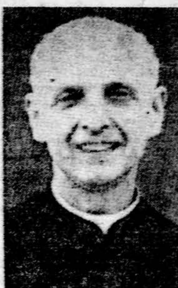
Kun. Pedro Arrupe, naujasis tėvų jėzuitų generolas