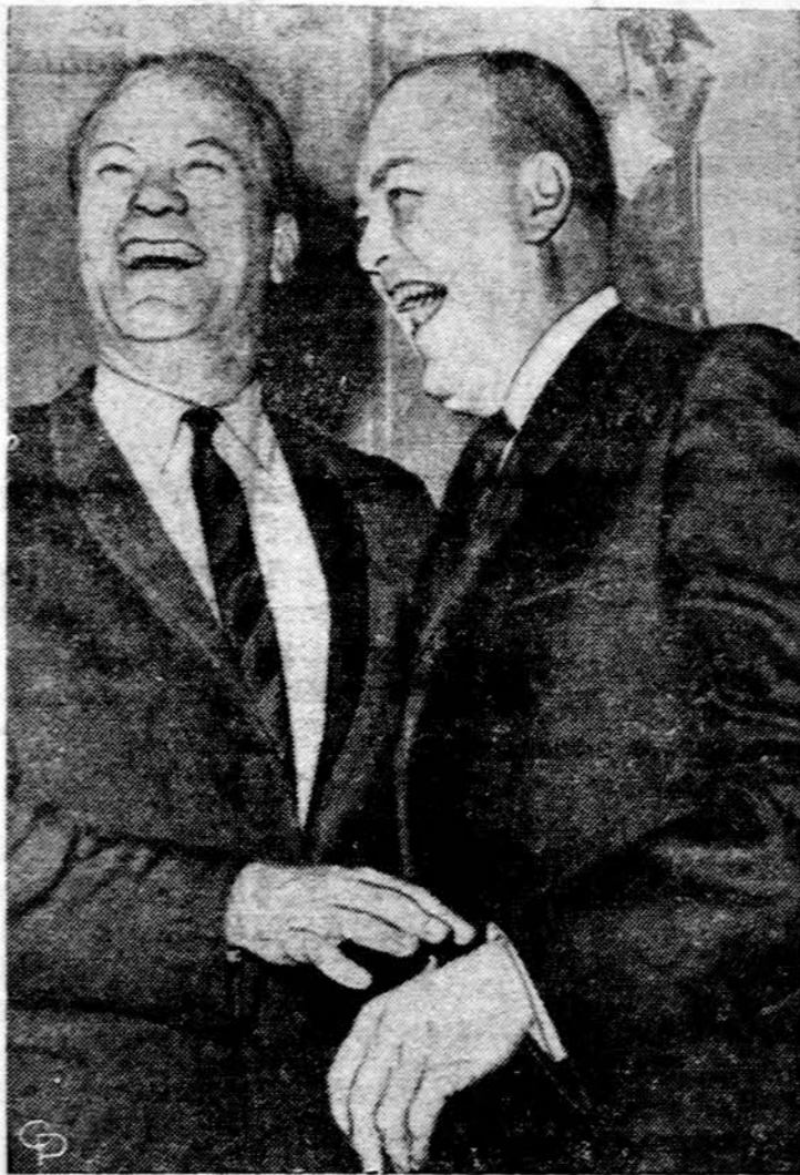
Gerald Ford ir Melvin Laird, kongreso respublikonų partijos vadai, juokiasi Washingtone, kaip spaudoje paskaitė žinią, jog jie tarp savęs kovoja dėl respublikonų partijos postų.

● JAV senatas patvirtino, kad dešimtukai ir dolerio ketvirčio monetos būtų kaldinamos be sidabro.