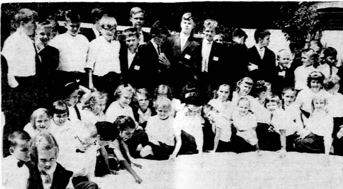
Jaunūčiai ir jaunesnieji moksleiviai kongreso dalyviai Toronte