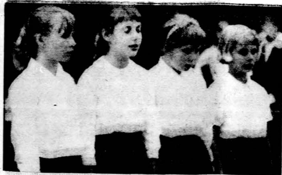
Hamiltono jaunesniųjų moksleivių kvartetas išpildo meninę programą.

Kat. veikimo centruose ir moters paruošimo mokyklose bei kursuose su atsidėjimu studijuojama moters asmenybė šių laikų pasaulyje, jos dorybės ir garbės reikšmė, teisės ir pareigos, šalies gerovė ryšium su moters įsijungimu į visuomeninį gyvenimą, kat. Bažnyčios ir mokslo santykiai su moterimi, pasaulietiška aplinka ir sunkumai bei pavojai šių laikų moteriai ar mergaitei. Iš tarptautinių temų daugiausia gvildinamos šios: tarptautiniai oficialūs organizmai moters asmenybei bei reikšmėi kelti, moters sąlygos ir asmenybė studijuojančių komisijų veikla ir t.t. Kaip matome, Ispanijos moterys, taip turtingos sielos ir kūno vertybėmis, siekia būti dar vertingesnėmis ir naudingesnėmis savam kraštui, pasauliui ir Dievui pagal mūsų laikų reikalavimus.