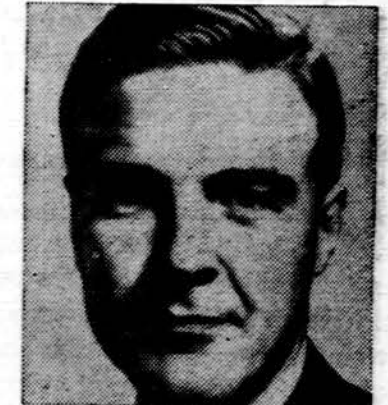
Henry Cabot Lodge

siog nekritikavo administracijos ir neminėjo Vietnamo, išskyrus bendras frazes. Bet Kennedžio žodžiai gavo aiškia prasmę, kai jis pasakė: