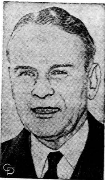
Gen. Maxwell Taylor

Oro biuras praneša: Chicagoje ir jos apylinkėse šiandien — apsiniaukę, aukščiausia oro temperatūra 70 laipsnių. Saulė teka 5:25, leidžias 8:27.