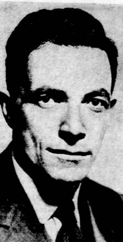
Senatorius Claiborne Pell (D., R.I.), Senato užsienio reikalų komisijos narys ir mūsų rezoliucijų žygio rėmėjas. Neseniai ragino savo kolegias senatorius praversti vieną rezoliuciją ir Senate Lietuvos bylos reikalui.

The House of Representatives has recently adopted the House Concurrent Resolution 416 that calls for freedom for Lithuania, Latvia, and Estonia. I kindly ask you and other members of the Senate Committee on Foreign Relations to