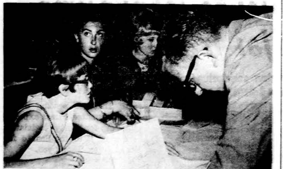
Prie kongreso registracijos stalo