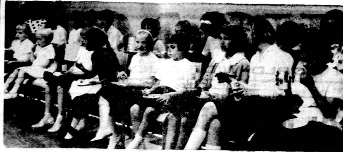
Jaunieji kongreso dalyviai užkandžiauja Lietuvių Vaikų Namuose Toronte

Šioje aplinkoje muris reikia daugiau pilkų darbininkų, o ne