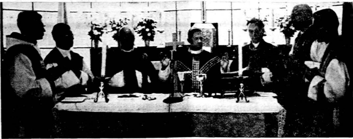
Už mirusius ateitininkus buvo atnašaujamos koncele bracijos būdu vysk. P. Brazio ir šešių kunigų šv. mišios