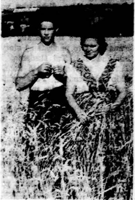
Motina su sūnum ties nokstančia duona Lietuvoje

Atsakymas. Pagydoma, jei priežastis tos ligos prašalinama. Taip esti su visomis kitomis ligomis. Storosios žarnos uždegimas gali būti dėl daugelio priežasčių: tuberkuliozės bacilų sukeltas, amebinės dizenterijos gyvūnų išsuktas ar paminint. Tamstos liga greičiausiai bus paskutiniosios priežasties sukelta. Nervinimasis irgi turi savas priežastis. Sutvarkius pastarąjį - lengvai, palyginti, susitvarko minėtos žarnos uždegimas.