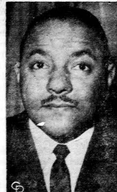
Carl T. Rowan pasitraukia iš JAV-ų informacijos įstaigos direktoriaus pareigų ir grįžta į privatų žurnalizmą.