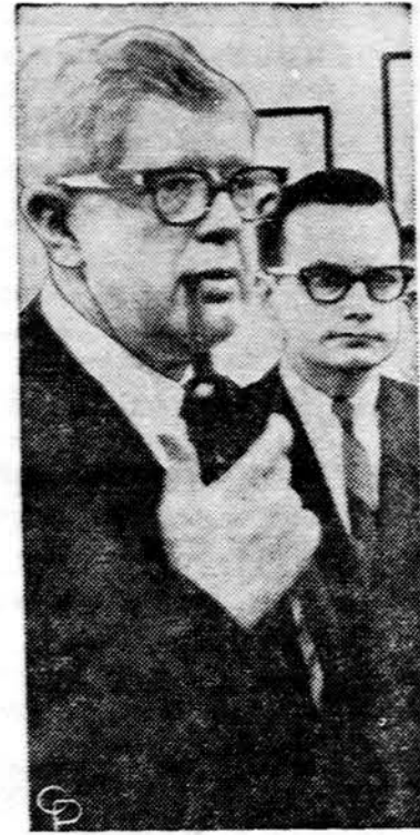
George Reedy (kairėje), Baltųjų Rūmų spaudos sekretorius, pasitraukė iš šių pareigų neribotam laikui dėl negalavimo. Jo vietoje paskirtas Bill Don Moyers (dešinėje).

JAV-ų gynybos departamentas vakar pranešė, kad jis dabar nešauks atsarginių karių karinėm tarnybon ryšium su karu Vietname.