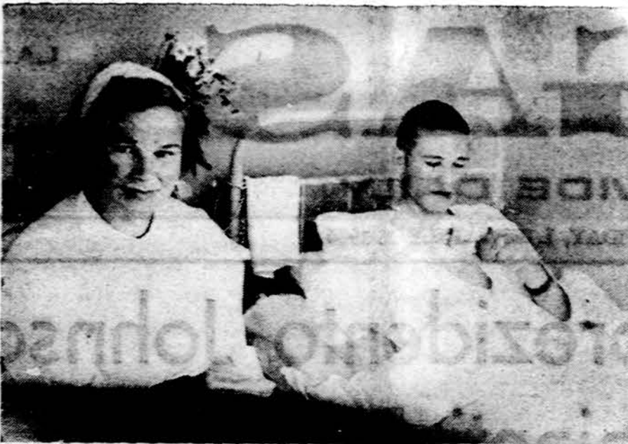
Motina prie sveikstančio sūnaus okupuotoje Lietuvoje.

Pvz. dar universiteto klinikoje, Lietuvoje dirbant, prisėjo tvarkyti vieną mašininką su krauju storosios žarnos uždegimu turėjusį. Jo girtuokliavimą sutvarkius, jo liga išnyko. Kitas atsitikimas, pvz., gali būti iš Chicago: net triskart ligoninėje gulėjusi, visokius ištyrimus turėjusi ir negyjanti ligonė nesitaisė, nuolat menkėjo. Ji pagijo namuose būdama, kai jos vyras, truputį stačiokas, pradėjo švelniau su ligone apsieiti. Jis, mat, buvo iš Lietuvos kaimo, o ji iš Vokietijos miesto - pripratusi prie namų židinio švelnius šeimos pokalbius girdėti. Dabar ji graži, kaip kokia artistė, ir visai sveikata. Vyrui nurodžius jo ydą - jis pasistengė, ir jo žmona ligą nugalėjo.