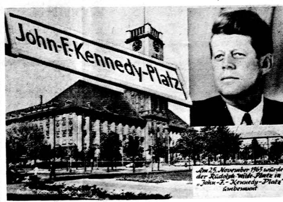
Berlyno aikštė, kurioje kadaise kalbėjo prez. J. Kennedy. Ši aikštė dabar pavadinta John F. Kennedžio vardu.