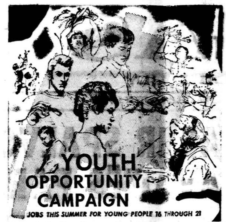
YOUTH OPPORTUNITY CAMPAIGN JOBS THIS SUMMER FOR YOUNG PEOPLE 16 THROUGH 21

Kl. Esu 69 m. amžiaus. Pradedau dirbti būdama 60 m., uždirbdama kas metai sekančius uždarbius. (Seka lentelė). Kiek gčiau pensijos, jei išėčiau į pensiją sukakus 70 m. amž. (sukakus 1966 m. sausio 6 d.)? Kiek gčiau, jei dar dirbčiau iki 71 ar 72 m. amžiaus, uždirbdama po $4,025 kas metai? Ar pensija vis didėtų? — R. S.