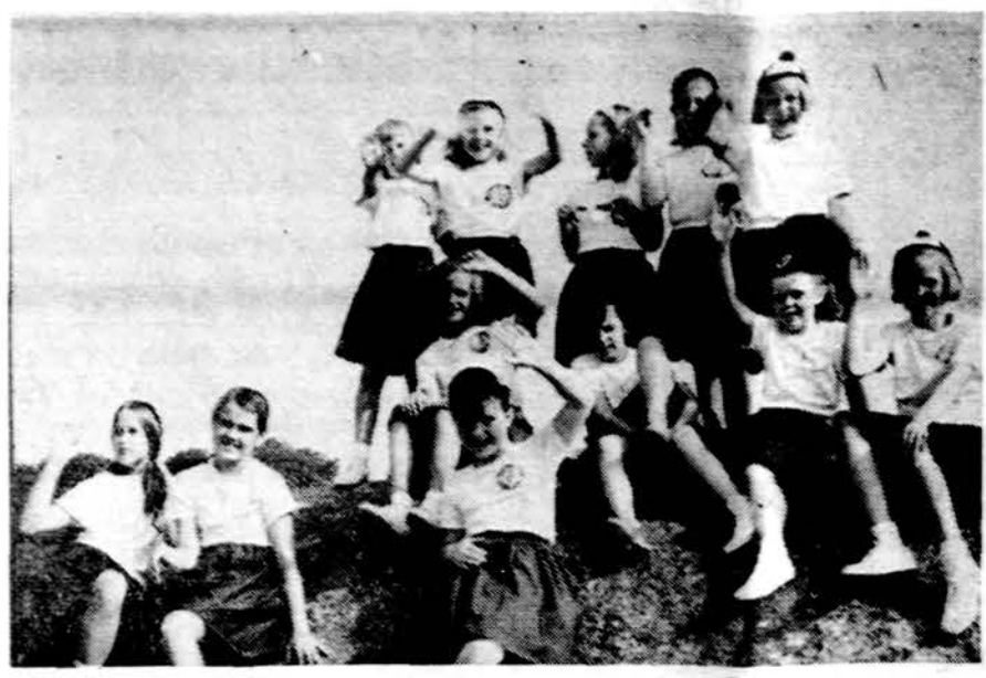
Mergaičių stovykloje Putname, Conn.