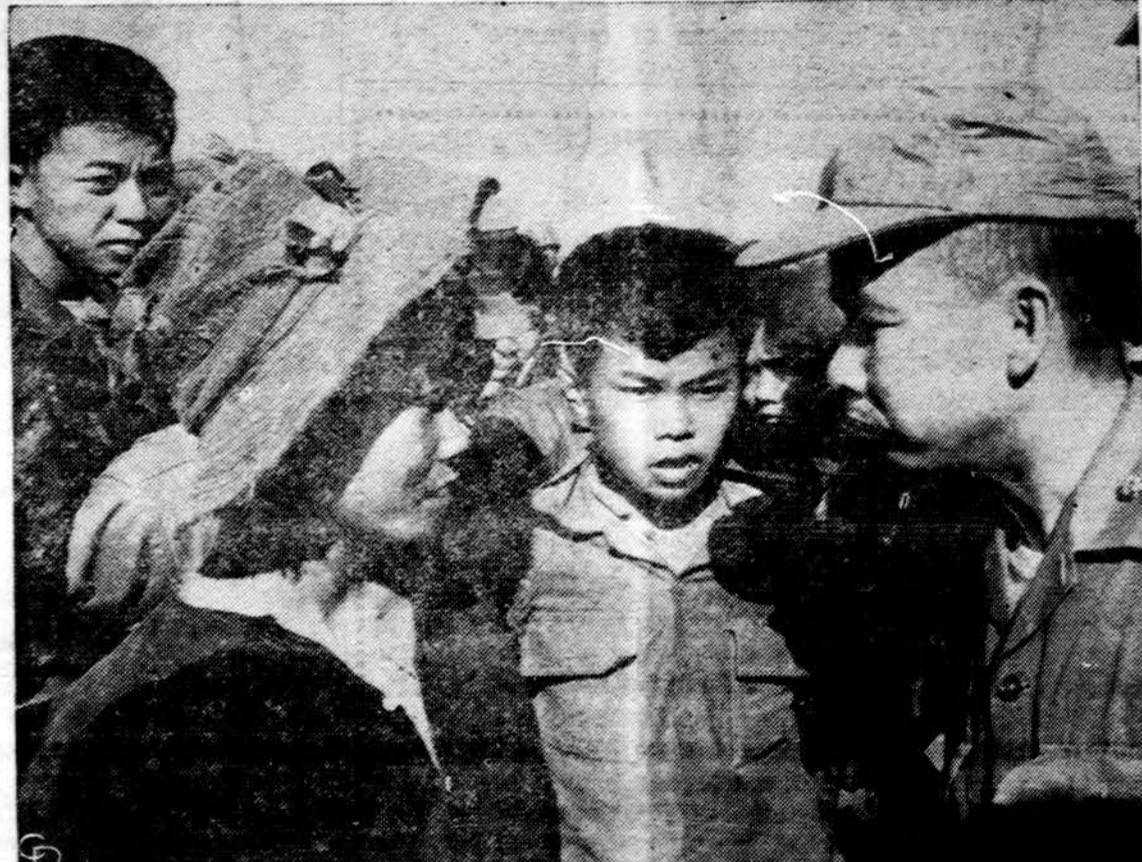
"Jaunamečiai" partizanai — Pietų Vietnamo saugumo policijos pareigūnas (dešinėje) apklaušinėja du jaunuolius partizanus.

Džiugu, kad gražiai ir įspūdingai pasirodė lietuviai.