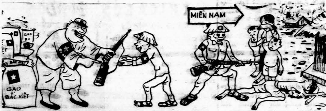
Tokius lapukus mėto amerikiečiai virš Šiaurės Vietnamo. Lapukuose vaizduojama, kad komunistinė Šiaurės Vietnamo vyriausybė atima iš gyventojų ryžius, juos atiduoda komunistinei Kinijai, kuri duoda ginklus, kad šiais Šiaurės Vietnamo komunistai galėtų žudyti nekaltus Vietnamo gyventojus.