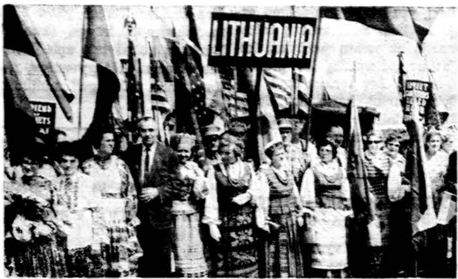
Pavergtųjų tautų savaitės eisenos dalyviai, pasirodę žygiu.