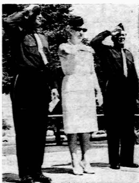
Darius ir Girėno posto atstovai gerbia žuvusius didvyrius liepos 18 d. Marquette Parke.

Kartą kunigas pamokslė paneigė rožinio kalbėjimą mišių metu. Jo klausė seni ir jauni. Tačiau, jei po pamokslų jis būtų kaip nors patikrinęs savo žo-