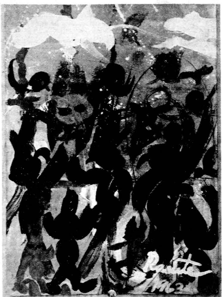
Rasutė Arbaite Blojų dvasių šokis (tempera)