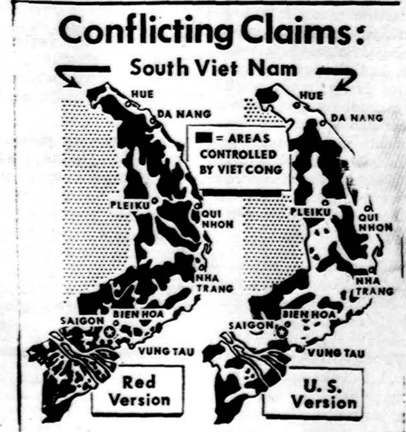
Prieštaraujantieji teigiami. — Kairėje pusėje yra žemėlapis, kurį paskelbė Vietkongo partizanai komunistai. Dešinėje yra žemėlapis amerikiečių darytas. Juodai pažymėtas vietovės valdo Vietkongo partizanai komunistai arba niekas, o baltai pažymėtas apylinkes valdo pietų vietnamiečių vyriausybės jėgos.