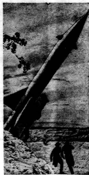
Tokios rūšies šiaurės vietnamiečių komunistinis režimas naudoja raketas prieš JAV-ių lėktuvus, atskridusius bombarduoti karinių įrengimų šiaurės Vietname.

Bombos buvo numestos į Chukurcha miestą, Hakkari provincijoje, pietryčių Anatolijoje, besiribojančioj su šiauriniu Iraku. Prieš tai vienas turkų kaimas buvo bombarduotas irakiečių armijos lėktuvų, puolant sukilėlius kurdus.