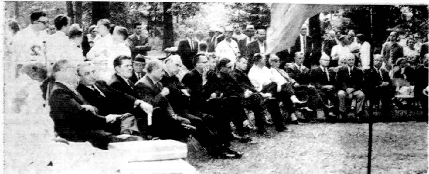
Wisconsin Lietuvių dienos garbės prezidentas ir dalis svečių šių metų liepos 18 d. Minkowskio ažuolyne, Kenoshoj, Wis.

TRECIADIENI visą dieną uždara. KETVIRTADIENI . . . 9:00 A.M. — 8:00 P.M. PENKTADIENI . . . 9:00 A.M. — 8:00 P.M. ŠEŠTADIENI . . . 9:00 A.M. — 12:30 P.M.