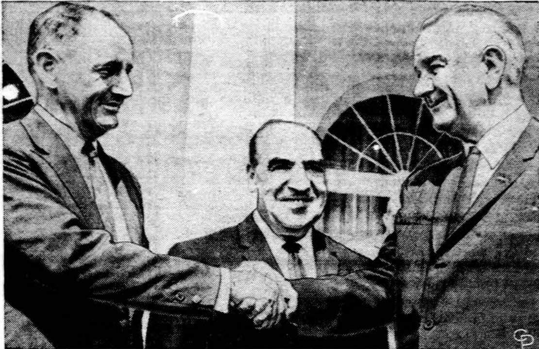
Respublikonas pakeičia demokratą. — prezidentas Johnsonas sveikina J. W. Gardnerį (kairėje), respublikoną. Washingtono po pranešimo, jog jis pakeičia dabartinį sveikatos, švietimo ir gerovės departamento sekretorių A. Celebrezė (viduryje). Celebrezė, buvęs Clevelando, Ohio, meras (demokratas) paskirtas JAV-ių apeliacinio teismo šeštoje apylinkėje teisėju, kurio būstinė yra Cincinnati, Ohio.