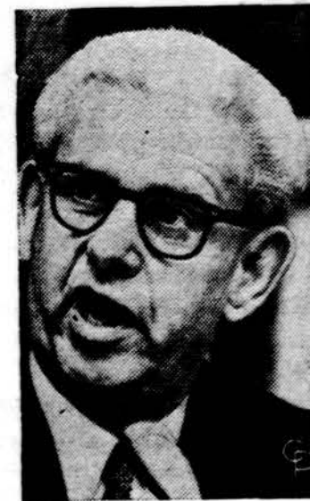
Arthur J. Goldberg pradėjo eiti JAV-ių ambasadoriaus Jungtinėse Tautose pareigas. "Jei mes nepadarysime tvarkos savo namuose, abejojau, ar mes galėsime įvesti tvarką kituose namuose". pasakė jis. Jungtinių Tautų organizaciją dabar vargina finansiniai ir konstituciniai negalavimai.

— JAV-ių ir pietų vietnamiečių lėktuvai vakar bombardavo karinius įrengimus šiaurės Vietname netoli raudonosios Kinijos pasienio