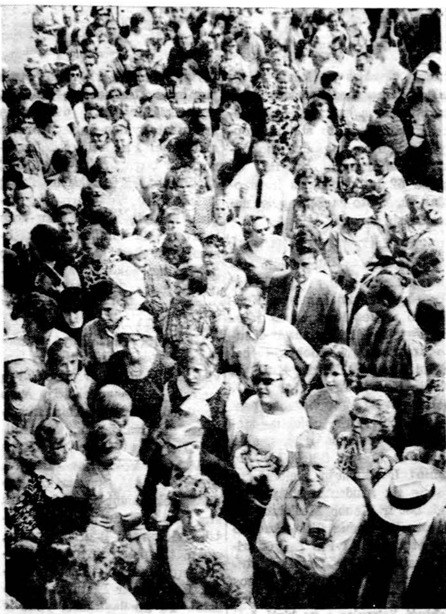
Lietuvių diena Putname, Conn.