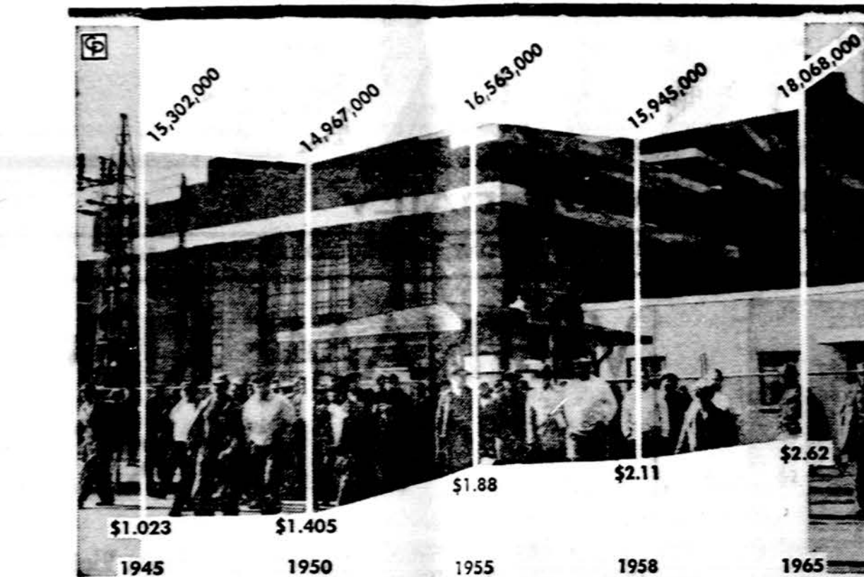
JAV Darbo Departmentas praneša, kad birželio mėn. dirbančiųjų skaičius rodė fabrikuose šį vaizdą, kuriame matomos pakilioms žymės darbuose ir valandiniame atlygime. Pastebėtinas kilimas nuo 1958 m. atoslūgio. Oirbančiųjų skaičius siekė 73.7 mil.

Washingtonas, D. C. — Karo su skurdu direktorius R. Sargent Shriver sako, kad nuo to laiko, kai prasidėjo karas su skurdu, tai yra per devynis mėnesius, karas palietė 3,100,000 beturčių, 1,200,000 jų palietė tiesioginiai, 1,900,000 netiesioginiai. Per tą laiką atidarytos 102 jaunuoliams darbo stovyklos, 75,000 beturčiams mokiniams buvo duota pašalpa, kad jie galėtų tęsti mokslą, 260,000 parūpinta darbo ar pasiūsti į amatų mokyklas, 10,000 beturčių gavo prienamomis sąlygomis paskolų ir 88,000 suaugusių tobulina savo amatus. Ateinančiais fiskaliniais metais,