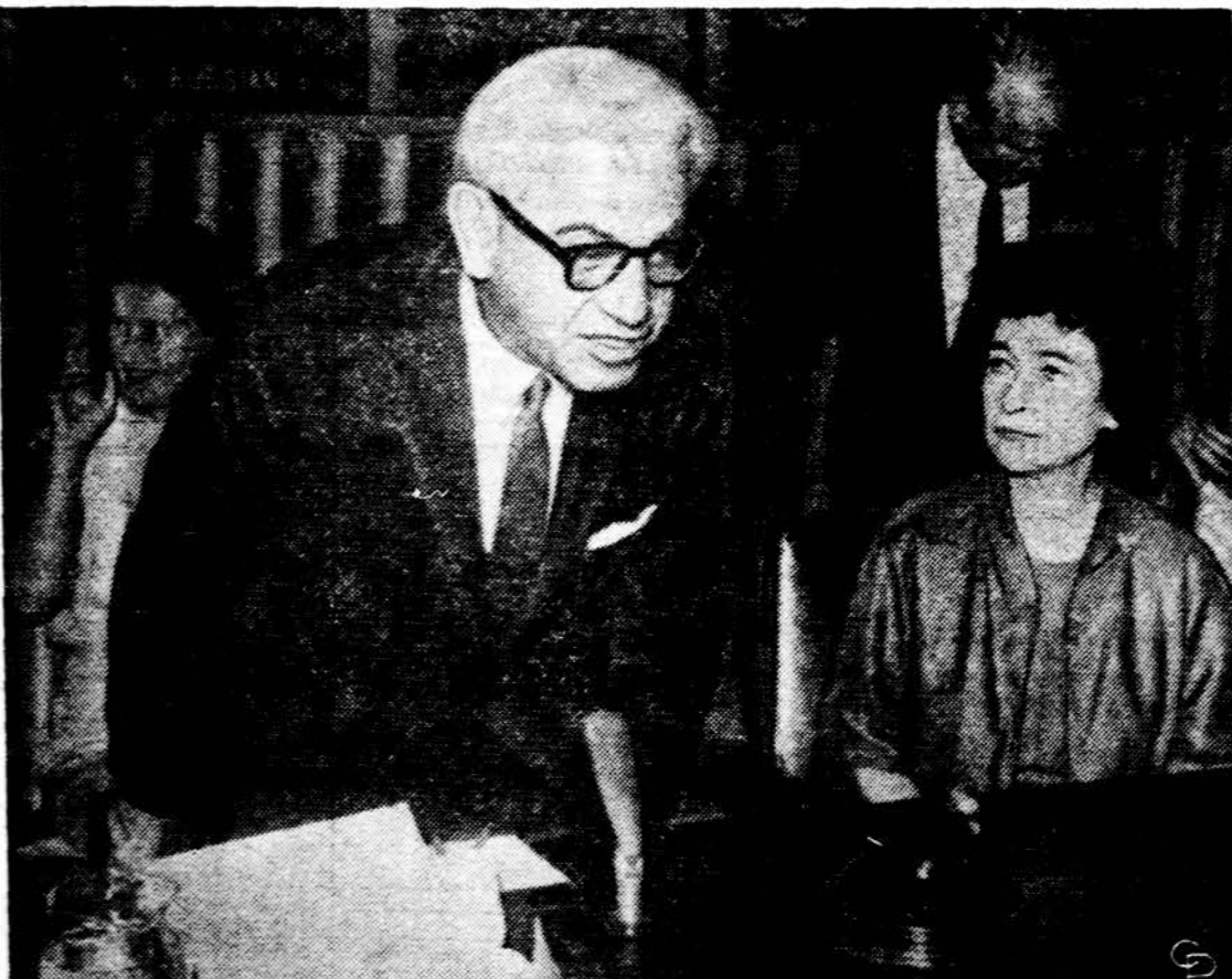
Arthur Goldberg, naujasis JAV ambasadorius Jungtinėse Tautoms, atsisėda prie savo žmonos spaudos konferencijos metu New Yorke. Jis pareiškė, kad jo pirmas rūpestis yra išlyginti tos pasaulinės organizacijos iškilusią paraližuojančią konstitucinę krizę.

Pavergę lietuviškąsias žemes nuo Maskvos iki Baltijos jūros, kruvinieji rusai, nutautindami ir tremdami iš gimtų sodybų lietu-vious, savo nieko neturėdami, pasisavino gausų lietuvių kalbos žodyną, tuo praturtindami (Nukeita į 5 psl.)