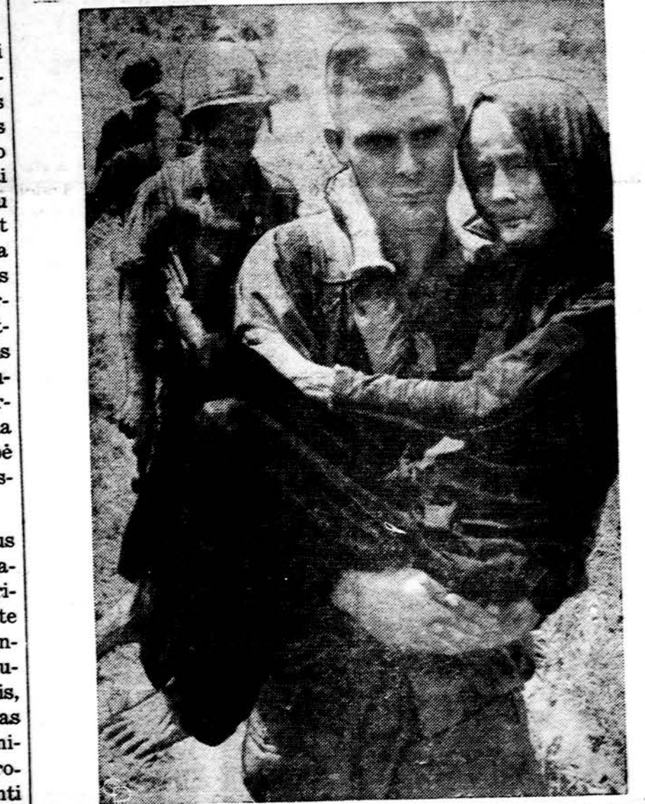
Sužeista Pietų Vietnamo moteris kautynėse 40 mylių nuo Saigono gabenama JAV karių į liginę Ba Ria mieste.

Popiežius Paulius VI pašventino akmenį, kuris buvo išimtas iš senosios Romos Sv. Petro bazilikos pamatų ir kuris bus nuvežtas į Stokholmą ir kaip kartinis akmuo padėtas naujai katalikų katedrai, kuri bus pastatyta tame mieste.