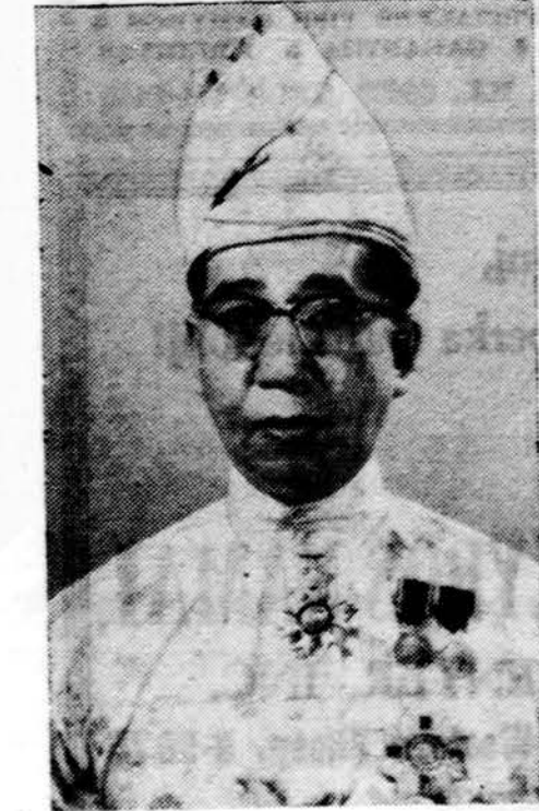
Sultanas Ismail Shah, 58 m., yra vienas kandidatų į Malaysia valstybės karaliaus postą. Renkamas penkiems metams.