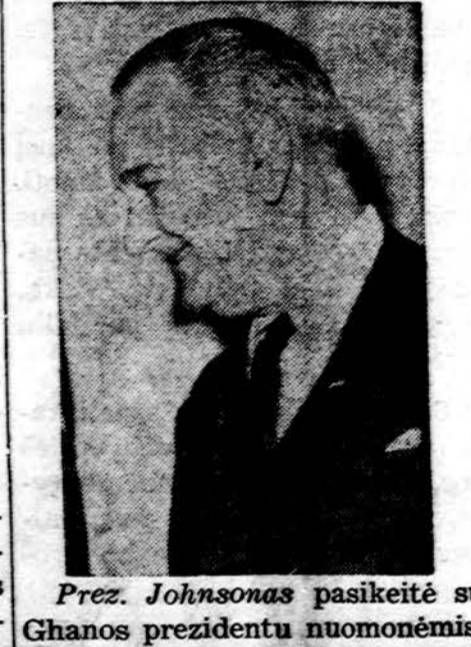
Prez. Johnsonas pasikeitė su Ghanos prezidentu nuomonėmis.

New Yorko arkivyskupijos kun. Theodore McCarrick buvo paskirtas Puerto Rico katalikų universiteto prezidentu.