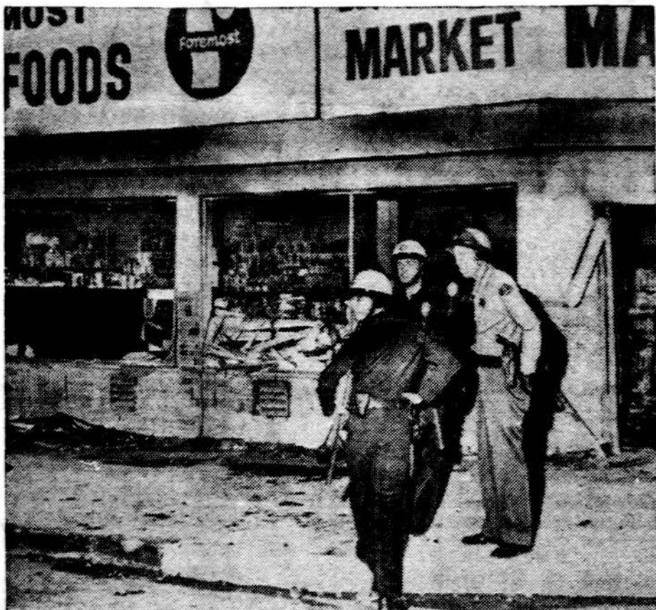
Policija stovi prie negrų išplėtos krautuvės Los Angeles mieste. Riaušinkai išlaužė langus ir duris.