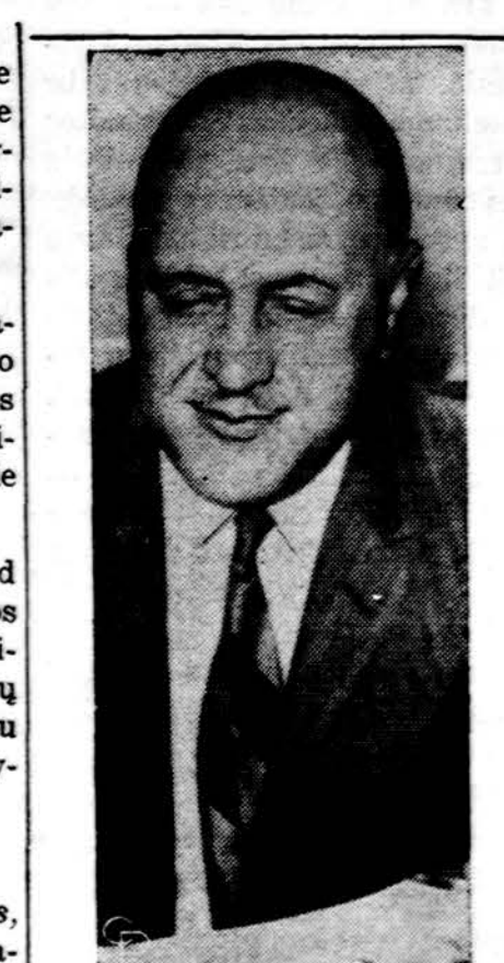
Kas bus naujo namų statybos ir urbanizacijos išvystymo departamento sekretorius? Kada bus įsteigtas naujas namų statybos ir urbanizacijos departamentas, berods į šį postą pateks dr. Robert C. Weaver, dabartinis namų statybos finansavimo įstaigos administratorius.

— Pietų Korėjos parlamentas, nedalyvaujant 62 opozicijos nariams, rugpjūčio 14 dieną ratifikavo sutartį, užmezgančią pilnoms diplomatinis santykius tarp Pietų Korėjos ir Japonijos pirmąjį kartą nuo 1910 metų. Parlamentas 110 balsų (nė vienas neabsolvi prieš) patvirtino naują diplomatinę sutartį.