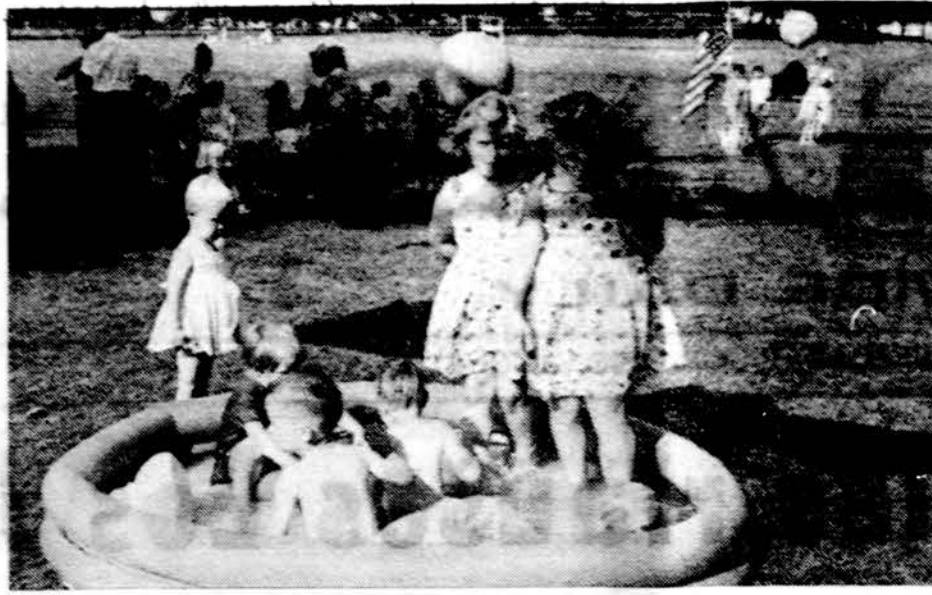
Jaunimas gražiai linksminasi Alvudo festivalyje Marquette parke

Kai neužsigavus kaulai lūžta Klausimas: Neužsigavau, nekritau ir niekas manęs nesužeidė — tai kodėl man šlaunikaulis iš geros valios lūžo? Gydymo jas sakė, kad tai dėl kaulo ligos atsitiko. Ar tai gali būti tiesa? Atsakymas: Ne tik gali, bet ir yra tiesa. Lūžti kaulas gali dviem atvejais: 1. jį laužiant; 2. jam susirgus. Visi kaulo lūžimai, kai jie atsitinka po to, kai kaulas esti bet kokios ligos susilpnintas, vadinami savaiminiais — patologiniais lūžimais (pathologic fractures). Tokie susilpnėjusi dėl kokios ligos kaulų lūžimai esti be išorinių pastangų — be užgavimo — spon taniški. Kartais prisidėjus laužiamoji jėga — trauma, dalykų sukomplikuoja. Slanksteliai dėl ligos esti suspaudžiami arba viškai suplojami. Kartais tam tikrose ligose kaulų lūžimai esti