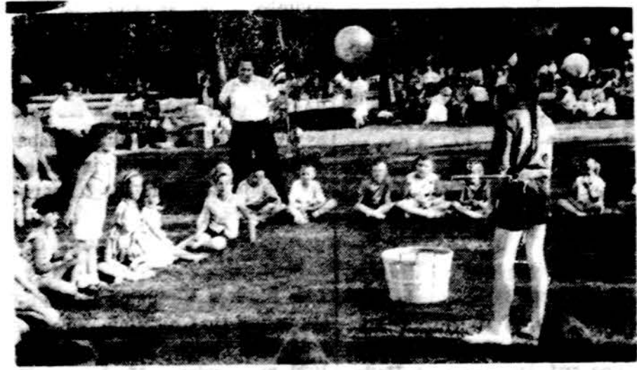
Vaukičiai Alvudo festivalyje.