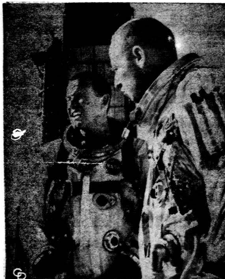
Astronautai Gordon Cooper (kairėje) ir Charles Conrad pasirengę iš Cape Kennedy kelionei apie žemės rutulį aštuoniom dienom. Raketos iššovimas numatomas rugpjūčio 19 d.

Kovų ir taikos sutarčių metai Kalbėdamas apie Pabaltijo santykius su Sovietų S-ga, prof.