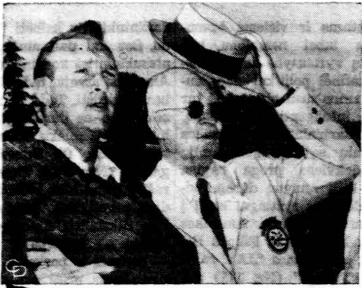
Buvęs prez. Eisenhower ir žinomas golfinkas Palmer stebi 47-tas golfo pirmenybes Laurel Country Club, Ligonier, Pa.