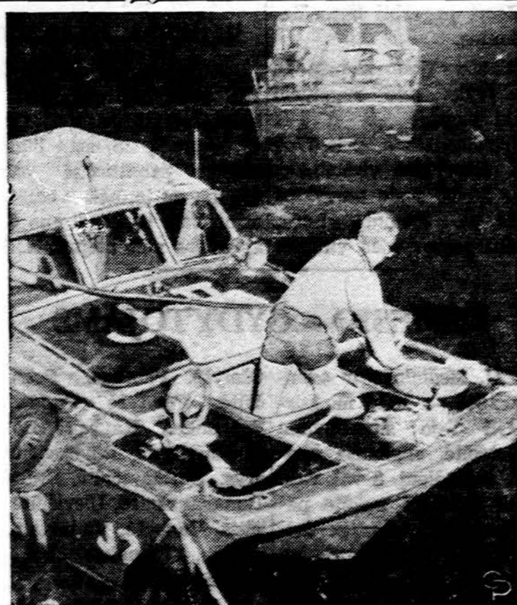
Michigan ežere nukrito United oro linijos lėktuvas, kuriame buvo 30 asmenų. Bandoma surasti žuvusiųjų kūnai, kurių jau keletas iškelta.

— Viceprez. Humphrey, kadangi neskiria spalvų, netarna-vo JAV kariuomenėje II-jo pavos "Tarptautinio bendradar-