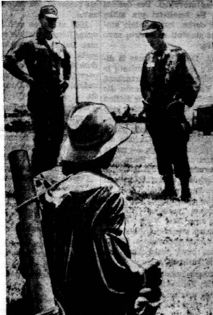
Skrbybėlėtas komunistinis Vietnamo sukilėlis buvo amerikiečių suimtas kautynėse netoli Duc Co. Ant nugaros jis turi mortarą.

— JAV karių yra žuvę: Korejos kare — 33,629, I Pasaul. kare — 53,402, II Pas. kare — 291,557, civiliiniame kare — 618,000, kituose karuose apie 10 tūkstančių.