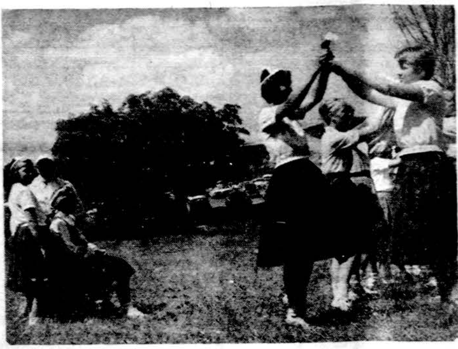
Sadutės šokis Dainavos pievose. Metinių švenčių metu. Dainavą aplanko daug svečių.