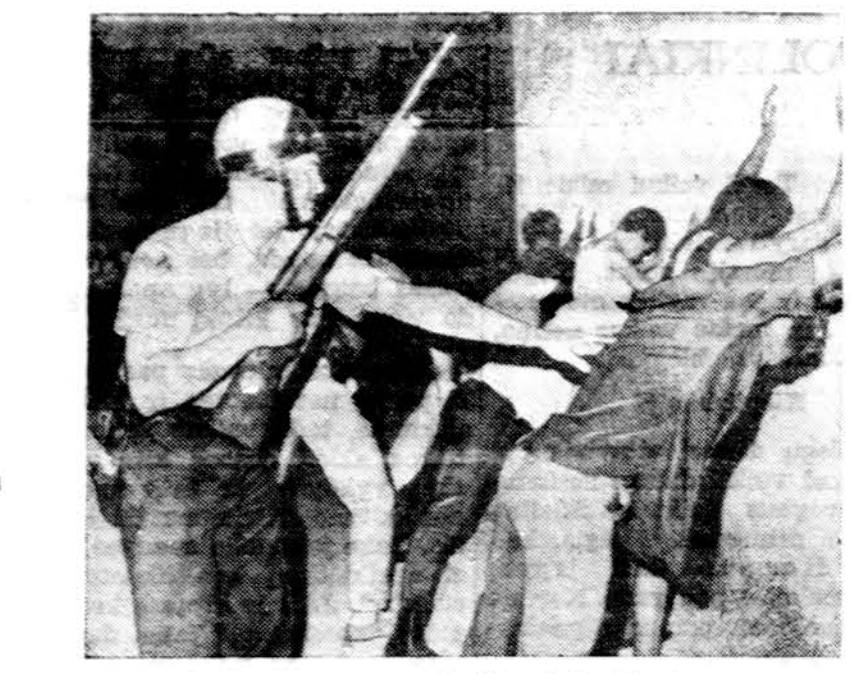
Long Beach, Calif., apieskomi riaušiminkai. Riaušės grėsė persimesti iš Los Angeles.