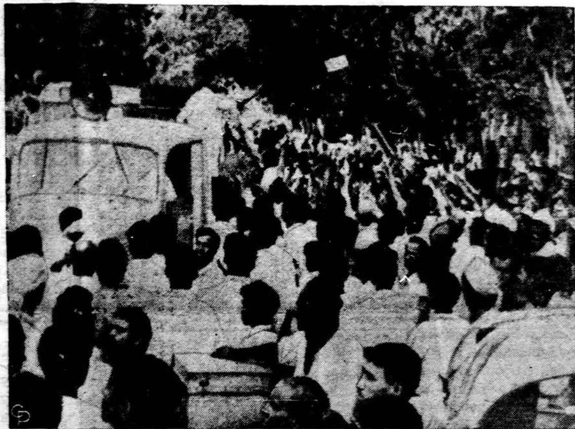
Indai susitelkę prie garsintuvo New Delhi mieste, perspėjančio, kad Pakistano bombonešiai gali pulti šią sostinę. Pakistanas pranešė, kad aštuoni Indijos sprausiniai bombardavo Karachi miestą, o Indija pasakė, kad Pakistanas puolė iš oro Calcutta.