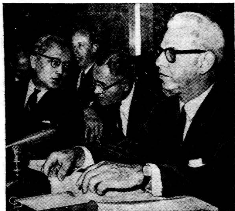
JAV-ų ambasadorius Arthur Goldberg (dešinėje) pirmininkavo Jungtinių Tautų Saugumo Tarybos posėdyje New York'e. Tame posėdyje buvo nutarta, kad generalinis sekretorius U Thant (kairėje) turi vykti į Indiją ir Pakistaną ir bandyti tuos kraštus sutaukinti, susišėsusius dėl Kašmiro. Su U Thantu kalbasi Ralph Bunche. U Thantas vakar kalbėjosi su Pakistano prezidentu Khanu.