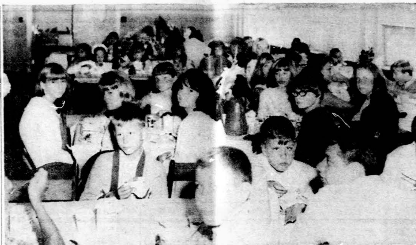
Rytinių JAV valstijų moksleivių atetintinkų stovyklos jaunimas prie pusryčių stalo Kennebunk Port, Nuotr. E. Meilaus

× Am. Liet. Montessori draug. Vaikų nameliai jau pradėjo naujus mokslo metus. Virš 40 vaikučių naudojami atnaujintom jaukiom patalpom. Paremkim Vaikų namelius atsilankydami į rugs. 25 d. ruošiamą "Rudens lapų balių." (Pr.)