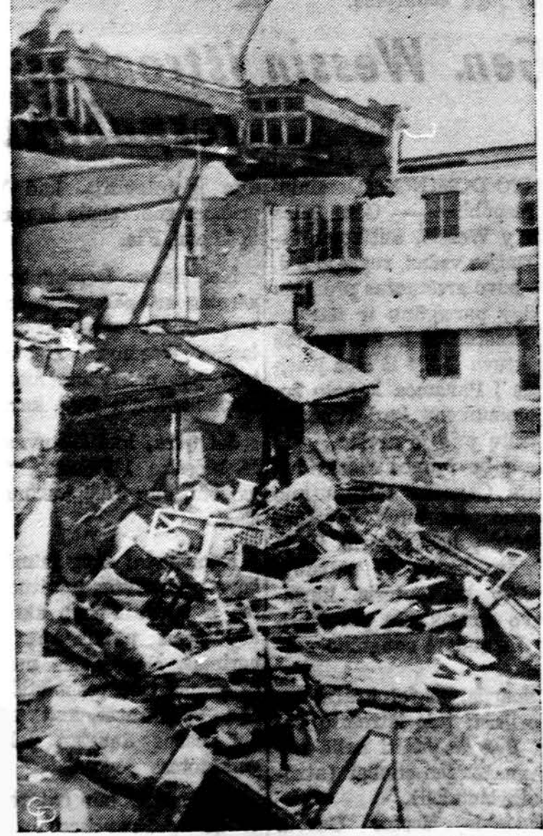
Bella Vista motelis Surfside, netoli Miami Beach, Fla., buvo labai apgriautas uragano Betsy.

Visais spaudos darbų reikalais teiraukitės šiuo adresu: "DRAUGAS" 4545 West 63rd Street CHICAGO, ILL. 60629 TEL. LU 5-9500