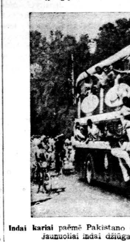
Indai kariai paėmė Pakistano dviejų aukštų autobusą netoli Lahore. Jaunuoliai indai džiūgauja Amritsaro pasienio mieste, Indijoje.

— Prezidentas Johnsonas rugsėjo 9 d. ragino sustiprinti S. Atlanto sąjungą (Nato).