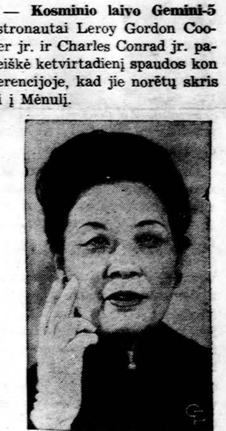
"Pekinas viską darys, kad jis gautų pasigrobti Pakistaną ir jį praryti". — pasakė Madame Chiang Kai-shek, laisvosios Kinijos prezidento žmona. Ji dabar yra atvykusi į JAV-bes.

— Kosminio laivo Gemini-5 astronautai Leroy Gordon Cooper jr. ir Charles Conrad jr. pareiškė ketvirtadienį spaudos konferencijoje, kad jie norėtų skris ti į Mėnulį.