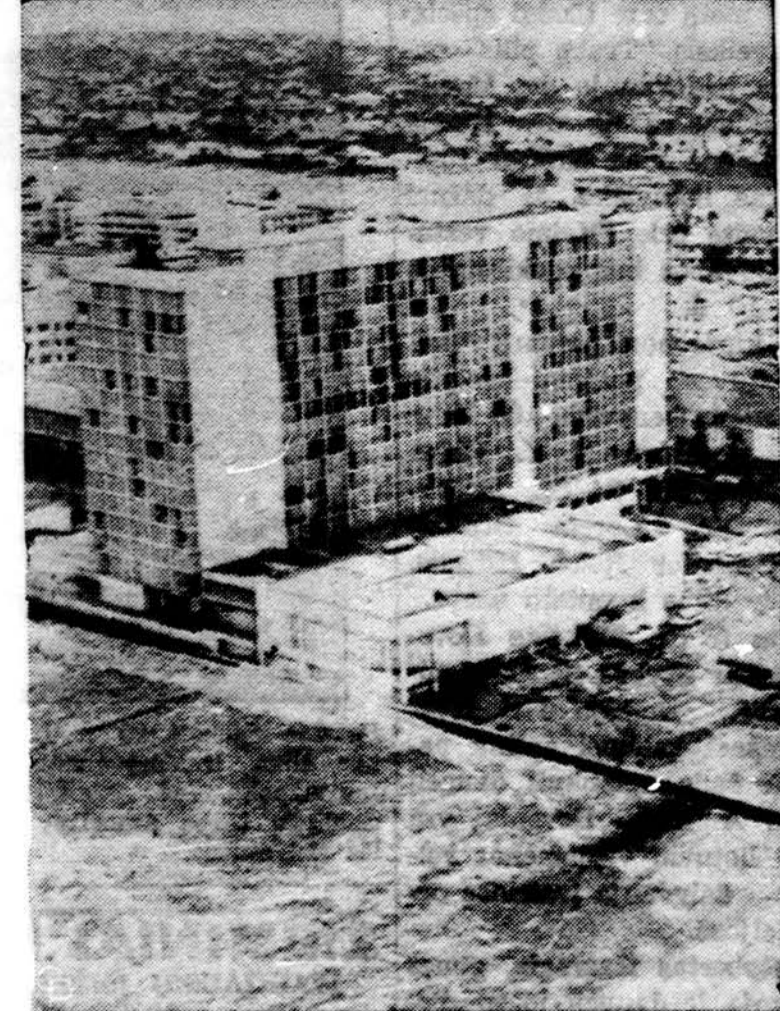
Uraganas Betsy Carillon viešbutį Miami Beach, Fla., paliko beveik be langų.

Šv. Tėvas Paulius VI, patyręs apie baisią nelaimę Šveicarijos kalnuose, kur ledyno griūntis užgriuvo daugiau kaip šimtas darbininkų — daugumoje italų, stačiusių užtvanką elektros jėgainei — pareiškė savo giliausią užuojautą ir per apaštališkąjį nuncių Šveicarijoje paskyrė žymią auką labiausiai nukentėjusioms šeimoms šelpti. Vatikano dienraštis, aprašydamas tą katastrofą, savo straipsnį uždavė: "Visas darbininkų pasaulis liūdi savo draugų, žuvusių einant savo pareigas!"