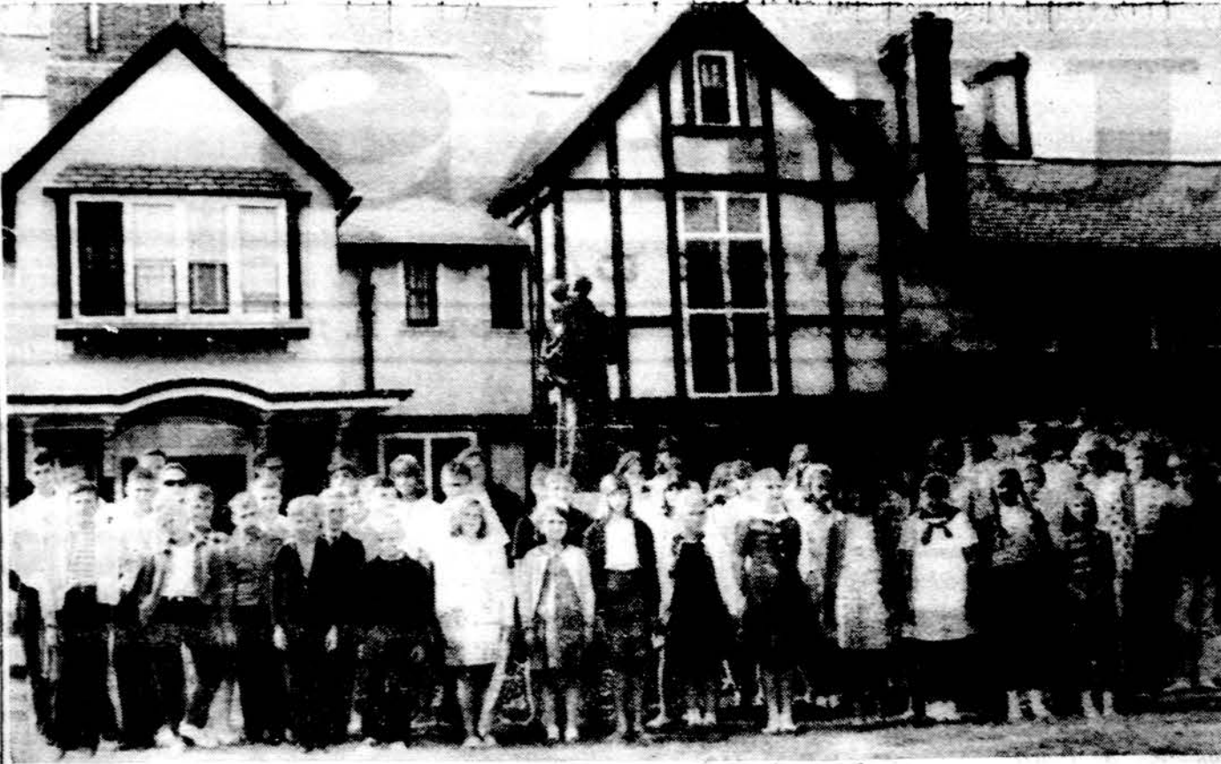
MAS Rytų stovyklos dalyviai tėvų pranciškonų sodyboje Kennebunkporte.

Studentai ateitininkai iš tikrųjų neužtenkamai padeda jaunučiams ir moksleiviams, nors vėl ta veikla priklauso nuo kiekvienos draugovės. Iš mūsų asmeniškio kontakto su vyresniais moksleiviais mes žinom, kad jie labai nori artimesnio bendradarbiavimo su studentais, o to pačio moro pas studentus ne labai mato, ši padėtis kyla iš fakto, jog eilinis studentas ne užtenkamai supranta, kad moksleiviai yra studentijos ateitis ir