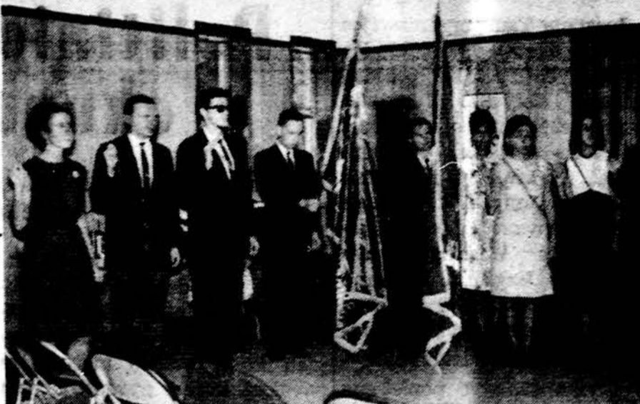
Studentų ateitininkų priesaika Dainavos stovykloje.

Stovykloje vyko SAS suvažiavimas, per kurį centro valdyba ir draugovės davė pranešimus ir buvo išrinkta 1965—66