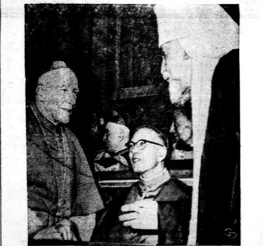
— Du buvę Sovietų Sąjungos kaliniai kard. Beran (kairėje) ir kard. Slipių (dešinėje) kalbasi Bažnyčios susirinkimo metu Vatikane. Jų pokalbio klauso Ceylono kard. Cooray.

— Ketvirtas cukraus fabri- kas Lietuvoje. Ateinančiais metais Kėdaičiuose numatoma statyti ketvirtąjį cukraus fabriką. „Tiesa“ informavo (rugs. 25, nr. 199), kad Lietuvoje veikia Marijampolės, Panevėžio bei Pa- venčių fabrikai vos spėja perdirbti jiems pristatomą medžiagą. Lietuvoje vis daugiau išauginama cukrinių runkelių, be to, nemaža cukraus pusfabrika- čių gaunama iš Kubos. Ketvirtojo cukraus fabriko projektus paruošė Maskvos projektavimo instituto specialistai. Fabrikas užimsias 35 ha. (E.)