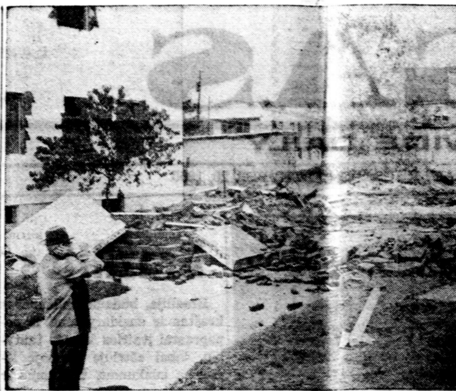
Dingo namas. Vedant naują autostradą dingo iš nakties pažymėtas nugriovimui penkių metų senumo namas Elizabeth N.J. Policija ieško kas galėjo šį vieno buto namą nugabenti.