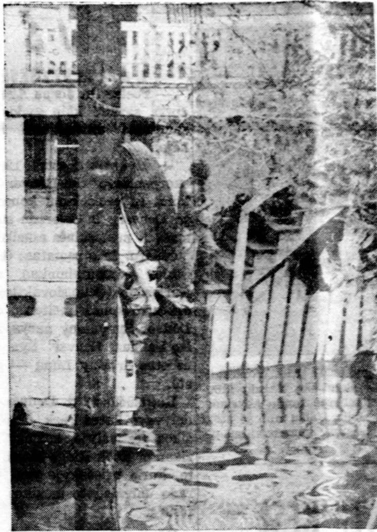
New Orleans policija ir kiti pagalbiniai daliniai valo miestą nuo žiurkių, gyvačių ir alkanų, klaidžiojančių šunų. Viešuliu pražūsus ir gyventojams dėl potvynių pasitraukus, daug darbo reik kol visa nukentėjusioji miesto dalis bus išvalyta.

JAV LB eina gana sunkiu, nors tiesiu keliu. Tačiau kiekvienas jos žingsnis pirmyn yra brangiai apmokamas darbu. Tasai darbas matomas atskirose apylinkėse, apygardose ir centrinėse įstaigose. Šie keli veidai tebūna apytikslis vaizdas tūkstančių darbininkų. Jais remiasi LB ir mūsų išsivijtos ateities. Jų auka — mūsų sėkmė.