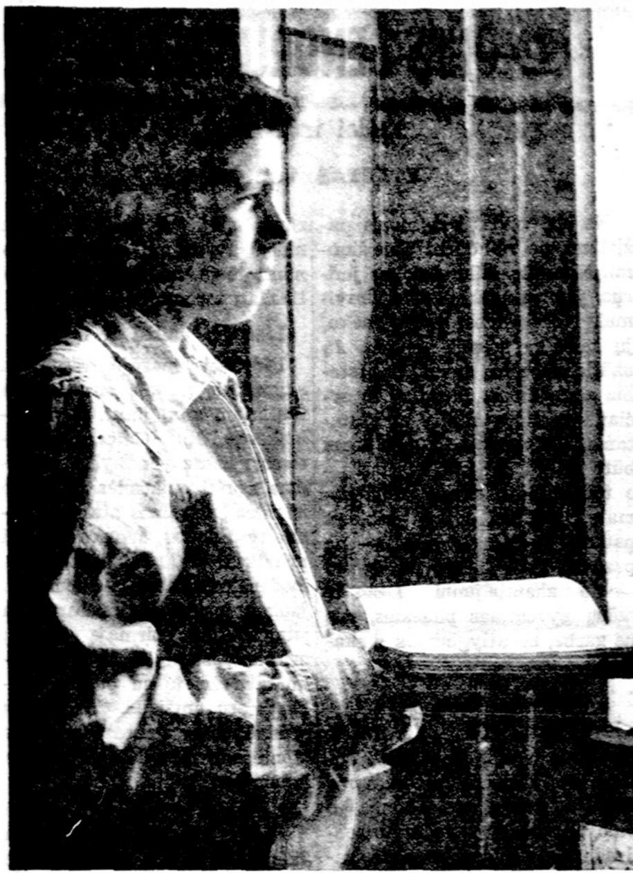
Mokslo metus pradėjus