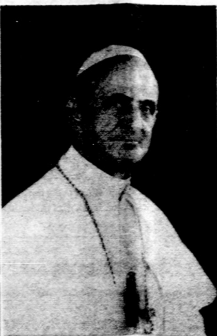
Popiežius Paulius VI

— Jungtinių Tautų Saugumo taryba įsakė Indijai ir Pakistanui sustabdyti karą tarp šių dviejų kraštų 72 valandų bėgyje.