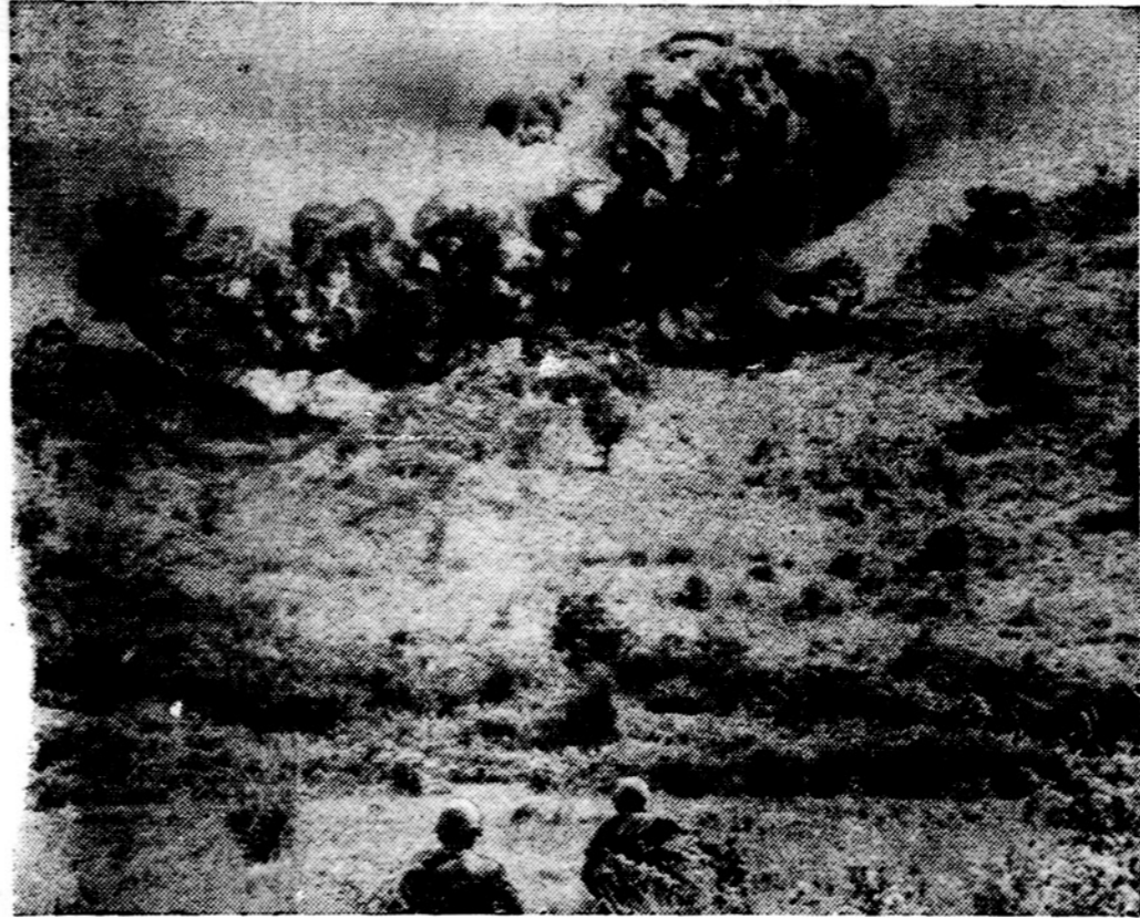
JAV parašūtininkai gaudo komunistus Vietname, netoli Qui Nhon. Šie 101 oro divizijos vyrai ieško partizanų prieš tai vietoves apmėtydami bombomis.

— Lietuvoje rugsėjo 4—14 d. vyko lenkų knygos dekada. Parodyta ir perduota nemaža Lietuvoje išleisčių knygų. Rytų bloko kraštų knygas ir kt. leidinius platina užsienio literatūros knygynas Vilniuje.