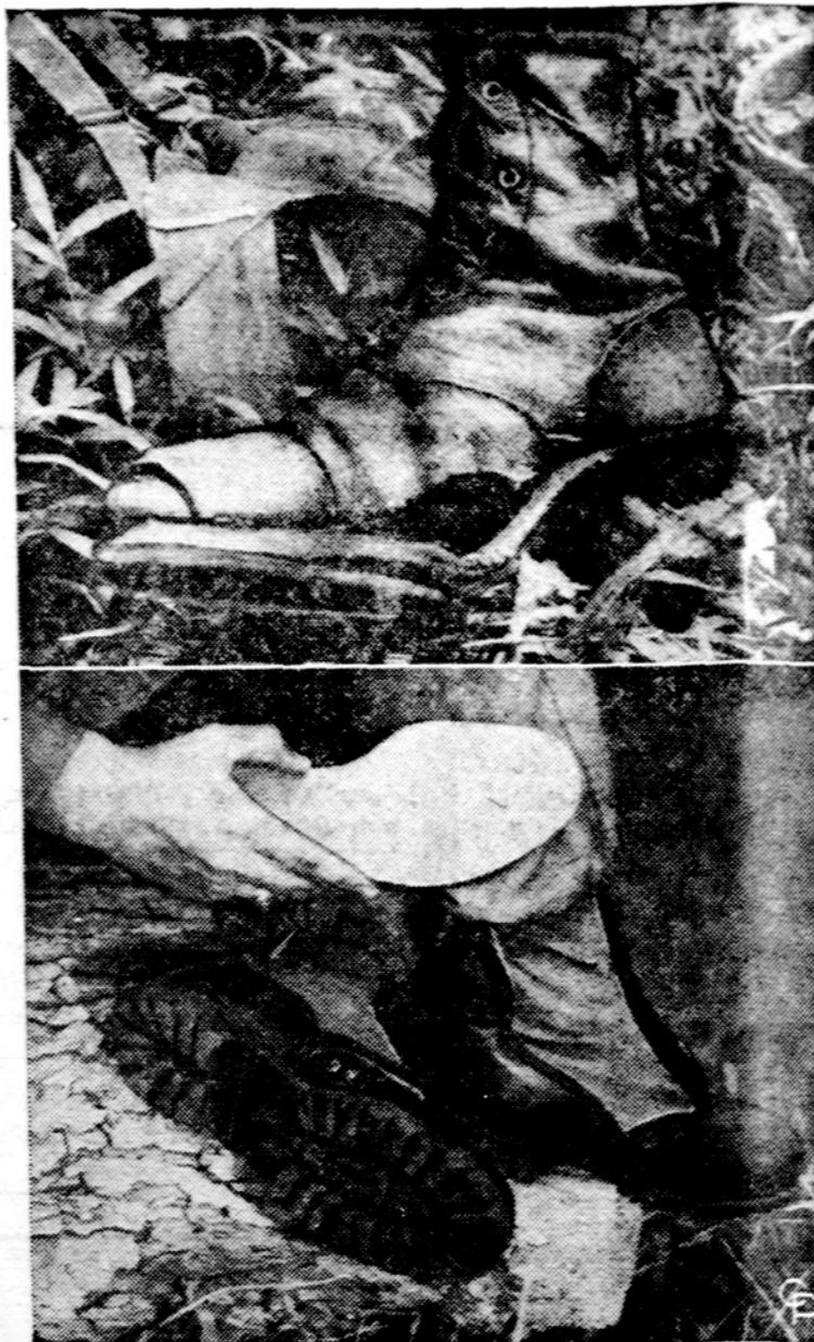
JAV paraštininkai batus Vietnamo sudėvi per šešias savaites, kaip matyti viršuj. Dabar padaryti specialūs batai su specialiai igulytom plieninėm papėdėm (laiko rankoje), kurios apsaugos nuo persidūrimų. Šie batai ananoma ilgiau laikys dziunglių kare.