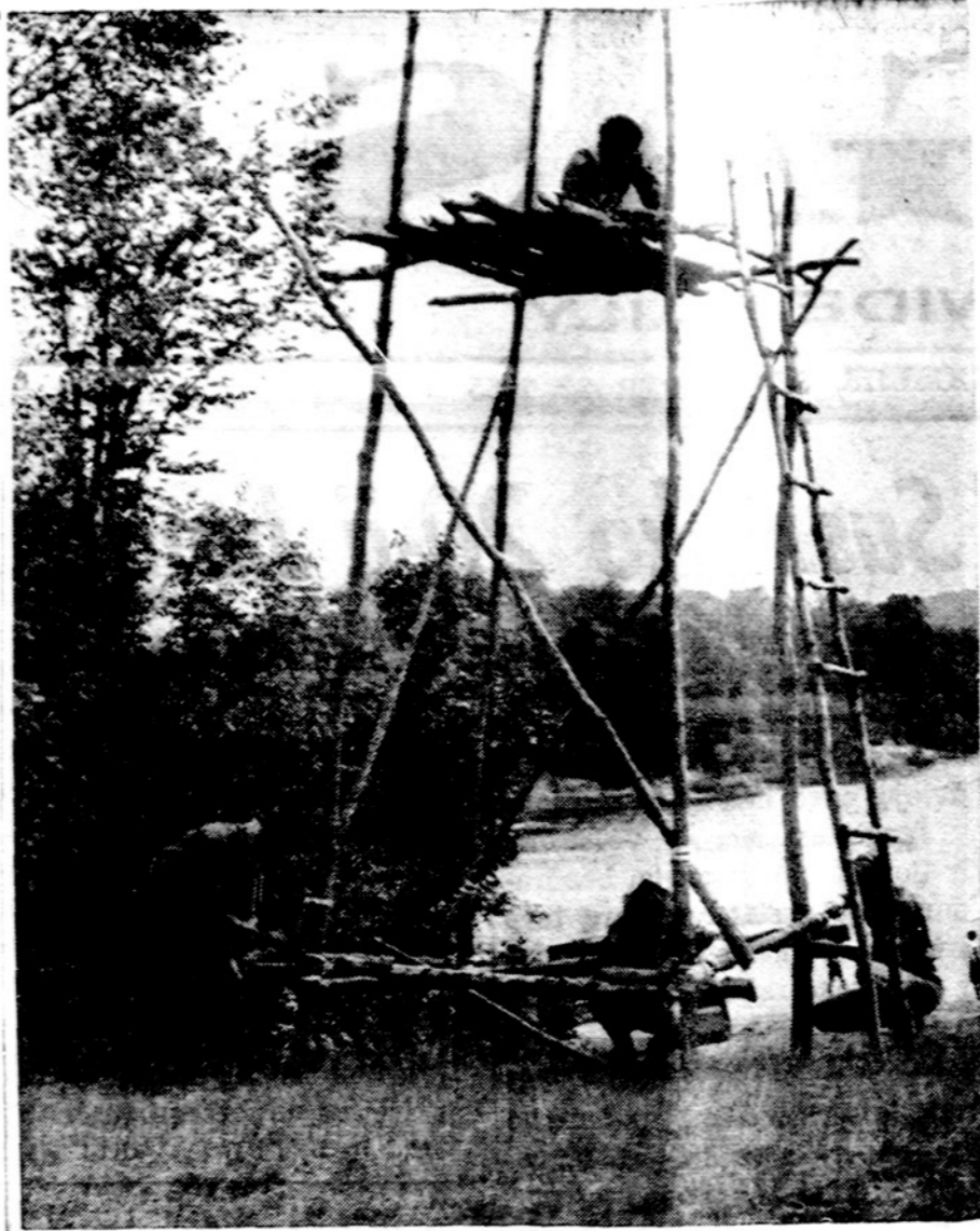
Sunkioji pionierių užsiėmimo metu. Brolijos pastovykloje skiltis stato stebėjimo bokštą LSS vadovų stovykloje, Kanadoje.