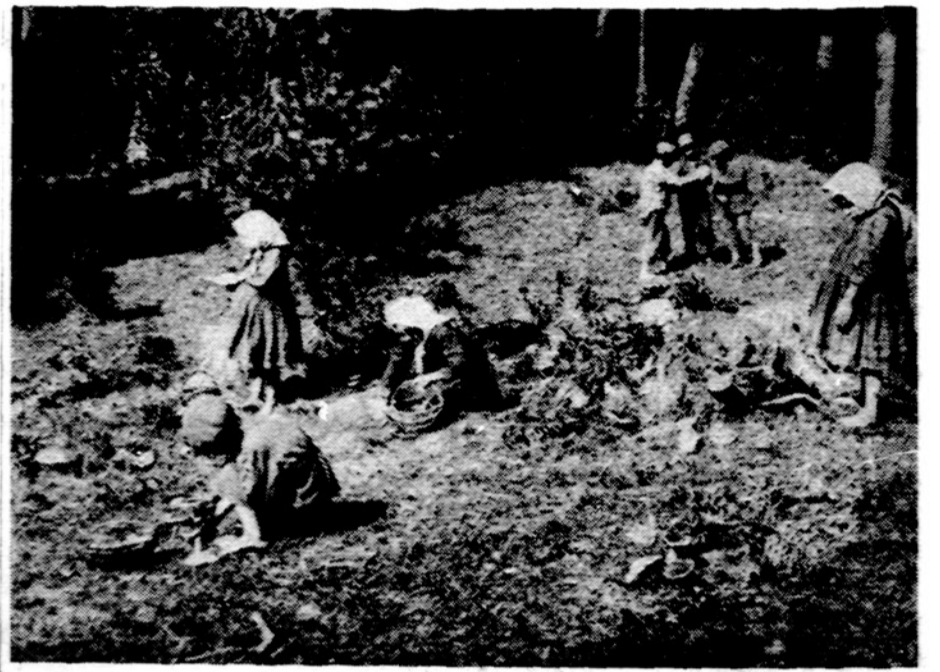
Ankstyvos grybautojos Lietuvos miške

Tada tas vyras atsistojo ir pradėta teisintis: — Ką jūs, ponai! Aš visai neskaitau!