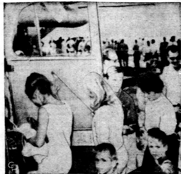
Apie 582 amerikiečiai evakuoti iš Lahore, Pakistane, vykstant pakistaniečių ir indų karui. Jie liktuvais buvo nuvežti į Tehraną, Irane, kur važiuoja autobusu.

Oro biuras praneša: Chicagoje ir jos apylinkėse šiandien — dalinai apsiniaukę, aukščiausia oro temperatūra 70 laipsnių. Saulė teka 6:38, leidžias 6:50.