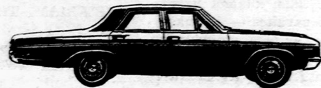
SPECIAL DELUXE 4-DR SEDAN