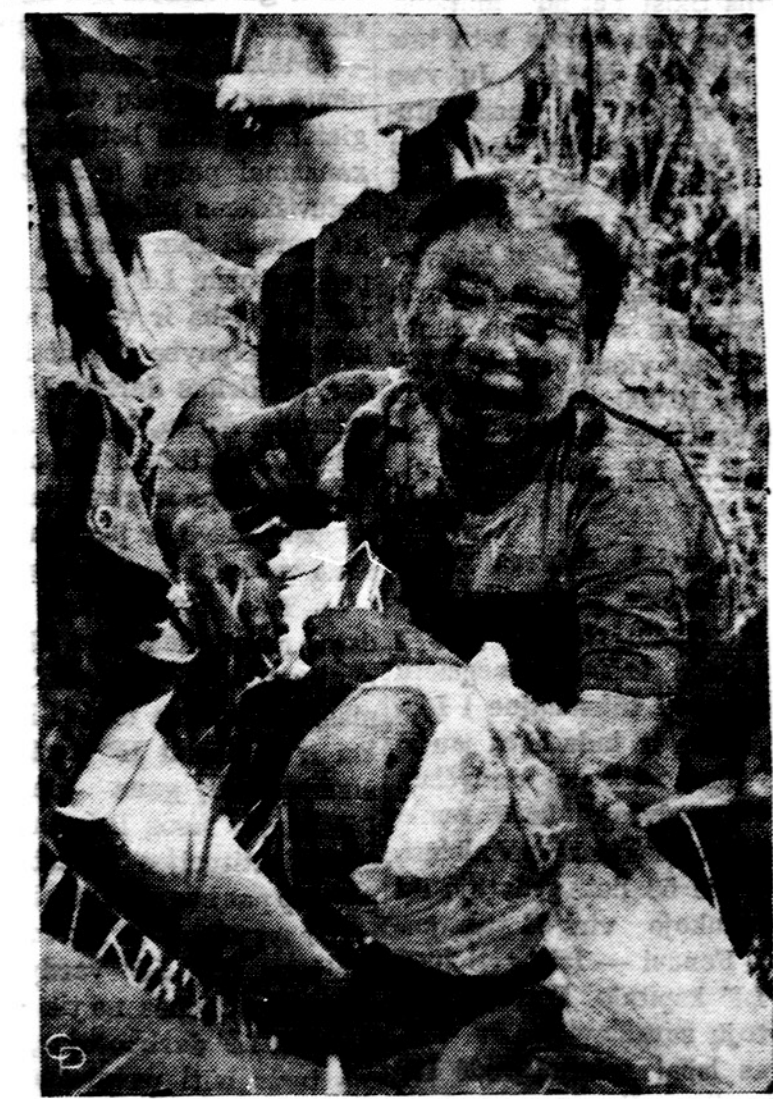
Sužeistai vietnamietis ir jos sūniū amerikietis karys suteikia pagalbą netoli Da Nang, kur žiaurus komunistiniai bandidai, nekrepdami dėmesio į civilinius gyventojus, išprovokuoja kautynes.