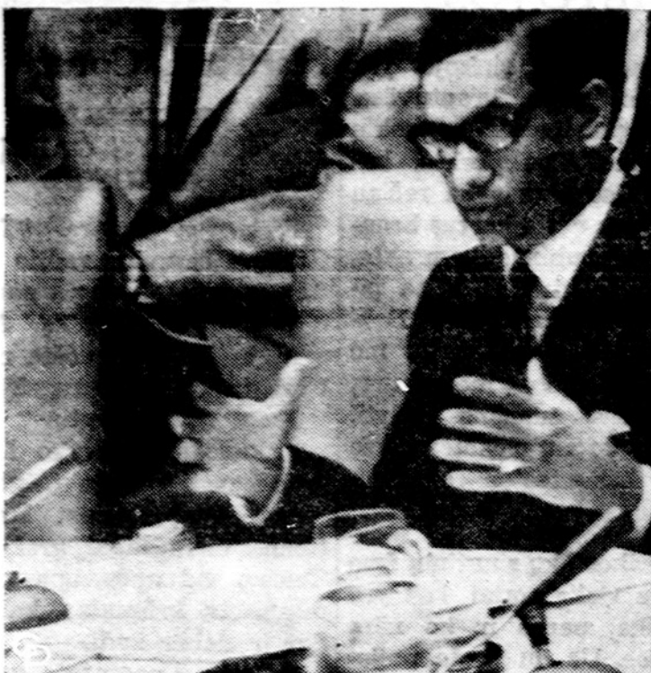
Pakistano atstovas Sofar pareiškė Jungtinių Tautų Saugumo Taryboje, kad jis pritarė generalinio sekretoriaus U Thanto pastangoms pas- kelbti tarp Indijos ir Pakistano paliaubas dėl Kašmiro.