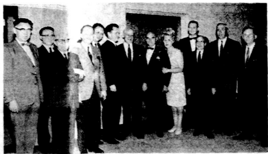
1965 m. LF narių suvažiavimas. Matyti viduryje sveičias iš Washingtono min. J. Kajekas ir visa eilė LF organizatorių bei spaudos atstovų.