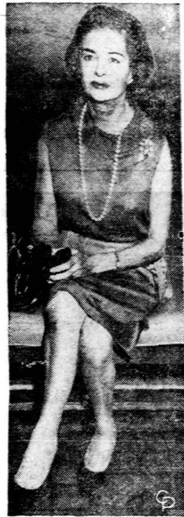
Nusiminusi 55 m. amžiaus aktorė Bennett pozuoja žurnalistei El Paso, Tex., po to kai ji gavo išsiskyrimą su filmu gamintoju Wanger. Visa šių skrybių tragedija yra ta, kad pora santalkoj išgyveno 25 metus, o po to gal mažiausiai likusio savo gyvenimo metų nebesugebėjo kartu išgyventi.

Siemet mirė Varšuvoje garsi lenkų rašytoja Maria Babrowska. Ji nebuvo žinoma kaip praktikuojanti katalikė, tačiau savo testamente ji parašė: "Noriu būti palaidota Romos katalikų apeigomis. Aš noriu, kad mano laidotuvis būtų pagarbota pareiškimas katalikų tikėjimo grožiui, kurioje buvau išauklėta; kad tuo būtų pareikšta pagarba Jonui XXIII, didžiausiam mūsų laikų žmogui, ir kad tai būtų pagarbos pareiškimas, tūkstanties metų krikščionybės tradicijoms Lenkijoje."