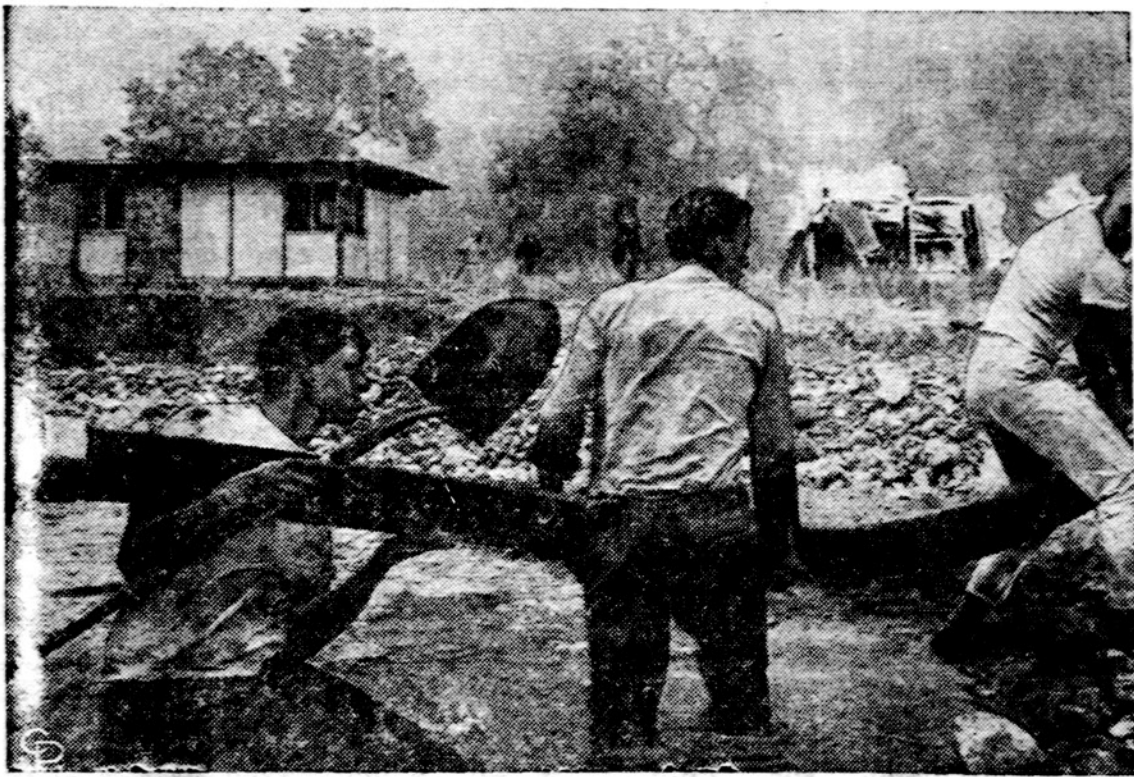
Šioje nuotraukoje parodyta kaip vyrai kovoja prieš miško gaisrus netoli Santa Rosa, Calif., degant namų užpakalyje. Apie 260 gaisrų sunaikino 600 namų penkių dienų laikotarpyje.