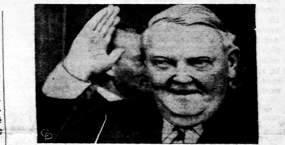
Vakarų Vokietijos kancleris L. Erhardas po parlamento rinkimų Bonnoje. Jis ir jo krikščionių demokratų partija laimėjo parlamento rinkimuose sekmađienį. Erhardas rinkimuose nugalėjo socialdemokratų vadą, W. Brandtą, vakarų Berlyno burmistrą.

Vokietijos ateitis, pagal „Tiesą“, neaiški. Kalbama apie prieš rinkimus buvusį tariamą neruotumą, primenami vokiečių vidaus reikalų ministro duomenys apie vakarų Vokietijos pogrindžio komunistų veiklą ir... prieinama išvada, kad Vokietijoje esama jėgų, kurios artimiausioje ateityje vis stipriau tarsiančios savo žodį. Atseit, skaitytojams įtaigojama, kad „monopolijoms“ ateina galas ir galėsia įsigalėti komunistai. Tačiau nežinoma, kad komunistų — partijos narių Vokietijoje beliko ne daugiau 7,000 ir, kad jų įtaka krašte visai nedidelė.