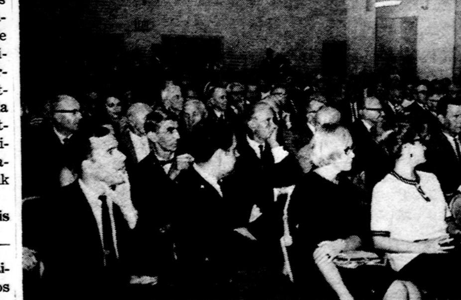
Susirinkusieji klauso dr. Algirdo Greimo paskaitos Jaunimo centre rugsėjo 17 d.

Daugumas manifestacijos išlaidų reikia mokėti jau dabar.