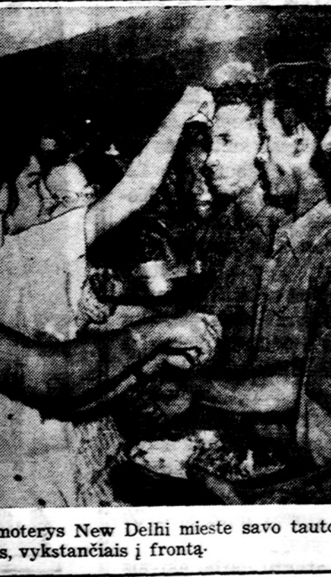
Indijos merginos ir moterys New Delhi mieste savo tautos papročiais atsisveikina su karais, vykstančiais į frontą.

Kas jums sako, kad jūs ne per darba į taupumą galite tapti turtingas, tas jums meluoja. B. Franklin