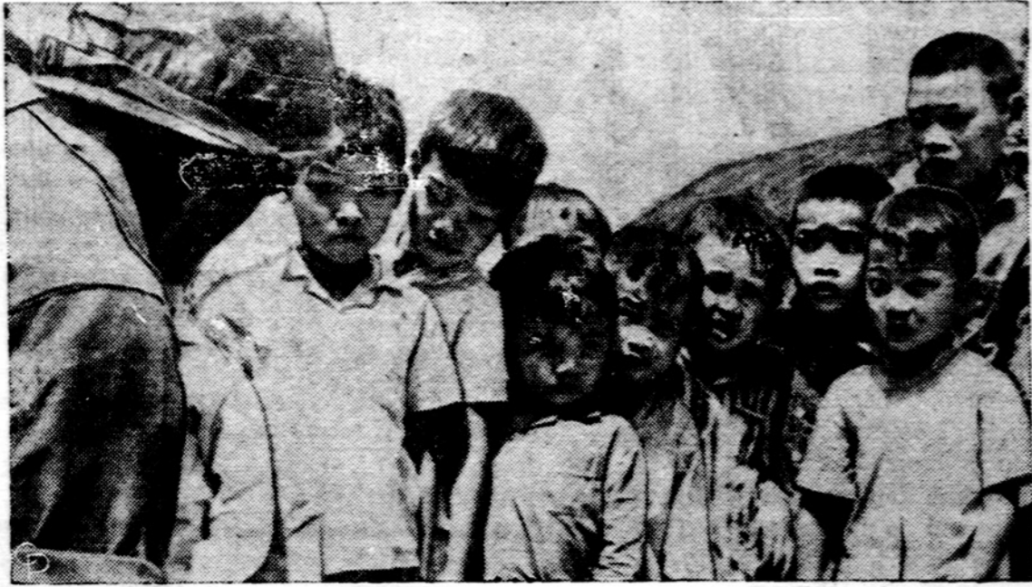
JAV-ų paraštininkas duoda vietnamiečiams vaikams įvairių dovanų — knygų, pieštukų, saldainių ir kitų skanumynų. Nuotraukoje yra mokyklinio amžiaus vaikai An Khe vietovėje, Pietų Vietname.