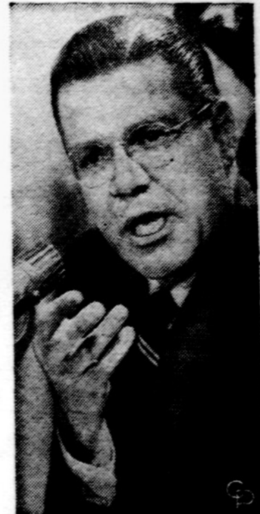
Gynybos sekretorius R. McNamara pranešė spaudos konferencijoje Pentagono Washingtono, jog 60,000 civilių bus pasamdyta ateinančiais metais, kad kariai dirbą raštines, galėtų atlikti kovos pareigas. Pasak jo, 75,000 karininkų ir karių-galės prisidėti prie karinio su-stiprinimo.

— Tarptautinis muzikos fes-tivalis. Rugsėjo 21-30 dienomis Varšuvoje vyksta tarptautinis muzikos festivalis, kuriame da-lyvauja muzikai iš 23 valstybių. Jų tarpe dalyvauja ir sovietų okupuotos Lietuvos styginis kvartetas.