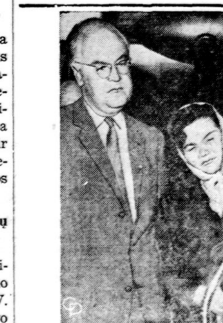
Sovietų Sąjungos kruvinojo režimo atstovai, jų užsienų reikalų ministras Gromyko Jungtinėse Tautose skaito raštą, kad reikia tautos duoti laisvę ir vengti karo. Šalia jo stovi vergiją laisvoms tautom nešančios Rusijos ambasadorius Jungtinėse Tautose Dobryninas su žmona. Laisvojo pasaulio žurnalistas mano, kad šie Sovietų Sąjungos žmonės prieš sąjūdį ir taiką turėtų paskelbti kiek jie pavergt tauti ir nužudę gyventojus.

Plačiai ir išsamiai pasikeitus nuomonėmis iškeltais klausimais, vieningai prieitos tokios išvados: