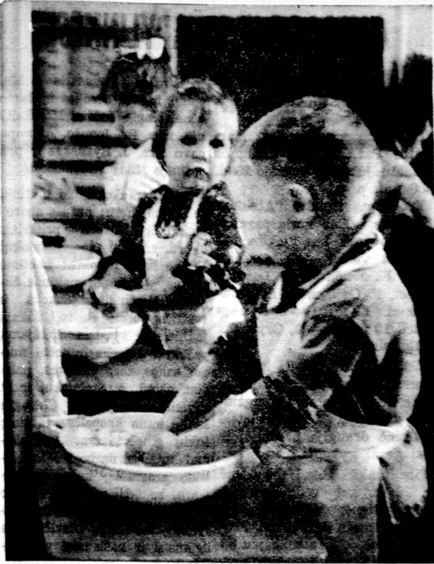
Kaip malonu būti savistoviam Am. Liet. Montessori draugijos vaikų namelių auklėtiniai mokosi plauti rankas, naudodami jiems pritaikytus mažus bliūdokus, mullikus ir staliukus.