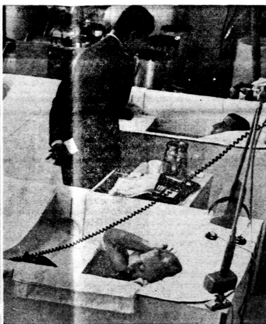
Douglas lėktuvų ir erdvių laivų dirbtuvėse Santa Monica, Calif. du astronautai dešimt dienų gulį alyvoje, kur tariamai kūnas nustoja svorio, kaip yra erdvėse. Mokslininkai tiria kaip žmogus jaučiasi psichologiškai, būdamas be svorio.