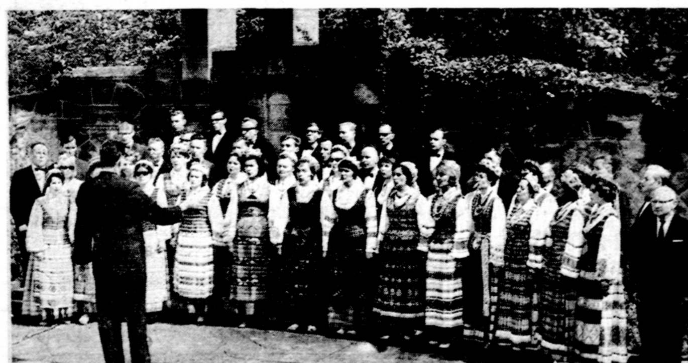
Čiurlioniečiai himnų giedojimo metu.