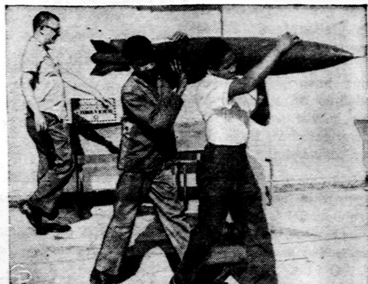
Bomba nešama iš sukilėlių Santo Domingo mieste ginklų surinkimo metu atiduoti laikinajai Dominikonų vyriausybei. Sakoma, kad komunistai daug ginklų suslėpė įvairiose vietovėse, kuriuos ketina panaudoti šios Karibų salos pasirobimui.

JAV-ųjų administracijoje esąs įsitikinimas, kad karas Vietnamo pakryps komunistų naudai, nors dar šis karas gali būti ilgas ir brangus.