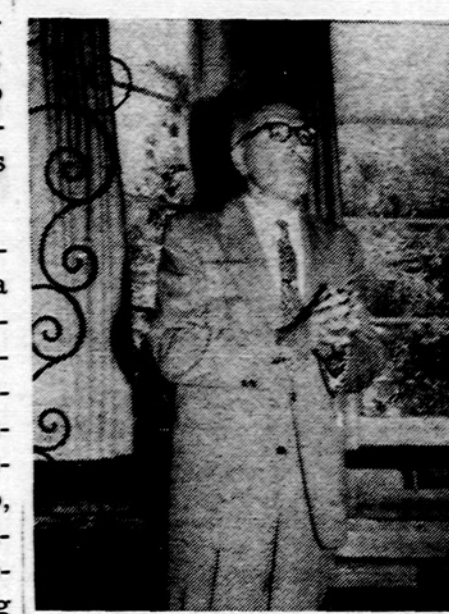
Dail. Br. Murino parodą stidaro rašyt. J. Tininis.

Muz. Giedrė Gudauskienė savo improvizacijomis palydės savo pasirodantį modeliuotojų. Modeliuojamas rūbas aptars A. Variakojienė ir Z. Brinkienė. Svečiai ir viešnios bus vaišinami kavute ir pyragaičiais. Įėjimas — 1 dol. V.