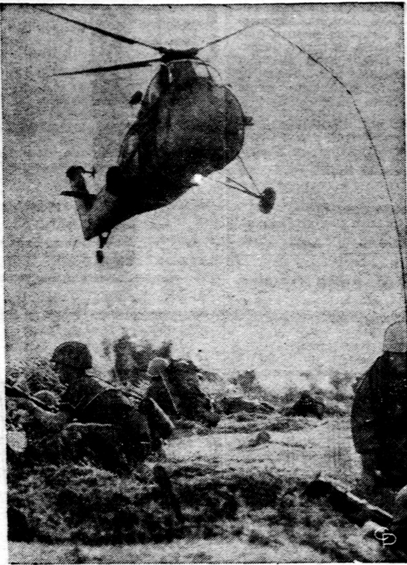
JAV-ų marinams, kuriuos puola Vietkongo partizanai komunistai netoli Qui Nhon, pristatoma helikopteriu pagalbinių karinių jėgų.