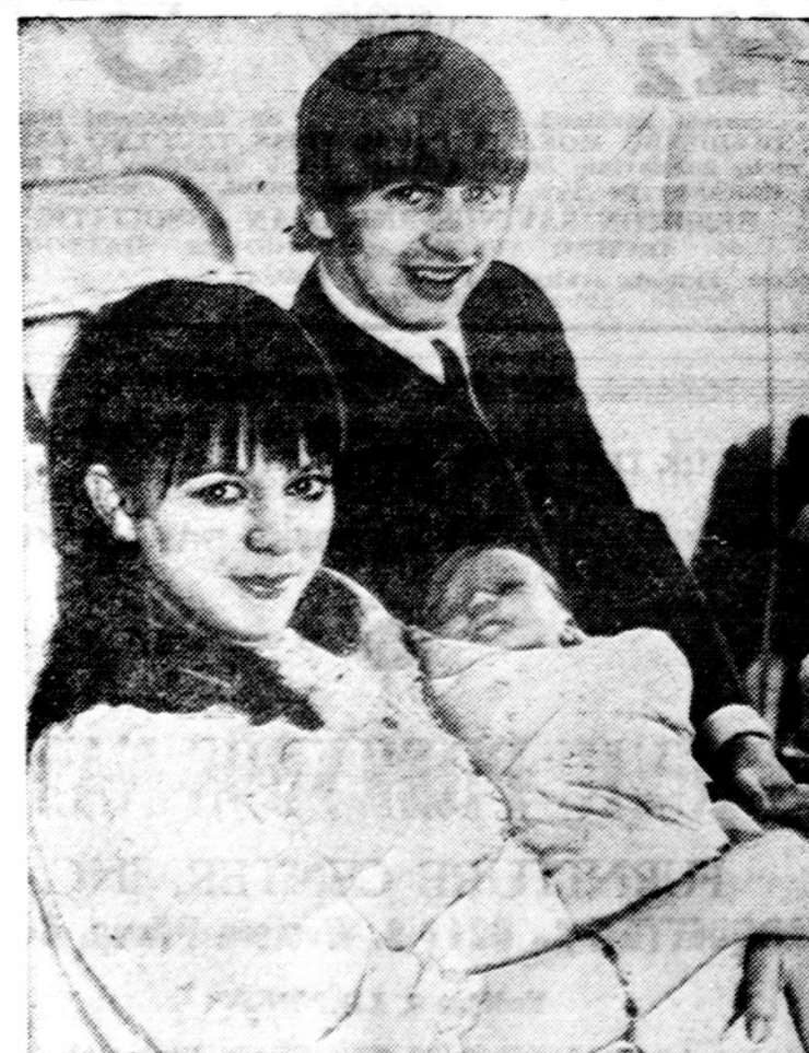
Vienas iš Britanijos kvarteto vadinamų Beatle tapo tėvu. Tai Ringo Starr su savo žmona ir naujagimiū sūnumi vienoje Londono ligoninėje.

Taip rašė Detroito laikraštis "Free Press" rugsėjo 14 d. Nr. 132. A. Grinius