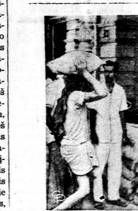
Indai smėlio maių sustiprinimus daro prie JAV informacijos tarnybos Kalkutoje, kad apsaugotų nuo galimų Pakistano puolimų.