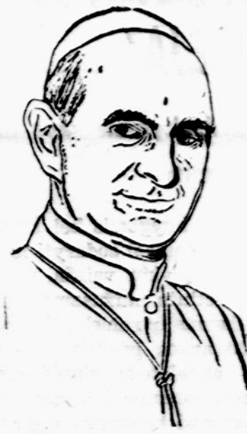
Sv. Tėvas Paulius VI atšventė 68-tąjį gimtadienį. Šį piešinį darė vienas dailininkas. Sv. Tėvas spalio 4 d. atvyksta į Ameriką.