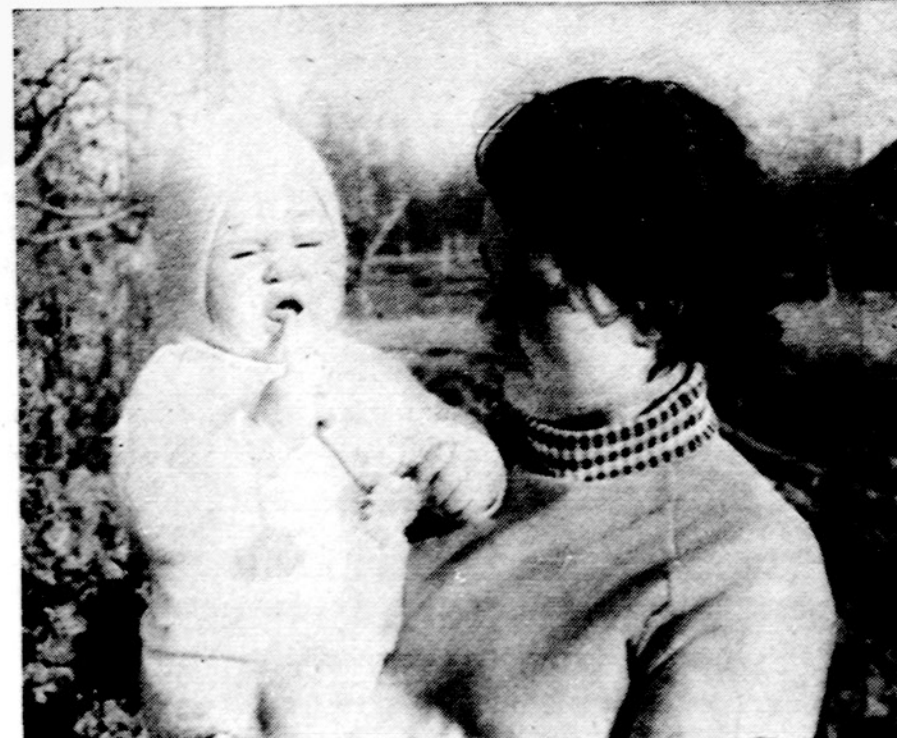
"Oi, kokia karti pienė". Lietuvoje bėpigū augti anūkėliui ir jo motulei jį auginti, kai Amerikoj esąs senelis juodvėjų neužmiršta.