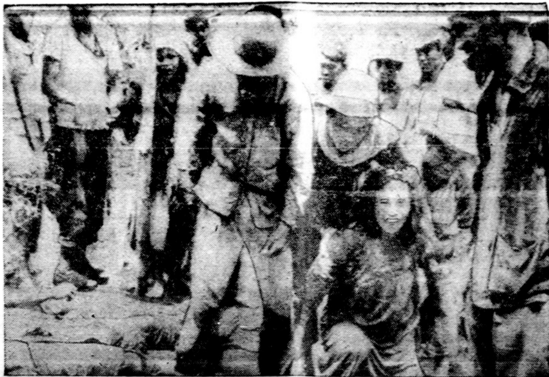
Philipinuose išsiveržęs Taal vulkanas padarė daug nuostolių. Tai pirmas išsiveržimas nuo 1911 m. Gabenamai žuvusieji (kairėj) prie Taal ežero. Iš viso žuvo apie 200 žmonių.

Valstybė, kur ujama religija, niekad negali būti gerai valdoma. — Leonas XIII