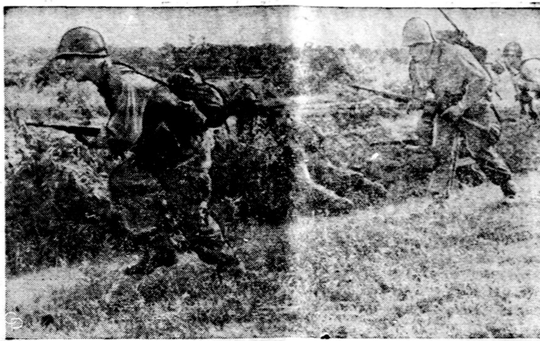
Amerikos 1-mos pėstininkų diviziono kariai puola komunistų snaiperių pozicijas netoli Bien Hoa Pietų Vietname. Amerikiečiai iškošė visas vietas, kur galėjo slėptis komunistinę vergiją nešą komunistiniai banditai.