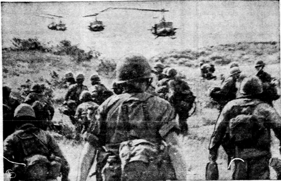
JAV-ų kariai valo Vietkongo slapiukus Deo Mang apylinkėje, Pietų Vietname

VOL. XLIX Price 10¢ Šiandien Draugas 14 pusl. ŠEŠTADIENIS, SATURDAY, SPALIS, October 2, 1965 Printed in 2 parts Kaina 10 ct. Nr. 231