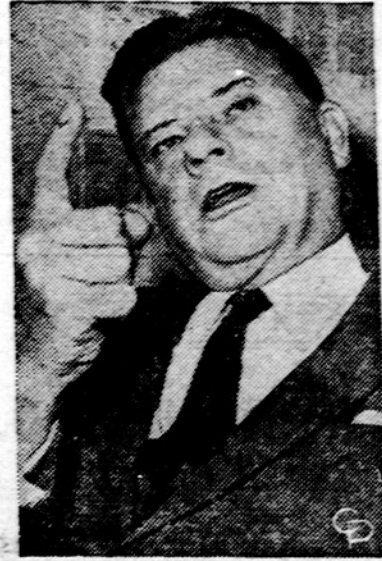
Sen. Morton (D.Ky) skelbia Washington, kad respublikonai turėtų kovoti prieš John Birch draugiją. Morton yra senato respublikonų rinkėtinės kampanijos pirmininkas