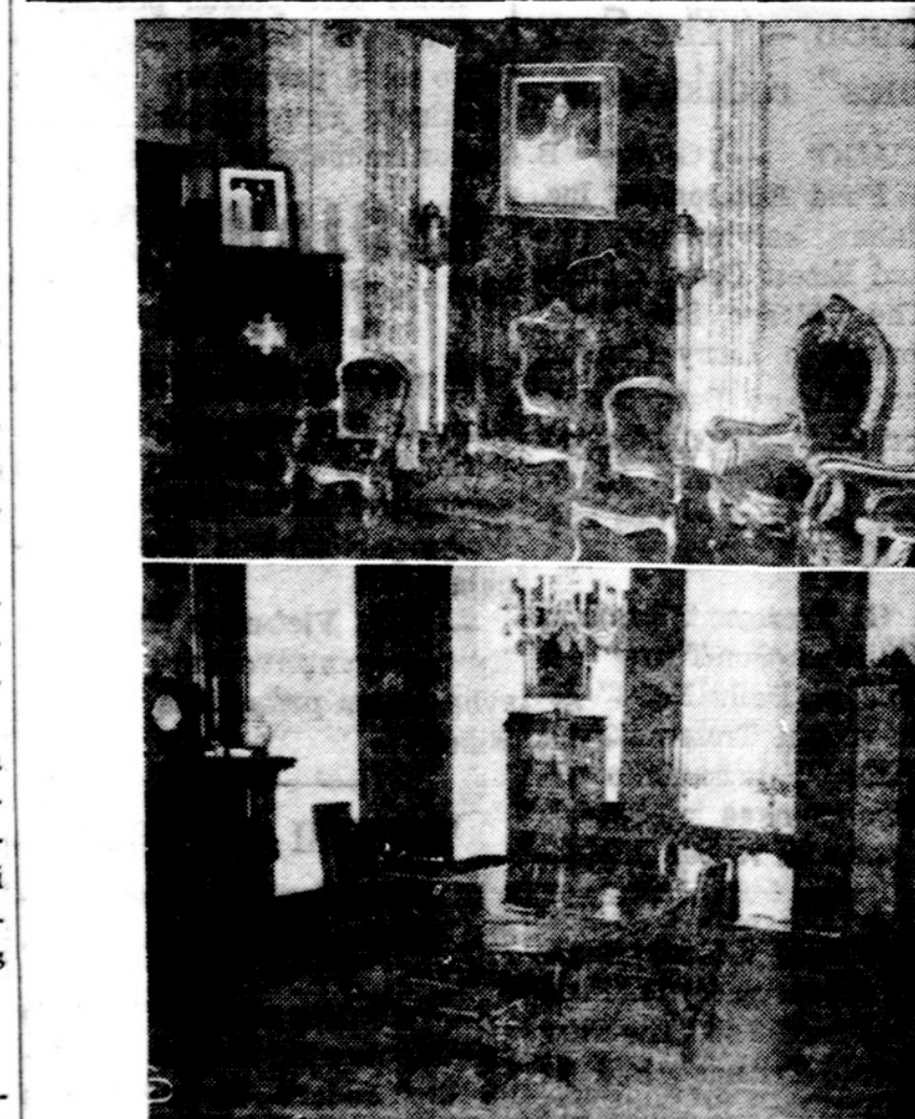
Čia yra du kambariai, kuriuose apaistos į New Yorką atvykęs šv. Tėvas Paulius VI. Viršuje kambarys, kuriame popiežius priims svečius, o apačioje valgomas.