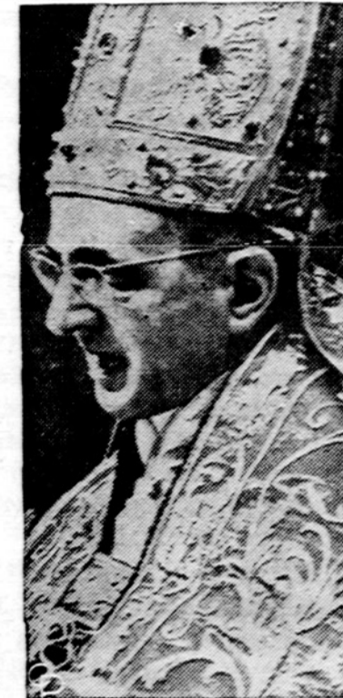
Popiežius Paulius VI-sis

rytą. Vyks maždaug 12 mylių greičiu Queens blvd. Trečia ave., 125 St. Central Parku į Sv. Patriko katedrą, kurią pasieks 12:30 val. Iš ten atsilankys į Waldorf Astoria pas JAV-bių ambasadorių Goldbergą, pas kurį susitiks su prezidentu Johnsonu; pusiau ketvirtą į 20-ją Jungtinių Tautų generalinę sesiją, ten pasakys didžiąją kalbą; iš ten 6 val. prie šventosios Seimos bažnyčios E. 47th St. ir Pirmosios ave. susitikimas su katalikų, protestantų, žydų organizacijom, akredituotom prie Jungtinių Tautų; 8:30 val. šv. Mišios už taiką Yankee stadione; 9:45 val. Vatikano paviljone parodoje ir 11 val. išvykimas iš Kennedy aerodromo. Televizijos rodyt Popiežiaus kelionę nuo pat išvykimo iš Ro-