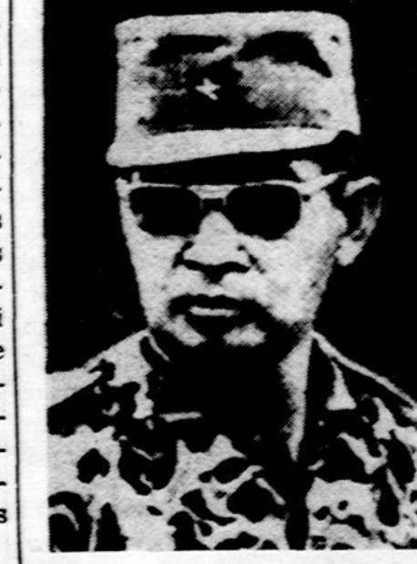
Maj. gen. Suharto, naujas Indonezijos armijos vadu.

JAKARTA, Indonezija. — Už vakar iš Indonezijos armijos vadu pareigų pašalintas kairiojo politinio sparno generolas ir jo vietoje paskirtas maj. generolas Suharto, kuris užgnaužė bandytą sukilimą prieš prezidentą Sukarną spalio 1 dieną.