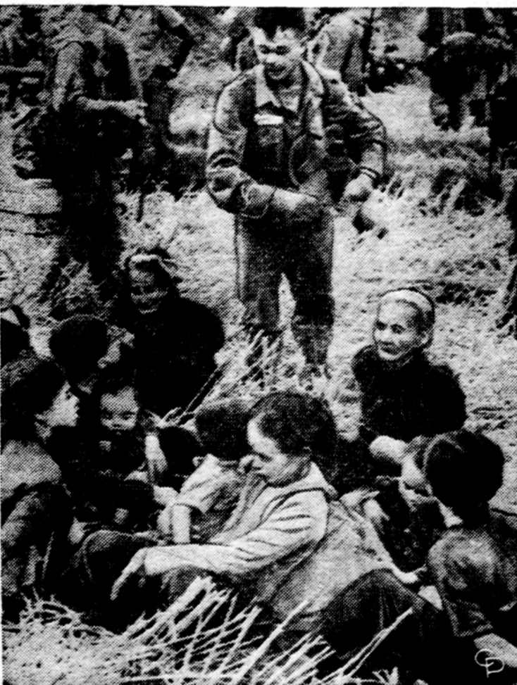
Vietnamo gyventojai laukia evakavimo iš karo zonos. Su jais pirmosios JAV divizijos vyrai.

Valstybės departamento agentūra tarptautiniam vystymuisi (AID) ieško Chicagos apylinkėse 90 gailestingųjų seserų, kurios savanoriškai vykdyt darbių į Vietnamą. Jų metinė alga būtų nuo $7,000 iki $12,000 su 25% priedu ir su buto aprūpinimu. Suinteresuotos gali nuo pirmadienio kreiptis į Essex Inn., 900 S. Michigan. Tarnyta būtų bent 18-kai mėnesių.